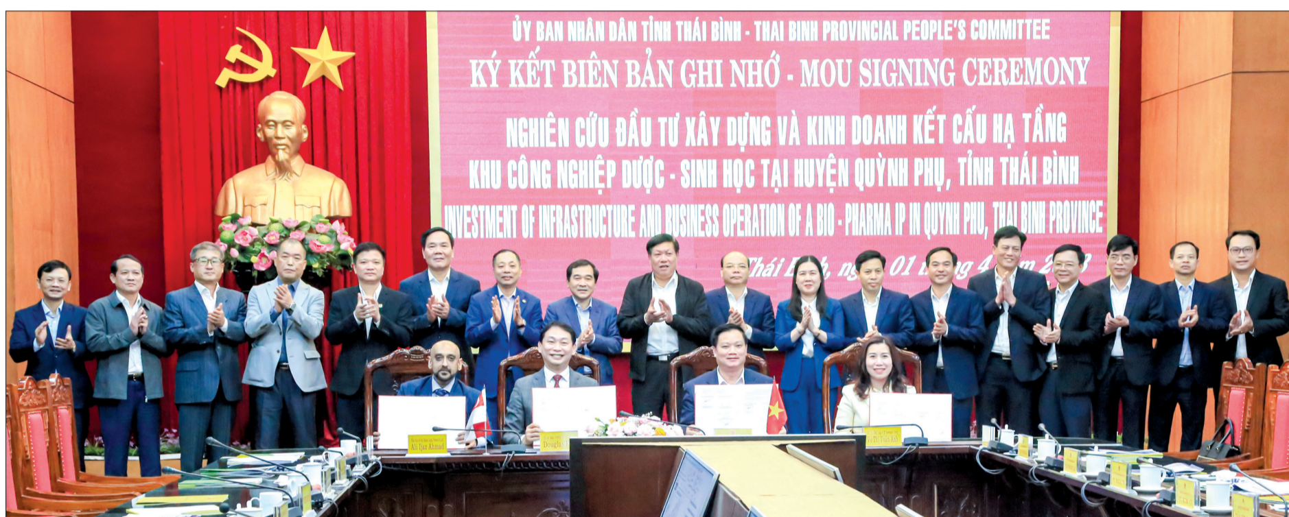
UBND tỉnh Thái Bình và liên danh các nhà đầu tư ký kết biên bản ghi nhớ về nghiên cứu đầu tư dự án xây dựng và kinh doanh kết cấu hạ tầng khu công nghiệp dược - sinh học tại huyện Quỳnh Phụ.