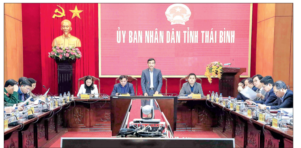
Đồng chí Đảng Trọng Thăng, Phó Bí thư Tỉnh ủy, Chủ tịch UBND tỉnh phát biểu tại cuộc họp.