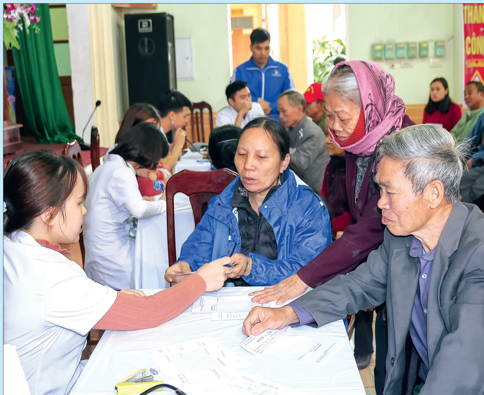
Khám bệnh, cấp thuốc miễn phí cho các đối tượng chính sách, người nghèo xã Minh Châu (Đông Hưng).