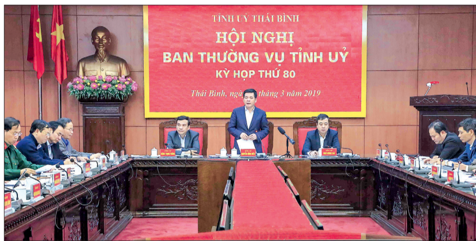
Đồng chí Nguyễn Hồng Diên, Ủy viên Trung ương Đảng, Bí thư Tỉnh ủy, Chủ tịch HĐND tỉnh phát biểu tại hội nghị.