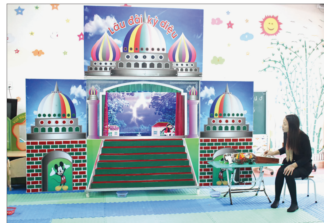
Bộ đồ dùng dạy học đa năng được thiết kế giống như một tòa lâu đài.