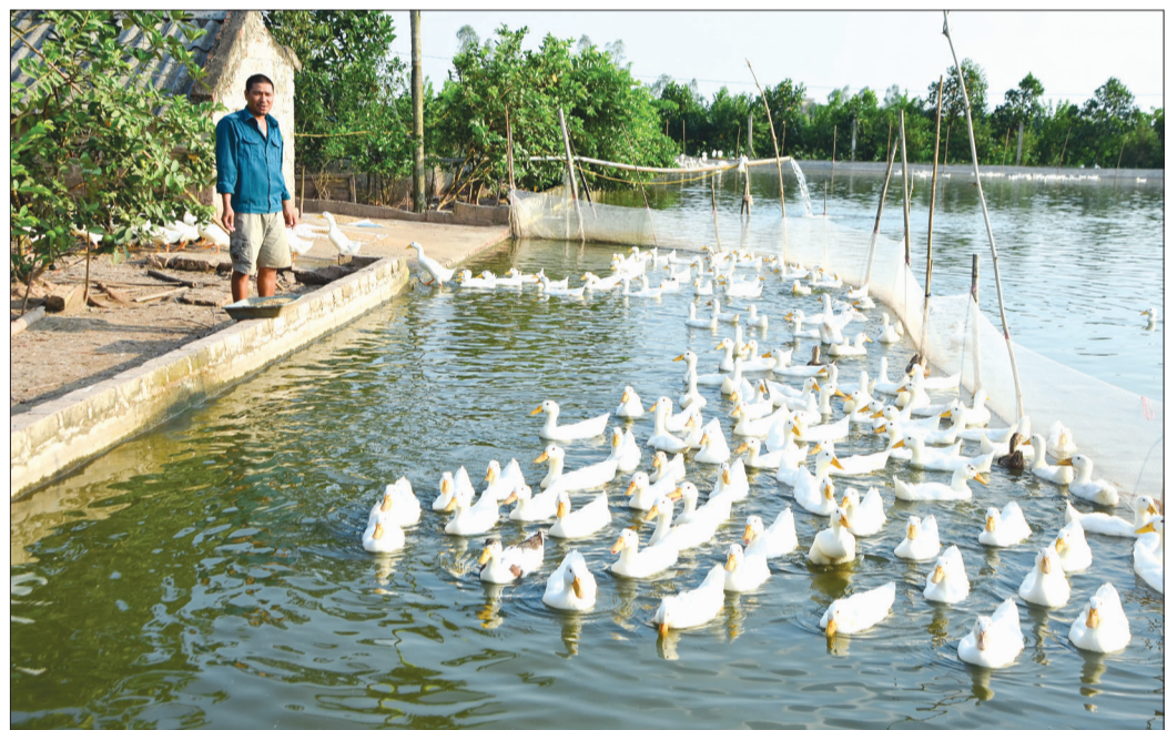
Hỗ trợ vốn phát triển sản xuất sẽ giúp nhiều gia đình sớm vươn lên thoát nghèo.

Để giúp hộ nghèo, hộ cận nghèo có điều kiện phát triển sản xuất, nâng cao thu nhập và vươn lên thoát nghèo, năm 2017, thông qua các chính sách hỗ trợ giảm nghèo, tỷ lệ hộ nghèo, hộ cận nghèo toàn tỉnh giảm so với năm 2016, nhiều hộ đã thoát nghèo, đời sống từng bước được nâng cao.