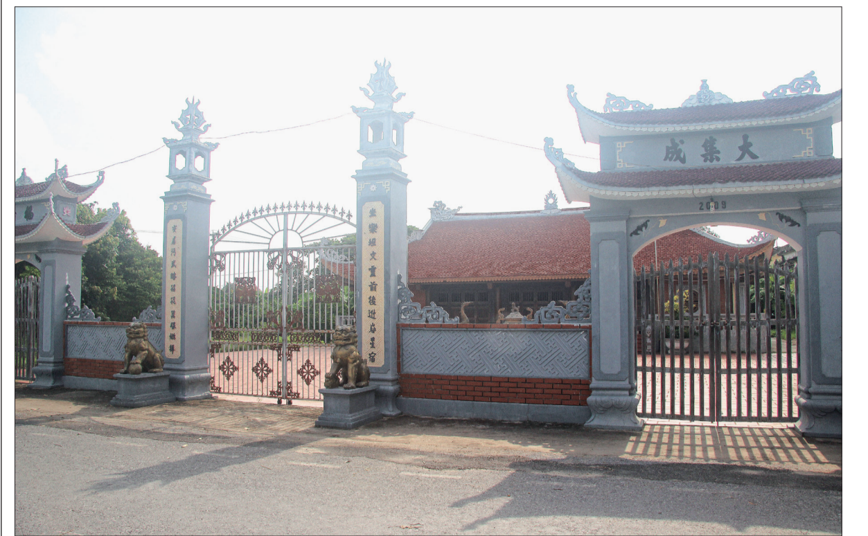
Đình làng Thanh Giám (xã Đông Lâm, huyện Tiên Hải).

Xã Đông Lâm (Tiên Hải) là nơi diễn ra cuộc biểu tình lịch sử của nông dân vùng lên chống thực dân Pháp năm 1930 - bản anh hùng ca bất diệt đánh dấu mốc son trong lịch sử đấu tranh cách mạng của huyện Tiên Hải. Sức sống mới của làng quê Đông Lâm hôm nay đã minh chứng cho sự chuyển mình của vùng đất cách mạng kiên trung. Những ngôi nhà cao tầng mọc lên san sát, màu xanh của đồng ruộng tươi tốt, nhà máy, xí nghiệp hoạt động nhộn nhịp... đã góp phần phát triển kinh tế - xã hội.