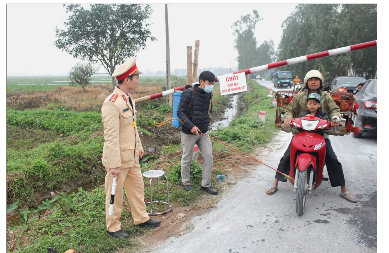
Lực lượng kiểm dịch phun hóa chất khử trùng phương tiện ra vào vùng dịch.