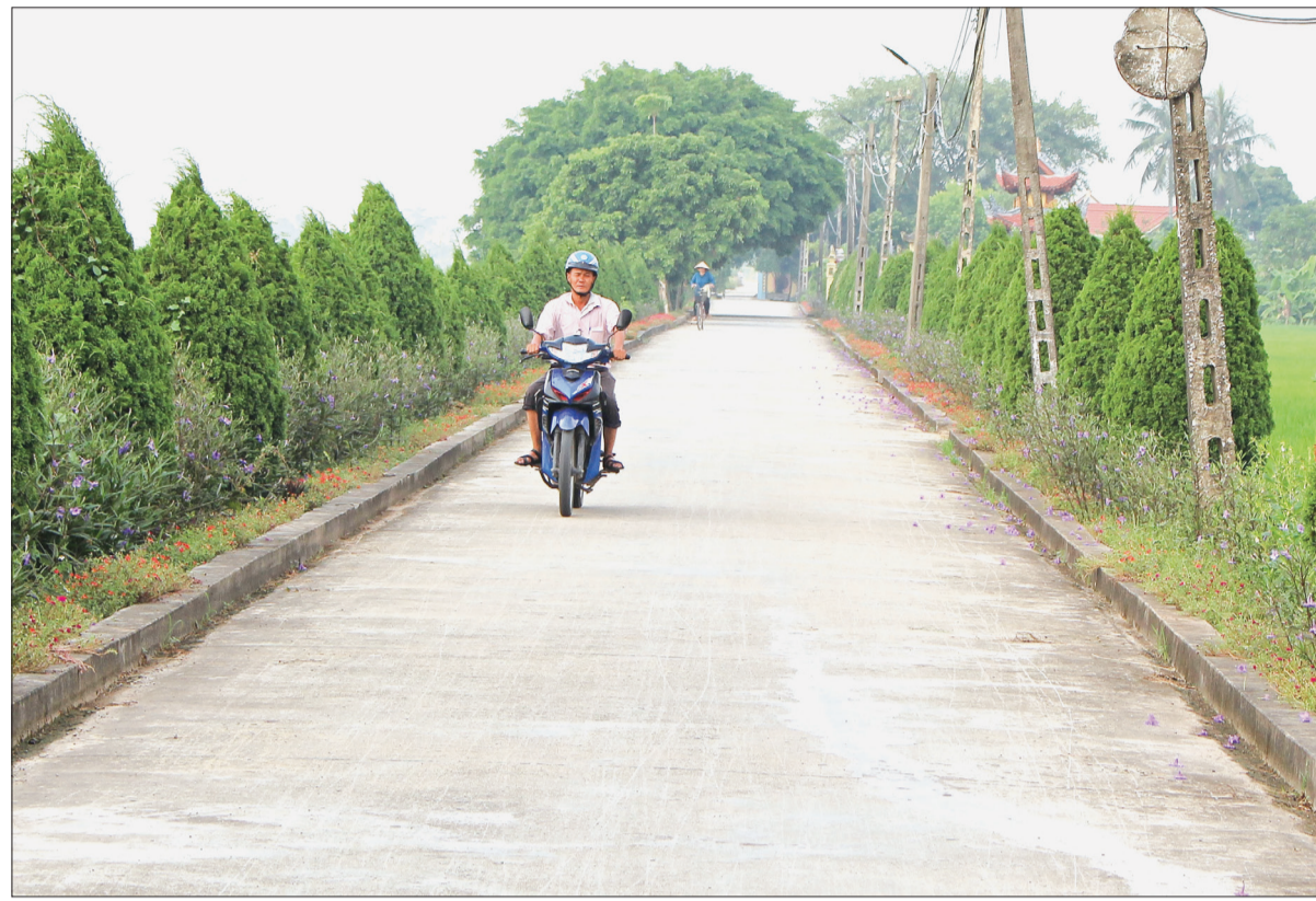
Thu nhập ngày càng được nâng lên giúp người dân xã Thanh Tân (Kiến Xương) có điều kiện tham gia xây dựng cơ sở hạ tầng nông thôn.

Hết tháng 7/2019, toàn tỉnh có 263/263 xã hoàn thành 19/19 tiêu chí nông thôn mới trong đó 245 xã và 1 huyện được công nhận đạt chuẩn, 4 huyện hoàn thành 9/9 tiêu chí cấp huyện. Góp phần vào kết quả đó có vai trò không nhỏ của nguồn vốn tín dụng ngân hàng đã giúp người dân các địa phương có điều kiện phát triển kinh tế, nâng cao thu nhập, cải thiện chất lượng cuộc sống.