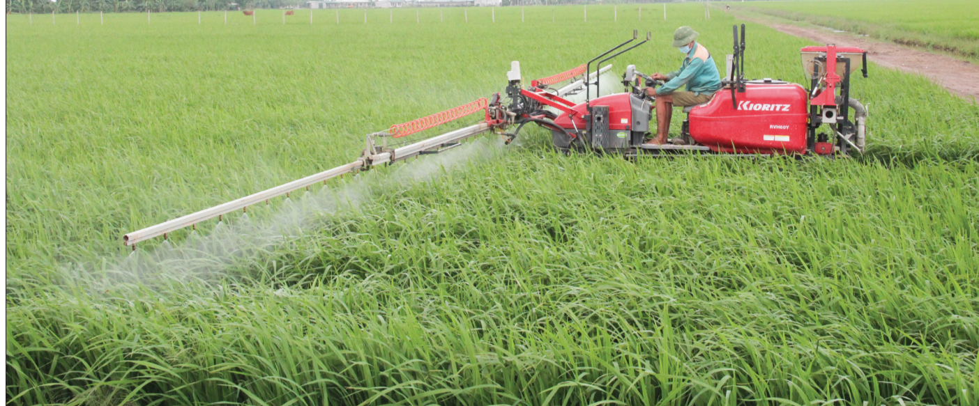
Tích tụ, tập trung ruộng đất tạo thuận lợi ứng dụng cơ giới hóa các khâu sản xuất.