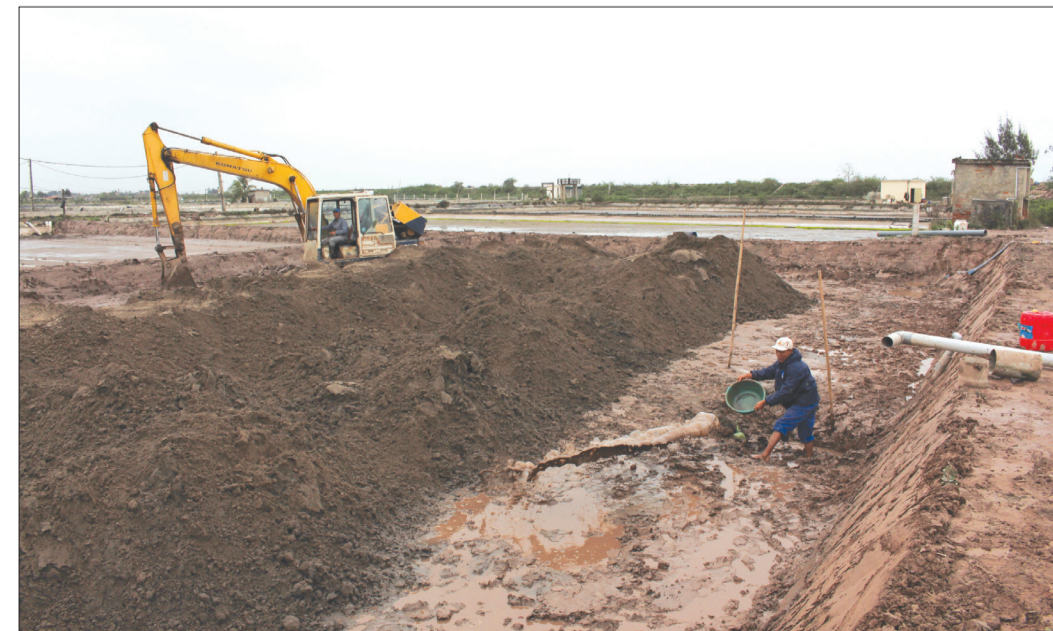
Hộ nuôi trồng thủy sản xã Nam Cường (Tiền Hải) huy động máy móc cải tạo ao đầm.