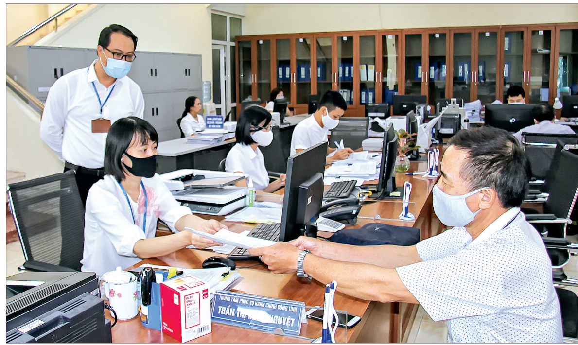
Tiếp nhận và giải quyết thủ tục hành chính tại Trung tâm Phục vụ hành chính công tỉnh.

Với quyết tâm xây dựng nền hành chính dân chủ, minh bạch, hiện đại, hoạt động hiệu lực, hiệu quả, thời gian qua Tỉnh ủy, UBND tỉnh đã quyết liệt trong chỉ đạo triển khai việc giải quyết thủ tục hành chính (TTHC) theo phương án "5 tại chỗ". Qua gần 1 năm thực hiện, với những kết quả đã đạt được có thể khẳng định "5 tại chỗ" chính là đột phá quan trọng trong giải quyết TTHC của tỉnh.