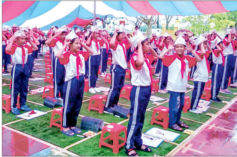
Trường Tiểu học Thụy Ninh (Thái Thụy) tổ chức cho học sinh thi rung chuông vàng.

Đồng chí Đỗ Trường Sơn, Trưởng phòng Giáo dục và Đào tạo huyện chia sẻ: Đến nay, đổi mới giáo dục mầm non đã triển khai học 2 buổi/ngày, tổ chức ăn bán trú tại 100% trường học. 48 xã, thị trấn đã đạt chuẩn phổ cập giáo dục tiểu học, THCS mức độ 3 và đạt mục tiêu phổ cập giáo dục mầm non cho trẻ 5 tuổi. Hàng năm, tỷ lệ học sinh đạt chuẩn kiến thức và kỹ năng 100% trẻ 6 tuổi vào học lớp 1. Đối với bậc tiểu học, thực hiện đổi mới đồng bộ quản lý, giáo viên, học sinh được cấp theo hướng hiện đại, chuẩn kiến thức, kỹ năng và định hướng phát triển năng lực, phẩm chất của học sinh thông qua đổi mới mô hình VNEN, phương pháp "bàn tay nặn bột", dạy mỹ thuật theo phương pháp mới của Đan Mạch. Việc đánh giá học sinh theo Thông tư số 30 của Bộ Giáo dục và Đào tạo được thực hiện nghiêm túc. Đối với bậc THCS, việc đổi mới thể hiện rõ ở nội dung chương trình được thiết kế