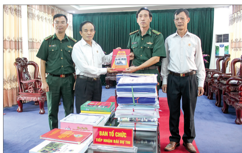
Bộ Chỉ huy Bộ đội Biên phòng tỉnh tiếp nhận bài dự thi cuộc thi tìm hiểu biên giới và Bộ đội Biên phòng.

Gần 50.000 bài dự thi của cán bộ, chiến sĩ, đoàn viên, thanh niên, hội viên, học sinh, sinh viên trong tỉnh tham gia là kết quả ấn tượng của cuộc thi tìm hiểu biên giới và Bộ đội Biên phòng (BĐBP) do Bộ Chỉ huy BĐBP tỉnh và Tỉnh đoàn phối hợp tổ chức.