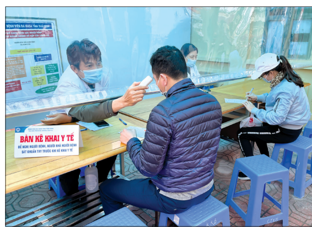
Người dân đến khám chữa bệnh được kiểm tra thân nhiệt tại Bệnh viện Đa khoa tỉnh.