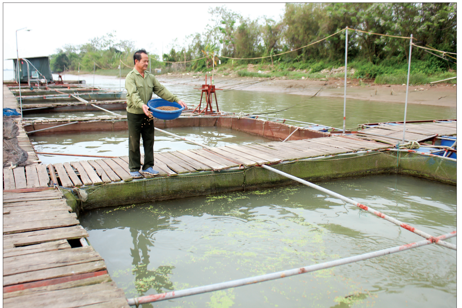
Giá thành hạ, khó tiêu thụ, người nuôi cá phát sinh chi phí thức ăn chăn nuôi mỗi ngày.

Qua năm bắt hoạt động NTTS của người dân trong tỉnh, toàn bộ diện tích nuôi cá nước lợ, nước ngọt đều gặp khó khăn trong việc tiêu thụ, giá thành đồng loạt giảm, trong đó nhiều đối tượng nuôi đặc sản như cá vược, cá song, cá lăng cũng chịu chung tình cảnh “rớt giá” mà vẫn tiêu thụ cầm chừng. Theo đánh giá của Chi cục Thủy sản (Sở Nông nghiệp và Phát triển nông thôn), cùng thời điểm này so với mọi năm đã có 70 - 80% diện tích NTTS nước lợ, nước ngọt được tiêu thụ, tuy nhiên năm nay mới chỉ đạt 30 - 40% diện tích khiến sản lượng cá nuôi tồn nhiều. Với tình hình tiêu thụ như hiện nay, người nuôi cá sẽ bị lỗ vốn bởi tốn thêm nhiều chi phí để nuôi cầm chừng, thiếu vốn xoay vòng đầu tư sản xuất và phải đối mặt với nhiều rủi ro như thiên tai, dịch bệnh.