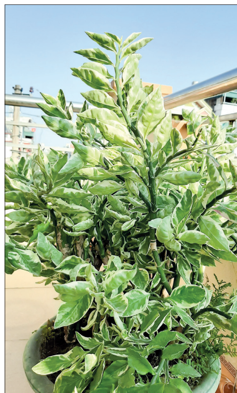
Cây thuốc dấu.

- Dù đánh răng kỹ đến mấy đi nữa thì bàn chải không thể kỹ cạo sạch hết được đồ ăn thức uống bám quanh răng.