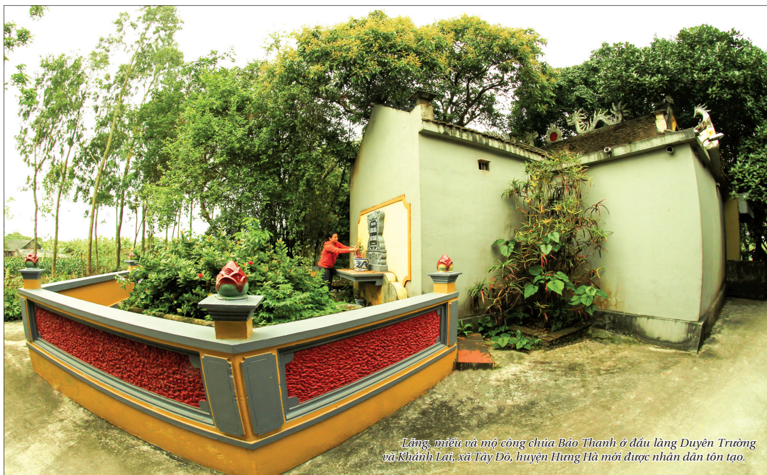
Lăng, miếu và mộ công chúa Bảo Thanh ở đầu làng Duyên Trường và Khánh Lai, xã Tây Đô, huyện Hưng Hà mới được nhân dân tôn tạo.