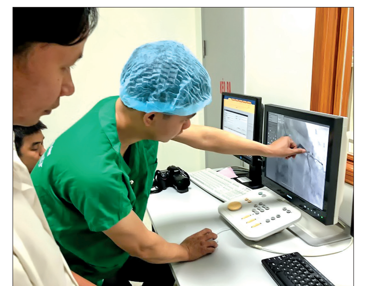
Bác sĩ giải thích cho người nhà tình trạng của bệnh nhân trên màn hình chụp tim mạch.

để tim đập trở lại đồng thời vẫn quyết định chọc mạch theo đường động mạch đùi để xác định vị trí tắc. Kết quả chụp bệnh nhân bị tắc động mạch vành phải, hẹp 70% động mạch chủ, hẹp 50% động mạch liên thất trước, đã được cấp cứu song vẫn đang hôn mê, tim rời rạc, không đo được huyết áp. Bác sĩ giải thích nhanh tình trạng bệnh nhân cho gia đình, nếu quyết định can thiệp tim mạch ngay thì còn cơ hội sống song cũng không loại trừ tình huống xấu là can thiệp không thành công do tình trạng bệnh nhân quá nặng.