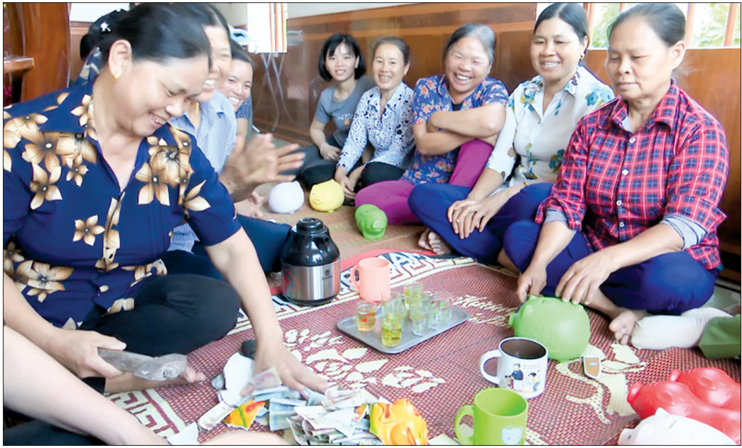
Phụ nữ xã Đông Hoàng (Tiền Hải) mở lễ tiết kiệm.

Bằng những việc làm cụ thể, thiết thực, những năm qua, cán bộ, hội viên, phụ nữ xã Đông Hoàng (Tiền Hải) đã tổ chức được nhiều phong trào học và làm theo gương Bác; có những phong trào đã đi vào nề nếp, tạo sức lan tỏa rộng lớn trong cộng đồng.