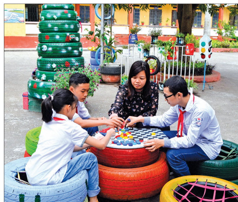
Trường THCS Tiên Phong (thành phố Thái Bình) sử dụng đồ tái chế trang trí không gian trường lớp.