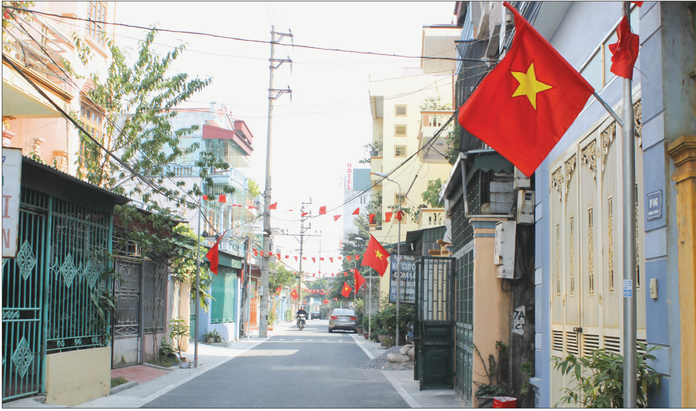
Tổ dân phố Minh Hòa, thị trấn Vũ Thư.

Ngày 13/12/1986, Hội đồng Bộ trưởng ban hành Quyết định số 169/HĐBT về việc thành lập thị trấn Vũ Thư. Ngày 27/3/1987, Huyện ủy, HĐND, UBND huyện Vũ Thư tổ chức công bố Quyết định của Hội đồng Bộ trưởng, đánh dấu mốc thị trấn Vũ Thư chính thức ra đời. Từ những chòm xóm, khu dân cư nhỏ lẻ và nghèo nàn, trải qua 35 năm phát triển, thị trấn Vũ Thư ngày nay mang diện mạo đô thị phát triển hiện đại, xứng đáng là trung tâm chính trị, kinh tế, văn hóa của huyện Vũ Thư.