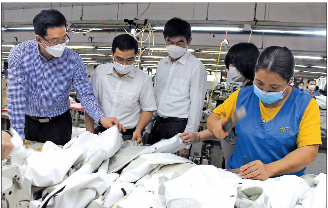
Các đồng chí lãnh đạo Đảng ủy, UBND thị trấn Vũ Thư nắm bắt tình hình sản xuất, động viên các doanh nghiệp tại địa bàn.

Khai thác tối đa địa thế khu vực trung tâm huyện, thuận lợi giao thông, giao thương, những năm qua, thị trấn Vũ Thư đẩy mạnh thu hút đầu tư, quan tâm phát triển các ngành nghề CN-TTCN và TMDV. Giá trị sản xuất CN-TTCN và TMDV chiếm 99% cơ cấu kinh tế (năm 2021) là con số ấn tượng, minh chứng cho bước đột phá mạnh mẽ của thị trấn Vũ Thư trong chuyển dịch cơ cấu kinh tế theo hướng tích cực, tạo việc làm, nâng