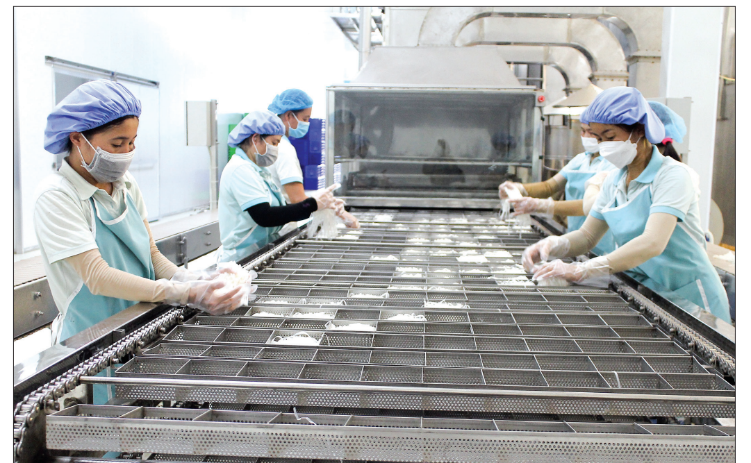
Công ty TNHH Liên Hạnh, cụm công nghiệp thị trấn Vũ Thư đầu tư dây chuyền công nghệ hiện đại để sản xuất bún, bánh phở theo hướng chế biến sâu, nâng cao giá trị sản phẩm.