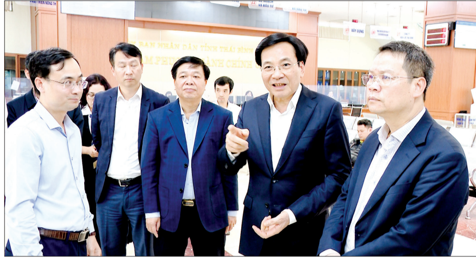
Đồng chí Trần Văn Sơn, Ủy viên Ban Chấp hành Trung ương Đảng, Bộ trưởng, Chủ nhiệm Văn phòng Chính phủ cùng đoàn công tác thành viên Chính phủ và các đồng chí lãnh đạo tỉnh kiểm tra hoạt động của Trung tâm Phục vụ hành chính công tỉnh.