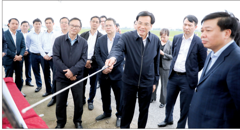
Đồng chí Trần Văn Sơn, Ủy viên Ban Chấp hành Trung ương Đảng, Bộ trưởng, Chủ nhiệm Văn phòng Chính phủ lưu ý tình Thái Bình cần có phương án chủ động giải phóng mặt bằng các diện tích còn lại.