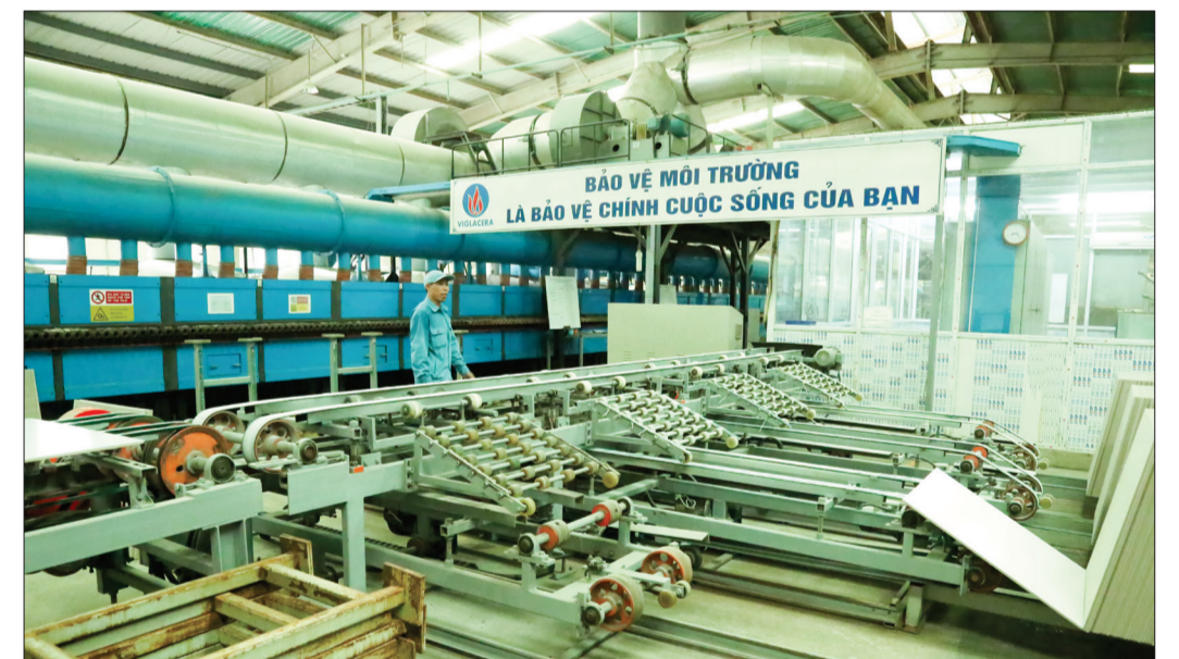
Nhà máy gạch Viglacera Thái Bình (khu công nghiệp Tiên Hải) thực hiện tốt nghĩa vụ về thuế năm 2019.