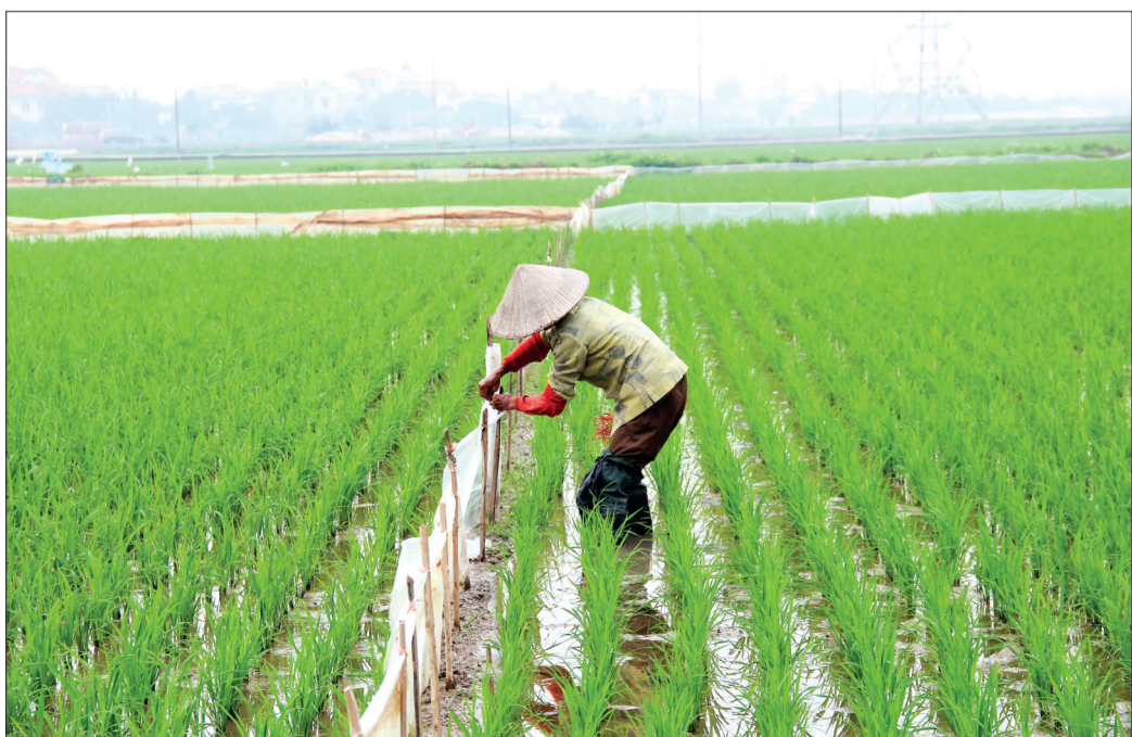
Nông dân huyện Hưng Hà cấy nilon bảo vệ lúa xuân.

Theo tổng hợp của Chi cục Trồng trọt và Bảo vệ thực vật, đến ngày 27/2, các địa phương trong tỉnh hoàn thành gieo cấy lúa xuân, chuyển trọng tâm sang chăm sóc. Nhìn chung, vụ xuân năm nay thời tiết ấm, thuận lợi cho cây lúa bén rễ phát triển.