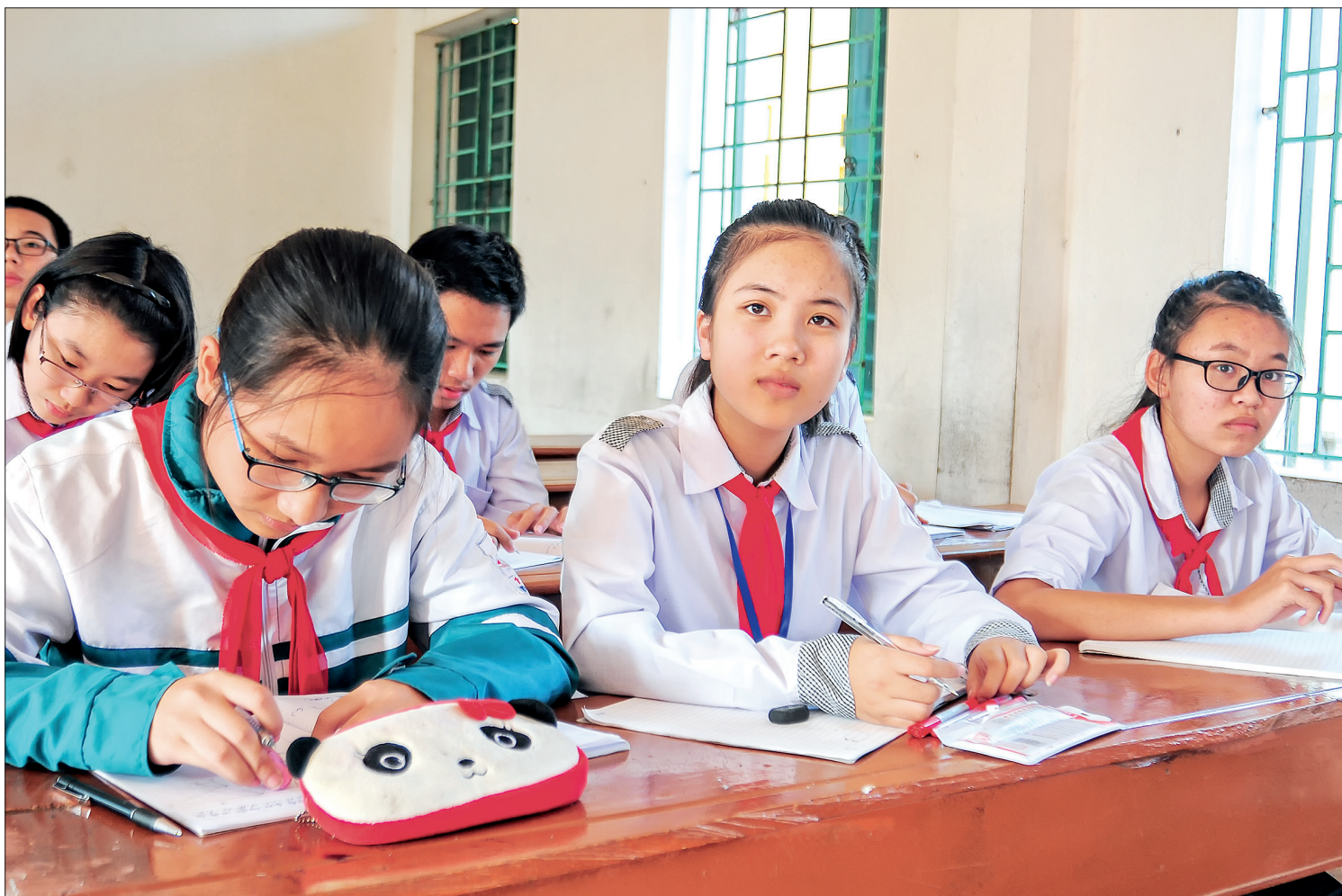
Học sinh Trường THCS 14/10 (Tiền Hải).