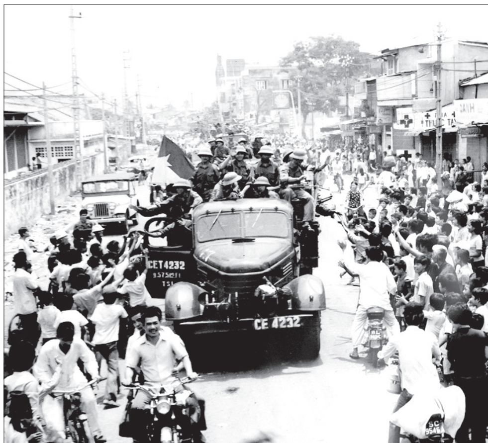
Nhân dân chào đón quân giải phóng tiến vào Sài Gòn.

cảnh và các trọng điểm quân sự khác. Đúng như phương án chiến đấu, cả chi khu quân sự Gò Bồi nằm trong biển lửa. Hàng trăm lính Mỹ, lính ngụy chết và bị thương trên đường rút chạy. Bà con xã Phước Thắng, huyện Tuy Phước cùng với bộ đội hân hoan chào đón quê hương được giải phóng, nhanh chóng xây dựng các lực lượng, chuẩn bị cờ hoa để tiến về thành phố Quy Nhơn.