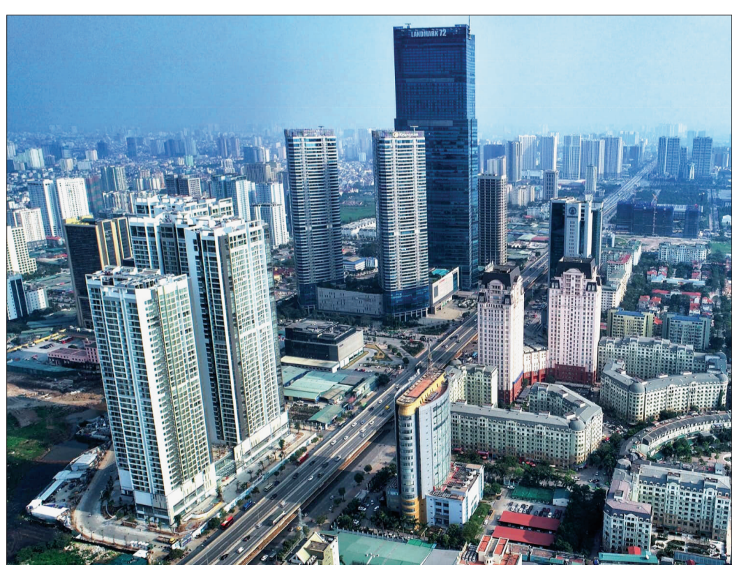
Thủ đô Hà Nội hội nhập, phát triển.