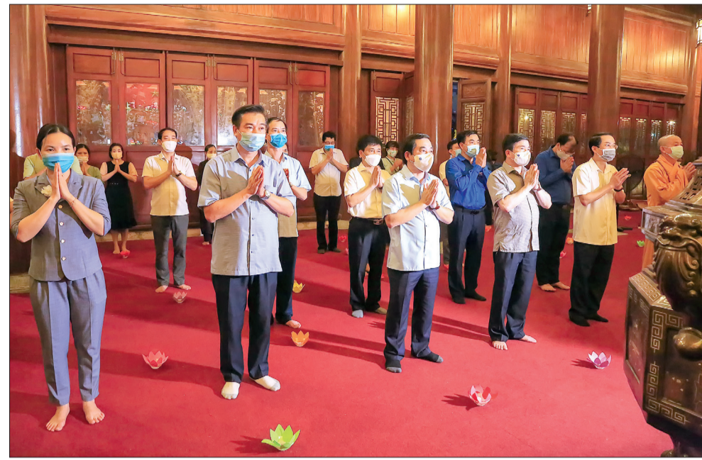
Các đồng chí lãnh đạo tỉnh và đại biểu tưởng niệm các anh hùng liệt sĩ.