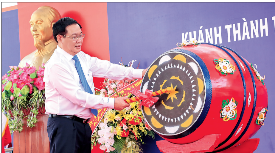
Đồng chí Vương Đình Huệ, Ủy viên Bộ Chính trị, Phó Thủ tướng Chính phủ đánh trống khai giảng năm học mới tại Trường Tiểu học Lý Nam Đế (xã Hồng Minh, huyện Hưng Hà).