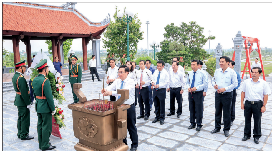
Đồng chí Vương Đình Huệ, Ủy viên Bộ Chính trị, Phó Thủ tướng Chính phủ cùng các đồng chí lãnh đạo tỉnh dâng hương tưởng niệm Chủ tịch Hồ Chí Minh tại Đền thờ Bác Hồ (phường Hoàng Diệu, thành phố Thái Bình).