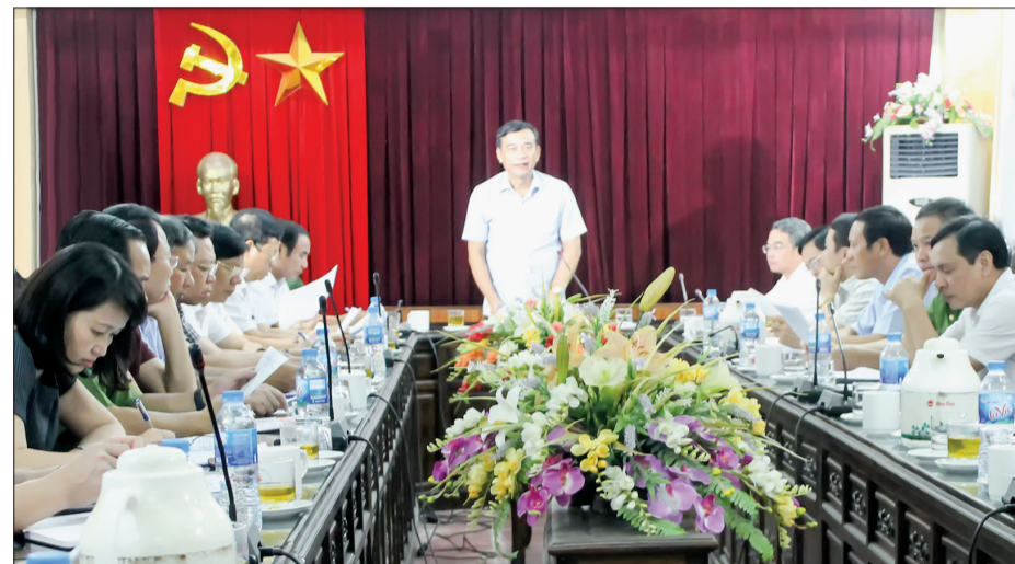
Đồng chí Đặng Trọng Thăng, Phó Bí thư Tỉnh ủy, Chủ tịch UBND tỉnh phát biểu tại buổi làm việc.

Chiều ngày 5/9, đoàn công tác của UBND tỉnh do đồng chí Đặng Trọng Thăng, Phó Bí thư Tỉnh ủy, Chủ tịch UBND tỉnh làm trưởng đoàn có buổi làm việc với huyện Vũ Thư về xây dựng nông thôn mới (NTM). Dự buổi làm việc có các đồng chí Ủy viên Ban Thường vụ Tỉnh ủy, Phó Chủ tịch HĐND tỉnh.