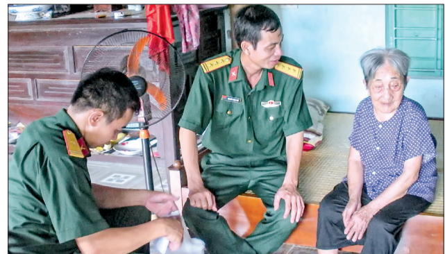
Đại diện Bộ Chỉ huy Quân sự tỉnh, Ban Chỉ huy Quân sự huyện Vũ Thư thăm hỏi đối tượng chính sách trên địa bàn.

Hưởng tới kỷ niệm 70 năm ngày Thương binh, Liệt sĩ (27/7/1947 - 27/7/2017), Ban CHQS huyện Vũ Thư vừa tổ chức phát động đợt thi đua cao điểm "Uống nước nhớ nguồn, đền ơn đáp nghĩa" trong cán bộ, chiến sĩ lực lượng vũ trang huyện. Ban CHQS huyện đẩy mạnh thi đua sẵn sàng chiến đấu cao, huấn luyện giỏi, xây dựng chính quy, chấp hành nghiêm kỷ luật; tập trung hoàn thành xuất sắc nhiệm vụ chính trị được giao; thi đua làm tốt công tác chính sách đối với thương binh, bệnh binh, gia đình chính sách và chính sách hậu phương quân đội; đẩy mạnh tuyên truyền, vận động nhân dân thực hiện tốt chủ trương, đường lối của Đảng, chính sách, pháp luật của Nhà nước, quán triệt, địa phương; tiếp tục hiện hiệu quả phong trào thi đua "Quân đội chung sức xây dựng nông thôn mới"; đồng thời, đẩy mạnh hoạt động giao lưu, kết nghĩa, nhận phụ dưỡng Mẹ Việt Nam anh hùng, thấp nền tri ân các anh hùng liệt sĩ... Đợt thi đua diễn ra từ ngày 18/5/2017 đến ngày 27/7/2017.