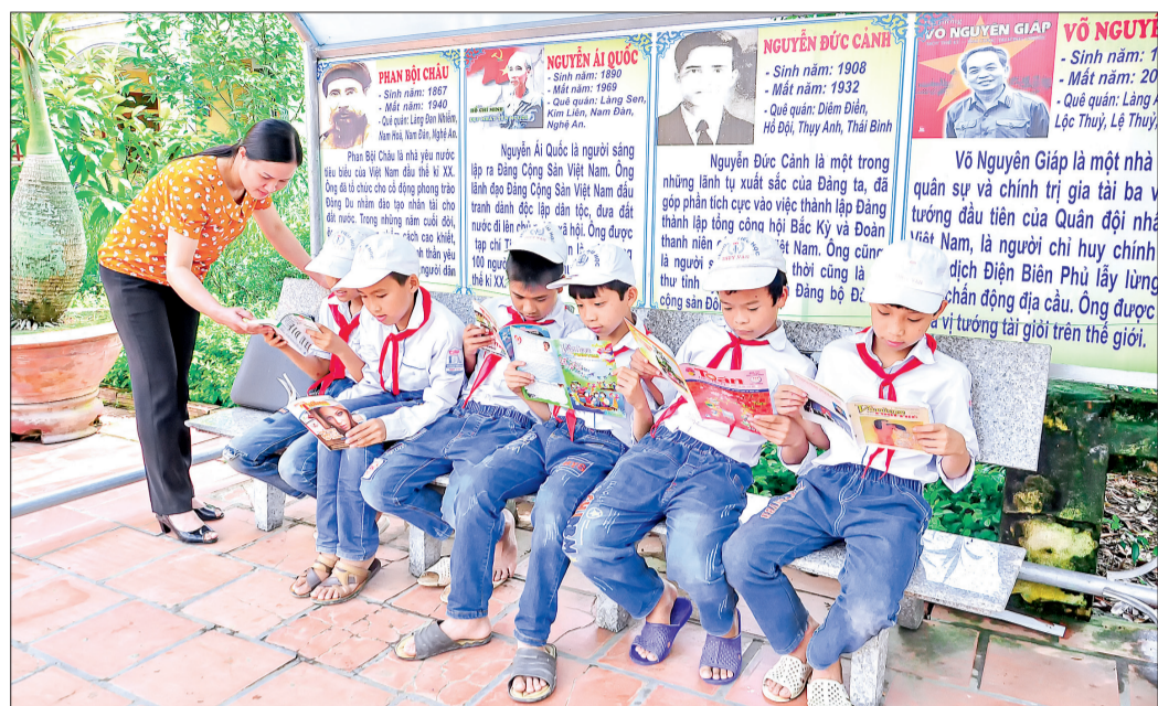
Cô trò Trường Tiểu học Thụy Vân (Thái Thụy) học tập và làm theo tư tưởng, đạo đức, phong cách Hồ Chí Minh bằng nhiều hoạt động thiết thực.

Các cấp ủy đảng, chính quyền, các ban, ngành, đoàn thể, địa phương, đơn vị đã nghiêm túc triển khai, quán triệt, tuyên truyền việc học tập và làm theo tư tưởng, đạo đức, phong cách Hồ Chí Minh gắn với thực hiện Nghị quyết Trung ương 4 (khóa XII) về tăng cường xây dựng, chỉnh đốn Đảng; ngăn chặn, đẩy lùi sự suy thoái về tư tưởng chính trị, đạo đức, lối sống, những biểu hiện "tự diễn biến", "tự chuyển hóa" trong nội bộ. Trong đó, tập trung quán triệt các điểm mới so với Chỉ thị số 03 của Bộ Chính trị (khóa XI) về tiếp tục đẩy mạnh học tập và làm theo tư tưởng, đạo đức, phong cách Hồ Chí Minh, giúp cán bộ, đảng viên nhận thức đúng, đủ mục đích, yêu cầu, nội dung cơ bản, ý nghĩa, sự cần thiết của việc học tập và làm theo tư tưởng, đạo đức, phong cách Hồ Chí Minh trong tình hình mới; xác định đây là nội dung trọng yếu, thường xuyên của công tác xây dựng, chỉnh đốn Đảng, góp phần làm cho tư tưởng, đạo đức, phong cách Hồ Chí Minh thật sự trở thành nền tảng tinh thần vững chắc của đời sống xã hội.