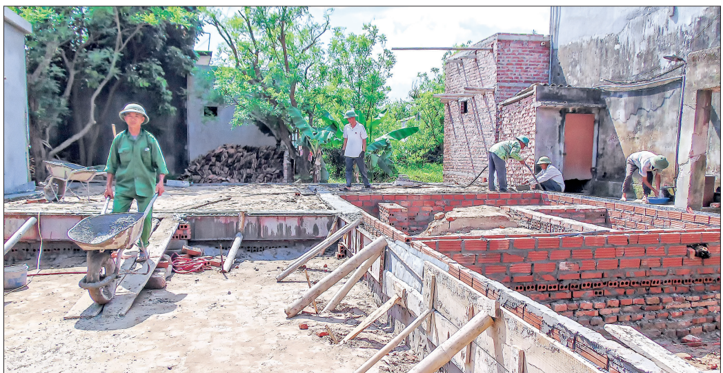
Ngôi nhà tình nghĩa cho thương binh nặng Đồng Văn Dụng (thôn Ô Mẽ 4, xã Tân Phong) đang được xây dựng.