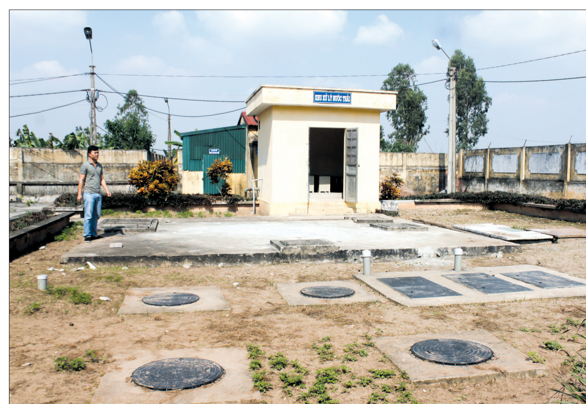
Hệ thống xử lý nước thải của Bệnh viện Đa khoa Thái Thụy được vận hành hàng ngày.

Thời gian qua, Phòng Y tế huyện Thái Thụy thường xuyên chỉ đạo các cơ sở y tế trên địa bàn thực hiện nghiêm các quy định về thu gom, xử lý rác thải tại các cơ sở y tế. Từ năm 2012 đến năm 2014, Phòng Y tế huyện đã phối hợp với Phòng Tài nguyên và Môi trường tham mưu UBND huyện thực hiện xây dựng lò đốt rác thải y tế cho 39 trạm y tế xã, thị trấn. Bước đầu đã giải quyết cơ bản rác thải y tế và rác thải sinh hoạt do các cơ sở khám chữa bệnh phát sinh trong quá trình hoạt động. Ngoài ra, hàng năm, phối hợp với các phòng chuyên môn của các sở, ngành, UBND huyện kiểm tra rác thải đối với một số cơ sở y tế; tham mưu đưa việc xử lý chất thải y tế vào kế hoạch công tác của một số ngành, cấp ủy đảng, chính quyền để các cơ sở hành nghề y tế nhân được Sở Y tế thẩm định, cấp phép hoạt động.