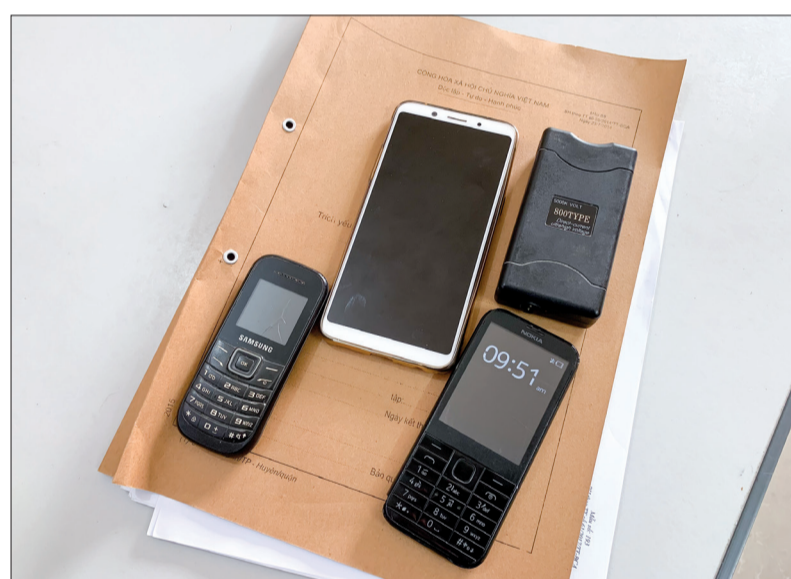
Tang vật vụ án.

Để đấu tranh hiệu quả với tội phạm cướp tài sản, thời gian qua, Công an tỉnh đã triển khai đồng bộ các biện pháp phòng ngừa, nâng cao chất lượng công tác nghiệp vụ cơ bản, tập trung rà soát, dụng các ổ nhóm tội phạm cướp, cướp giật, trộm cắp tài sản để xây dựng kế hoạch triệt phá. Tổ chức truy bắt số đối tượng truy nã tội danh cướp, cướp giật. Đối với các ổ nhóm, đối tượng đang hoạt động, các đơn vị tập trung xử lý triệt để với các hành vi phạm, áp dụng đồng bộ các biện pháp xử lý hình sự, xử lý hành chính. Thành lập các tổ tuần tra, kiểm soát vào các khung giờ cao điểm, trên các tuyến, địa bàn trọng điểm. Với việc triển khai đồng bộ các biện pháp nghiệp vụ, lực lượng công an đã đấu tranh triệt xóa nhiều ổ nhóm cướp tài sản phức tạp.