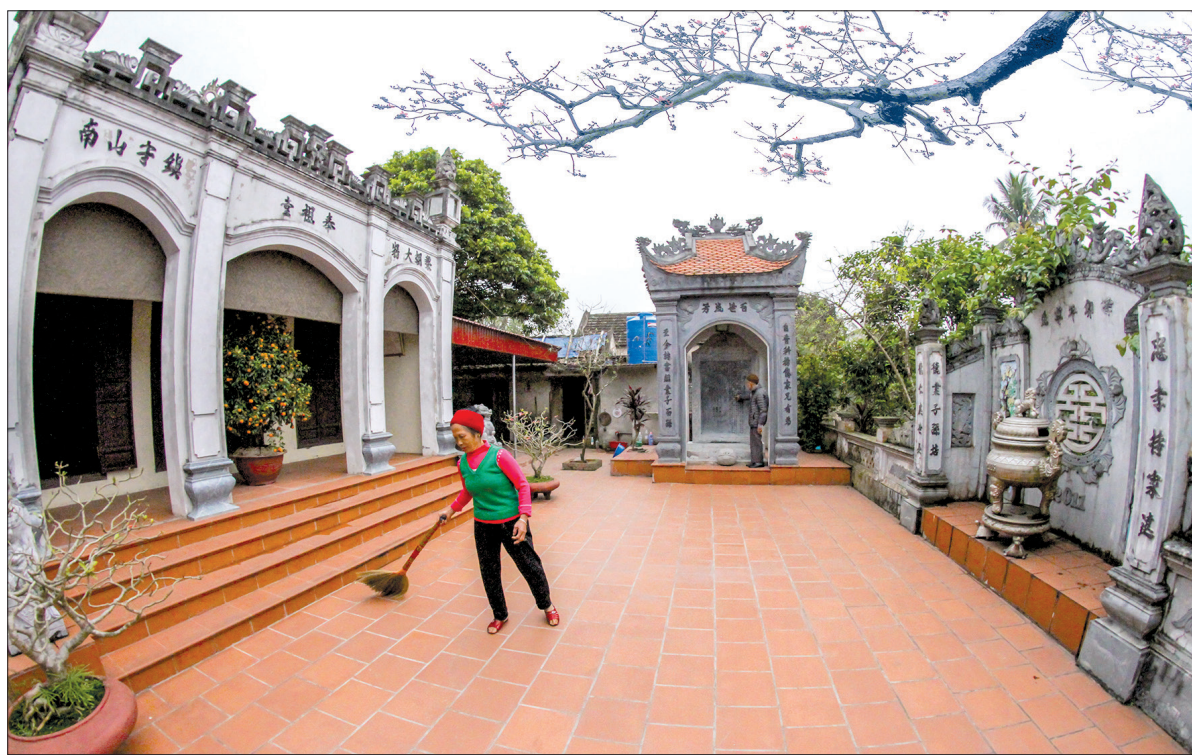
Từ đường Nguyễn Duy Hòa, làng Đông Địa Linh, phủ Tân An, huyện Đa Dục (nay là tổ 3, thị trấn An Bài, huyện Quỳnh Phụ) chưa được xếp hạng di tích.