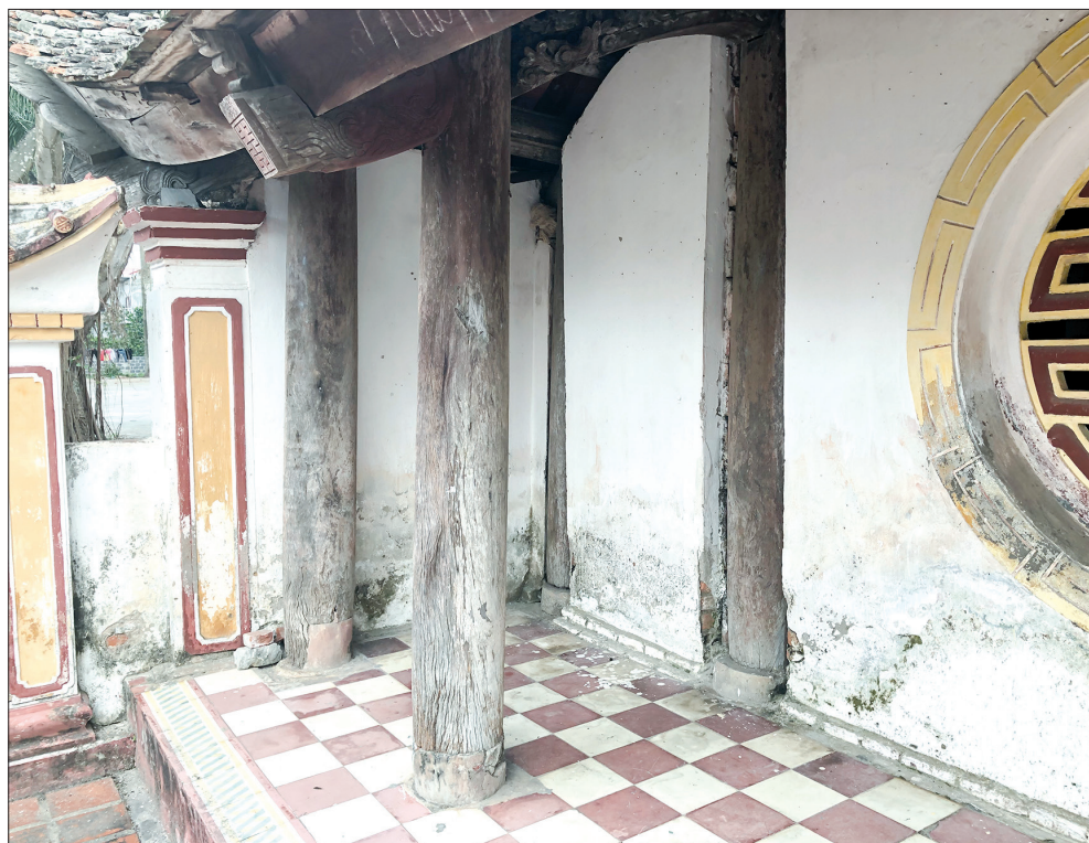
Kèo cột bị mối mọt, xuống cấp nghiêm trọng.

Đã có những câu chuyện đau lòng xảy ra với những ngôi đình có niên đại hàng trăm năm tuổi ở một số địa phương trong nước. Điển hình như việc phá dỡ và buộc phải di dời ngôi đình cổ Ngu Nhuế có niên đại hơn 300 năm tại tỉnh Hưng Yên do không có giải pháp trùng tu, tôn tạo kịp thời. Liệu tình trạng tương tự có xảy ra với đình Phương Cáp?