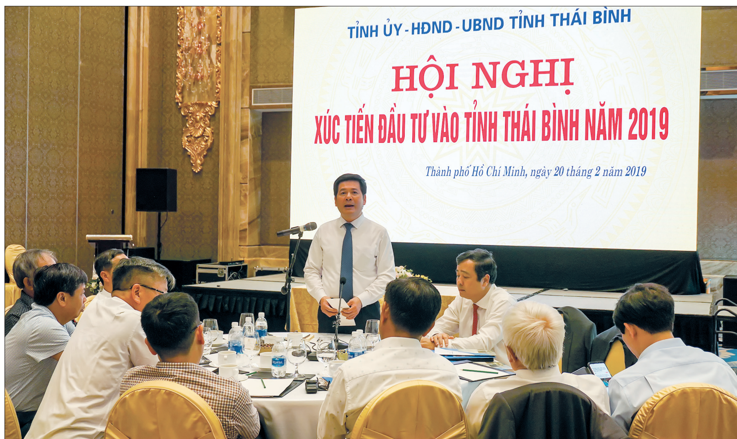
Đồng chí Nguyễn Hồng Diên, Ủy viên Trung ương Đảng, Bí thư Tỉnh ủy, Chủ tịch HĐND tỉnh, Trưởng đoàn đại biểu Quốc hội tỉnh phát biểu tại hội nghị xúc tiến đầu tư vào tỉnh Thái Bình (Thành phố Hồ Chí Minh, tháng 2 năm 2019).

Hội trường khách sạn The Reverie Saigon một ngày cuối tháng 2/2019, không khí gần gũi, ấm áp lan tỏa giữa các đại biểu dự hội nghị xúc tiến đầu tư vào tỉnh Thái Bình tại Thành phố Hồ Chí Minh do Tỉnh ủy, HĐND, UBND tỉnh tổ chức.