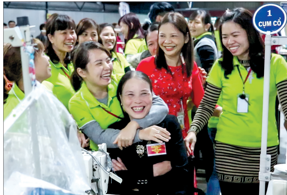
Công nhân Công ty Cổ phần Sản xuất hàng thể thao MXP phấn khởi khi được gặp thân nhân tại nơi làm việc.

Uy tín, thương hiệu và lợi nhuận luôn bắt nguồn từ những việc nhỏ nhất, với chưa đầy 10 năm có mặt trên địa bàn Thái Bình, Công ty Cổ phần Sản xuất hàng thể thao MXP đã phát triển mạnh mẽ, từ 1 nhà máy ban đầu đến nay đã có 8 nhà máy với 15.000 công nhân đang làm việc ở thành phố và các huyện Vũ Thư, Kiến Xương, Đông Hưng. Hiện nay, Công ty đang khẩn trương đầu tư xây dựng nhà máy thứ 9 tại huyện Quỳnh Phụ. Nữ tướng chân dài lại bận rộn hơn khi có thêm nhà máy mới nhưng niềm vui sẽ tiếp tục đến với chị và Công ty Cổ phần Sản xuất hàng thể thao MXP. Khi tiếp tục có thêm hàng nghìn nông dân có cơ hội trở thành công nhân mà chủ yếu là chị em phụ nữ có việc làm "Ly nông nhưng không ly hương".