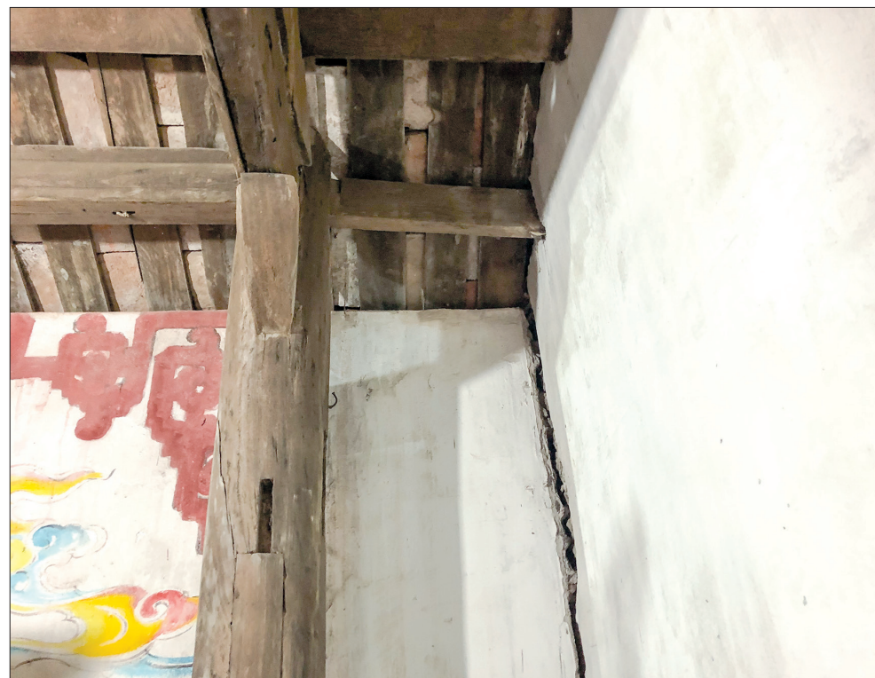
Tường của đình đã nứt toác.