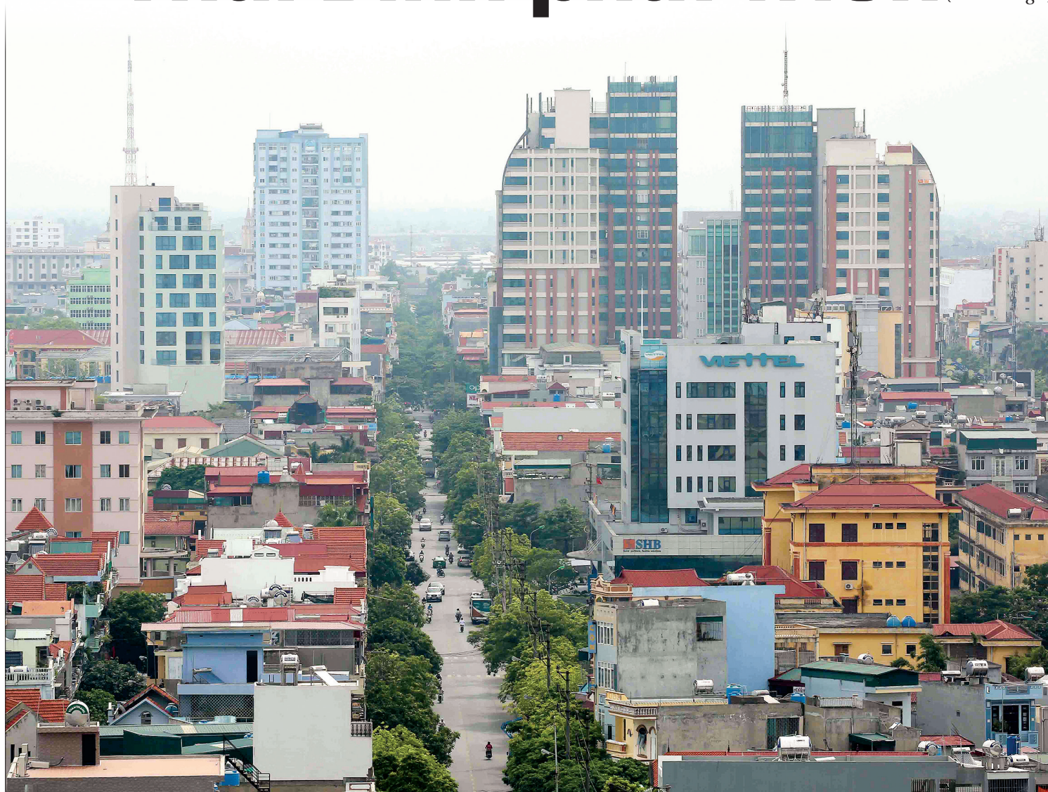
Thành phố Thái Bình.