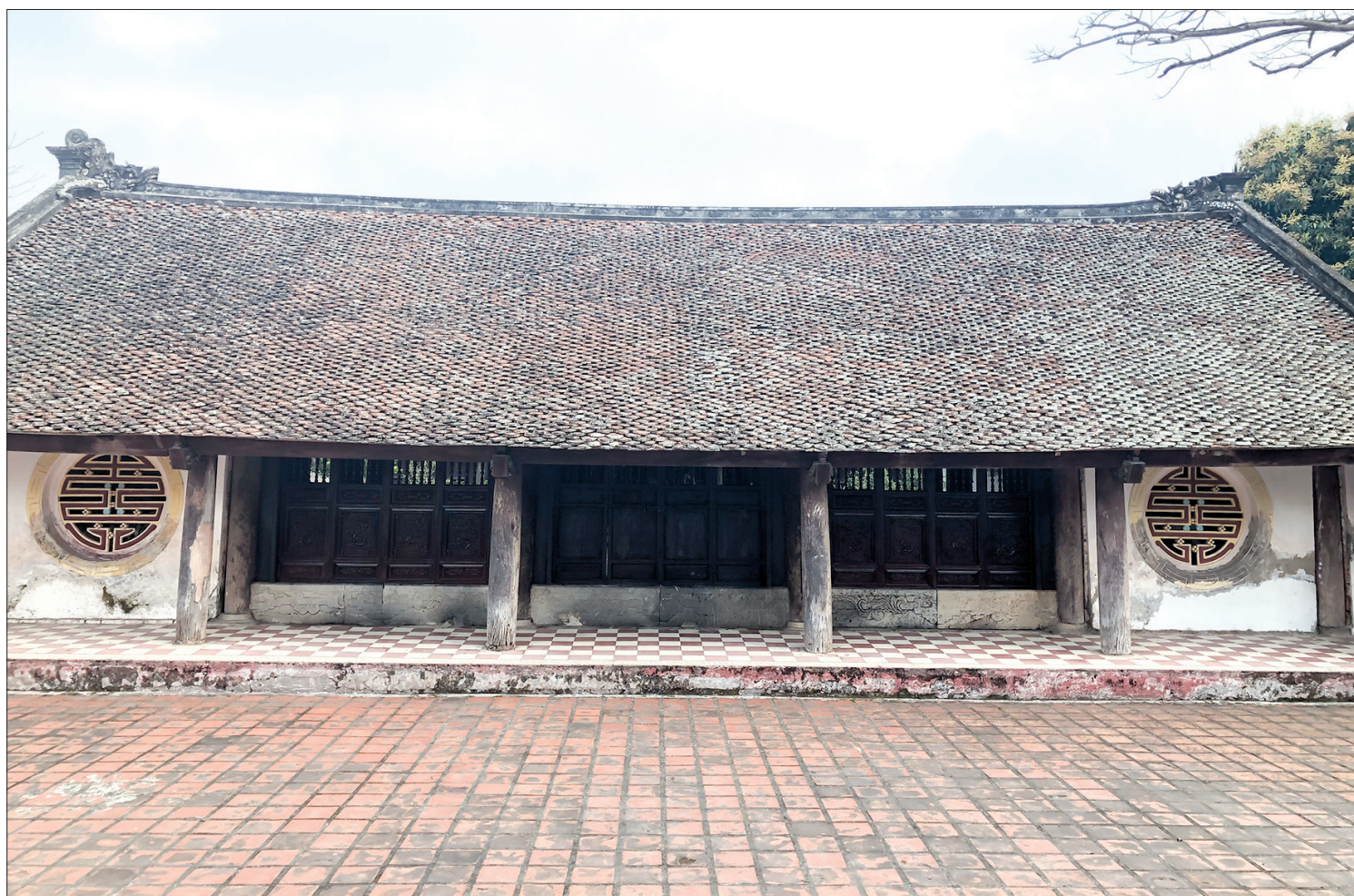
Mặc dù huyện Vũ Thư mới đầu tư nâng cấp hai bộ cánh cửa vào tháng 12/2018 nhưng vẫn chỉ như “đèn soi ngọn cỏ”.

Xưa nay, những ngôi đình cổ đều mang lại giá trị tâm linh cao quý. Đình Phương Cáp, xã Hiệp Hòa (Vũ Thư) là một trong những ngôi đình như thế. Tuy nhiên, trải qua thăng trầm của lịch sử, qua nhiều lần tôn sửa, tu tạo, giờ đây ngôi đình đang xuống cấp rất nghiêm trọng.