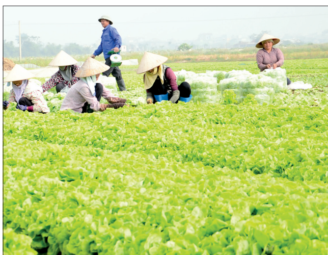
Vùng chuyên canh rau.