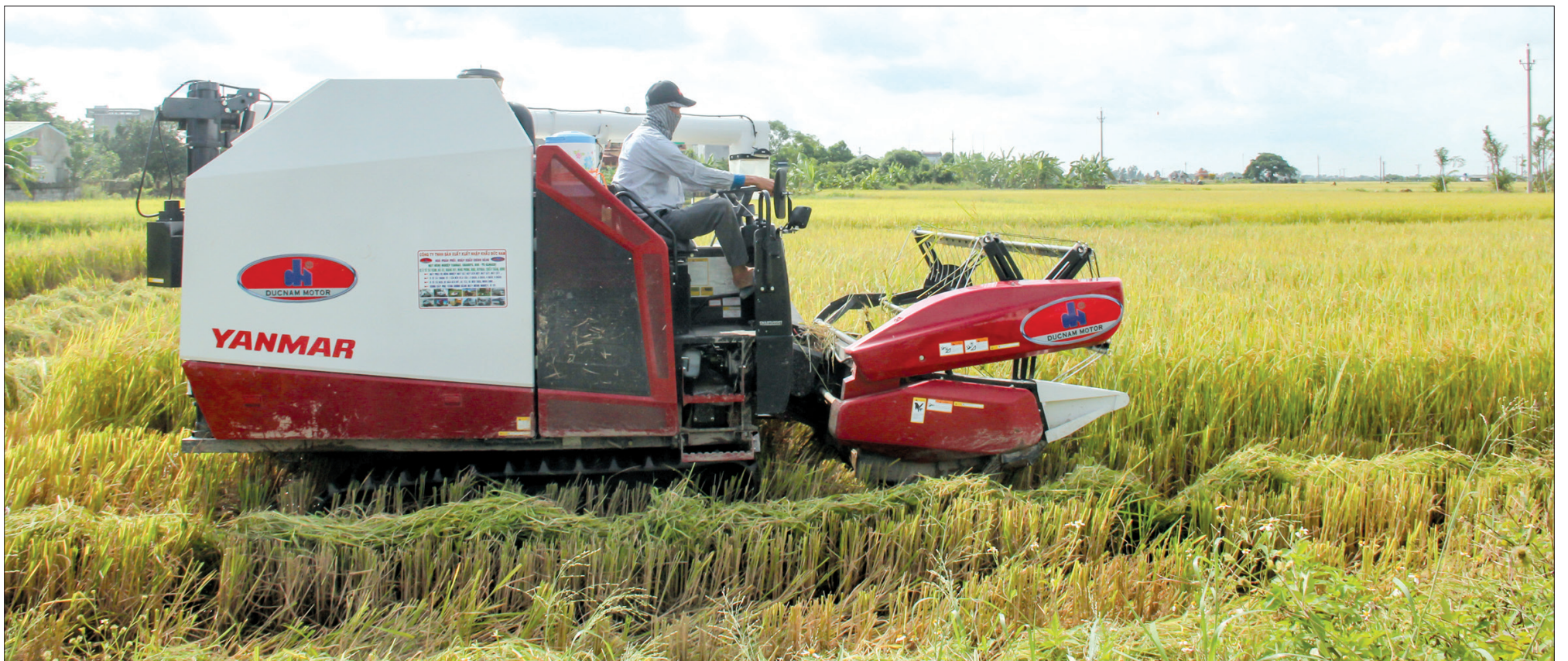
Nông dân huyện Hưng Hà sử dụng máy gặt đập liên hợp Yanmar do Công ty TNHH Sản xuất xuất nhập khẩu Đức Nam cung cấp.

Đồng hành cùng sự phát triển của nông nghiệp, nông dân, để cơ giới hóa đồng bộ ở các khâu trong quá trình sản xuất, thời gian tới, Công ty Đức Nam tiếp tục phối hợp với các địa phương, đơn vị tăng cường tuyên truyền, hướng dẫn nông dân chủ động đưa máy móc vào đồng ruộng; xây dựng các chính sách hỗ trợ; cung cấp các sản phẩm máy nông nghiệp chất lượng, phù hợp với điều kiện canh tác của người dân, qua đó từng bước hình thành các vùng chuyên canh theo hướng hàng hóa cho hiệu quả kinh tế cao, góp phần vào mục tiêu phát triển nền nông nghiệp chất lượng, hiệu quả và bền vững của tỉnh.