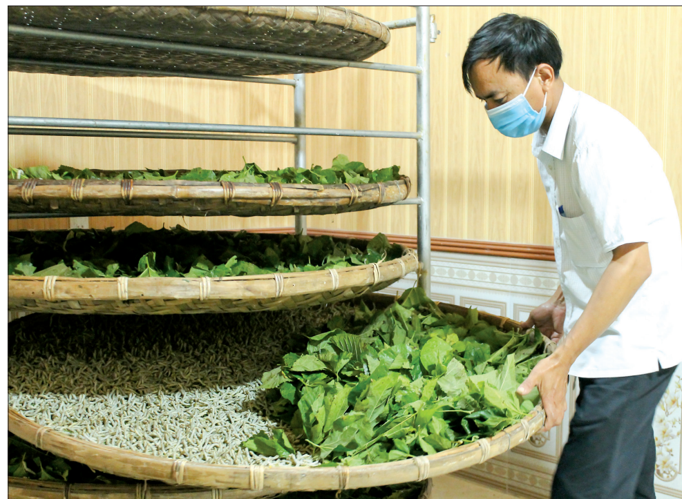
Nghề "ăn cơm đứng" giúp nhiều gia đình vươn lên làm giàu.

Mỗi năm, xã Hồng Phong cung cấp ra thị trường 400 tấn kén tằm, mang về nguồn thu gần 40 tỷ đồng/năm, góp phần nâng cao thu nhập, cải thiện đời sống cho người dân. Đặc biệt, không ít hộ đã vươn lên làm giàu, trở thành triệu phú từ chính nghề "ăn cơm đứng" mà cha ông truyền lại.