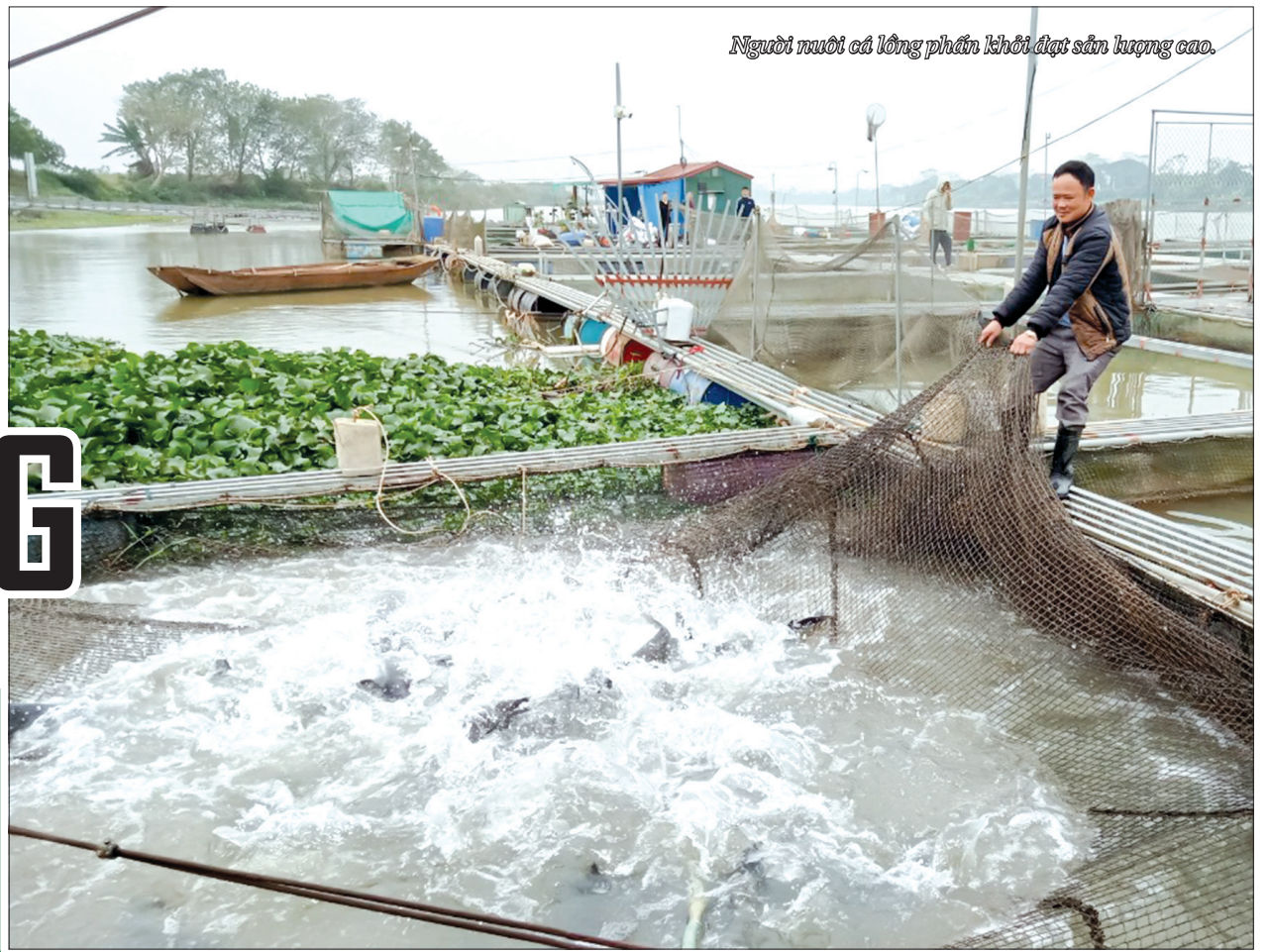
Người nuôi cá lồng phấn khởi đạt sản lượng cao.

Những ngày này, các hộ nuôi cá lồng ở huyện Hưng Hà đang bắt đầu thu hoạch cá để xuất bán phục vụ thị trường tết Nguyên đán Nhâm Dần 2022. Hàng trăm lồng cá chép giòn, cá lăng, cá diêu hồng... san sát với những chú cá to, tròn hứa hẹn một vụ cá bội thu.