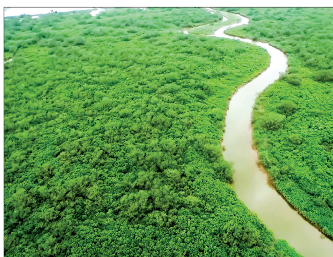
Diện tích rừng ngập mặn đạt trên 4.300ha.