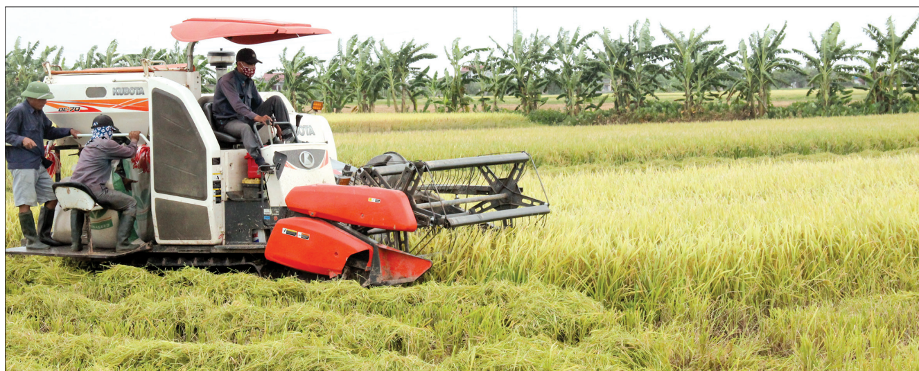
Vùng sản xuất lúa giống BC15.

Từ năm 2010 đến nay, sản xuất nông nghiệp của tỉnh Thái Bình đã chuyển sang sản xuất hàng hóa có chất lượng và giá trị kinh tế cao nhờ ứng dụng các tiến bộ khoa học công nghệ, chuyển đổi cơ cấu cây trồng, vật nuôi, quy hoạch vùng sản xuất, dồn điền đổi thửa và tích tụ ruộng đất, qua đó nâng cao giá trị sản xuất trên một đơn vị canh tác. Tốc độ tăng trưởng bình quân khu vực nông, lâm nghiệp, thủy sản giai đoạn 2010 - 2020 đạt 3,0%/năm, góp phần bảo đảm an ninh lương thực quốc gia, đồng thời có sản phẩm xuất khẩu sang một số nước. Giá trị sản xuất trồng trọt tăng dần, năm 2010 đạt 103,74 triệu đồng/ha, năm 2020 đạt 161,5 triệu đồng/ha.