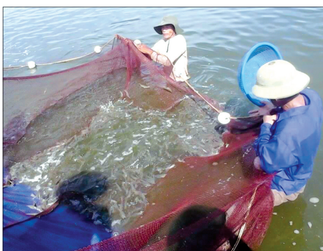
Ngày càng nhiều hộ dân, doanh nghiệp đầu tư nuôi tôm công nghệ cao.