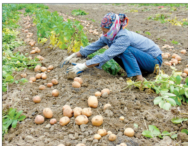
Khoai tây là cây trồng chủ lực trong sản xuất vụ đông.