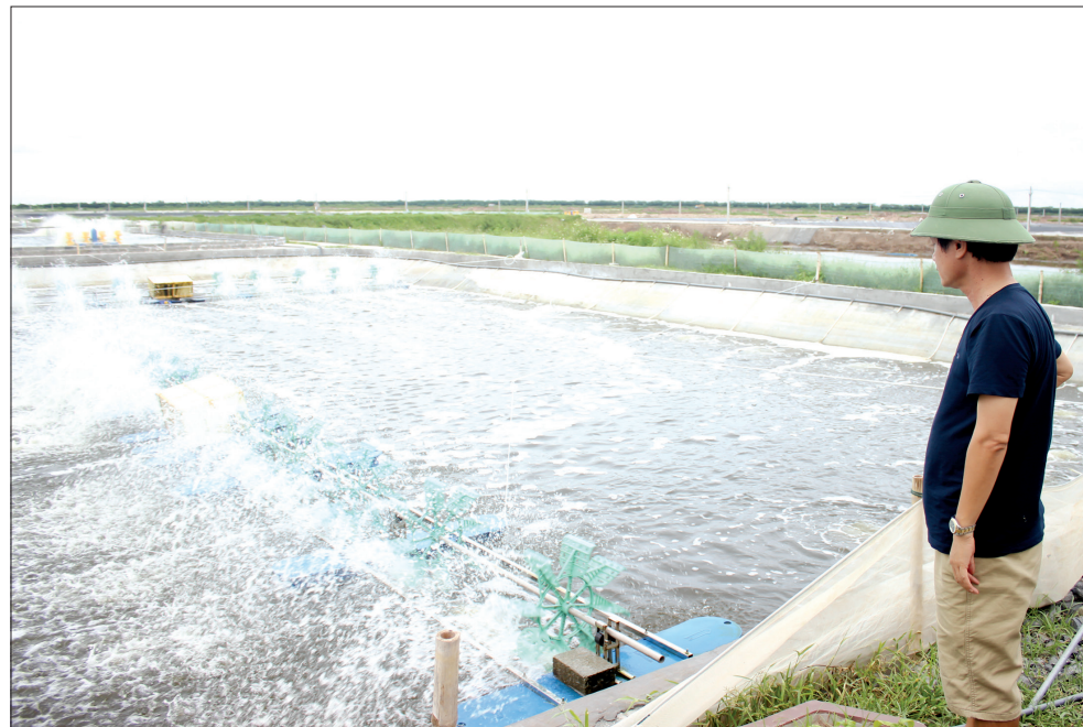
Nuôi tôm tại xã Nam Thịnh (Tiền Hải).

Lúa là cây trồng chủ lực với diện tích gieo cấy đạt trên 150.000ha/năm. Cùng với duy trì năng suất lúa đạt 132 tạ/ha/năm, ngành nông nghiệp và các địa phương đã quy vùng, tổ chức sản xuất lúa giống, lúa chất lượng cao, lúa đặc sản và xây dựng được nhãn hiệu lúa gạo theo hướng phục vụ thị trường trong nước và xuất khẩu; tạo được các mô hình canh tác theo hướng thuận thiên. Sản xuất rau màu từng bước chuyển sang chuyên canh và có lựa chọn cây trồng ưu thế: rau ăn lá tại xã Trung An (Vũ Thư); rau gia vị tại xã Quỳnh Hải, ớt tại xã An Ấp (Quỳnh Phụ); khoai tây tại xã