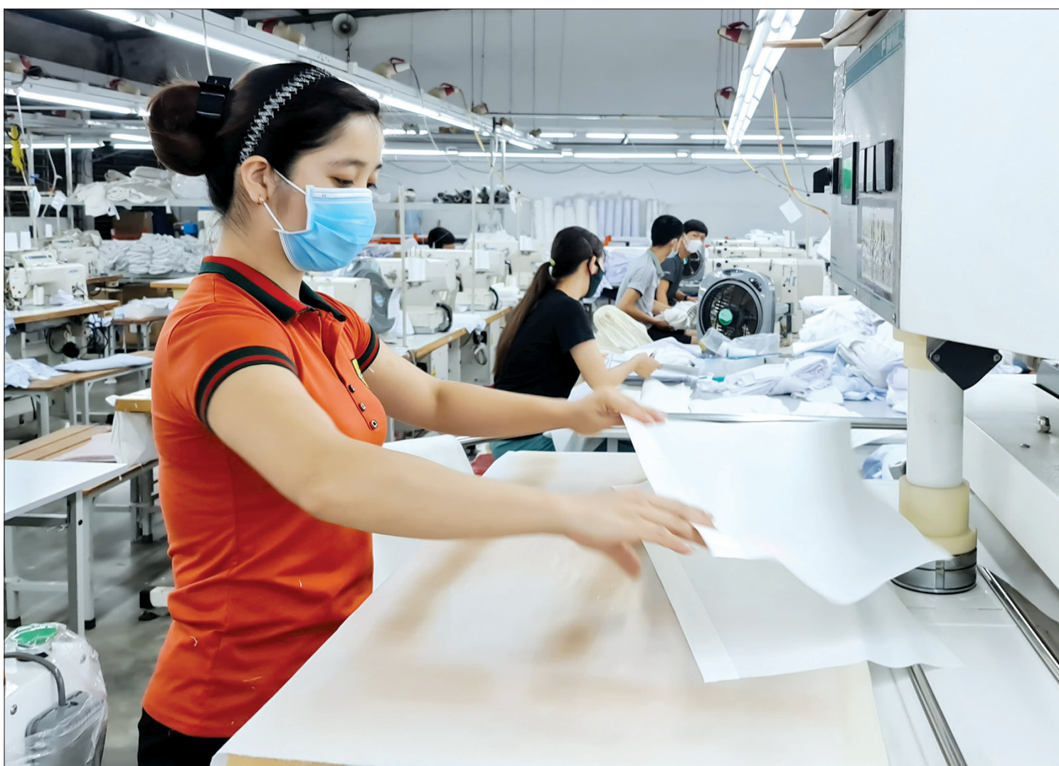
Các doanh nghiệp vừa phòng, chống dịch vừa thi đua đẩy mạnh sản xuất, kinh doanh. Trong ảnh: Sản xuất tại Công ty TNHH May Hưng Nhân.