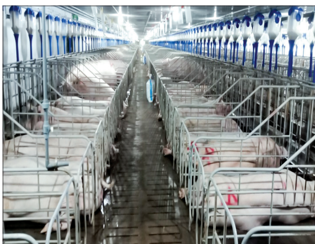
Chăn nuôi lợn phát triển theo hướng mở rộng trang trại, gia trại quy mô lớn.