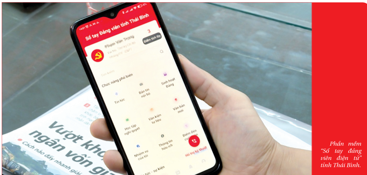
Phần mềm “Sổ tay đảng viên điện tử” tỉnh Thái Bình.

Kỷ niệm 60 năm ngày Bác Hồ về thăm Thái Bình lần thứ tư (26/3/1962 - 26/3/2022), 55 năm ngày Bác Hồ về thăm Thái Bình lần thứ năm (31/12/1966 - 31/12/2021), tối nay, ngày 7/1, Thái Bình chính thức khai trương phần mềm “Sổ tay đảng viên điện tử”. Đây là quyết tâm rất lớn của cấp ủy tỉnh trong việc ứng dụng công nghệ thông tin nhằm tiếp tục nâng cao chất lượng hoạt động, đổi mới phương thức lãnh đạo của các tổ chức đảng trong toàn Đảng bộ tỉnh.