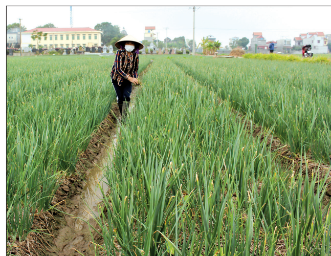
Vùng trồng tỏi - sản phẩm OCOP cấp tỉnh.