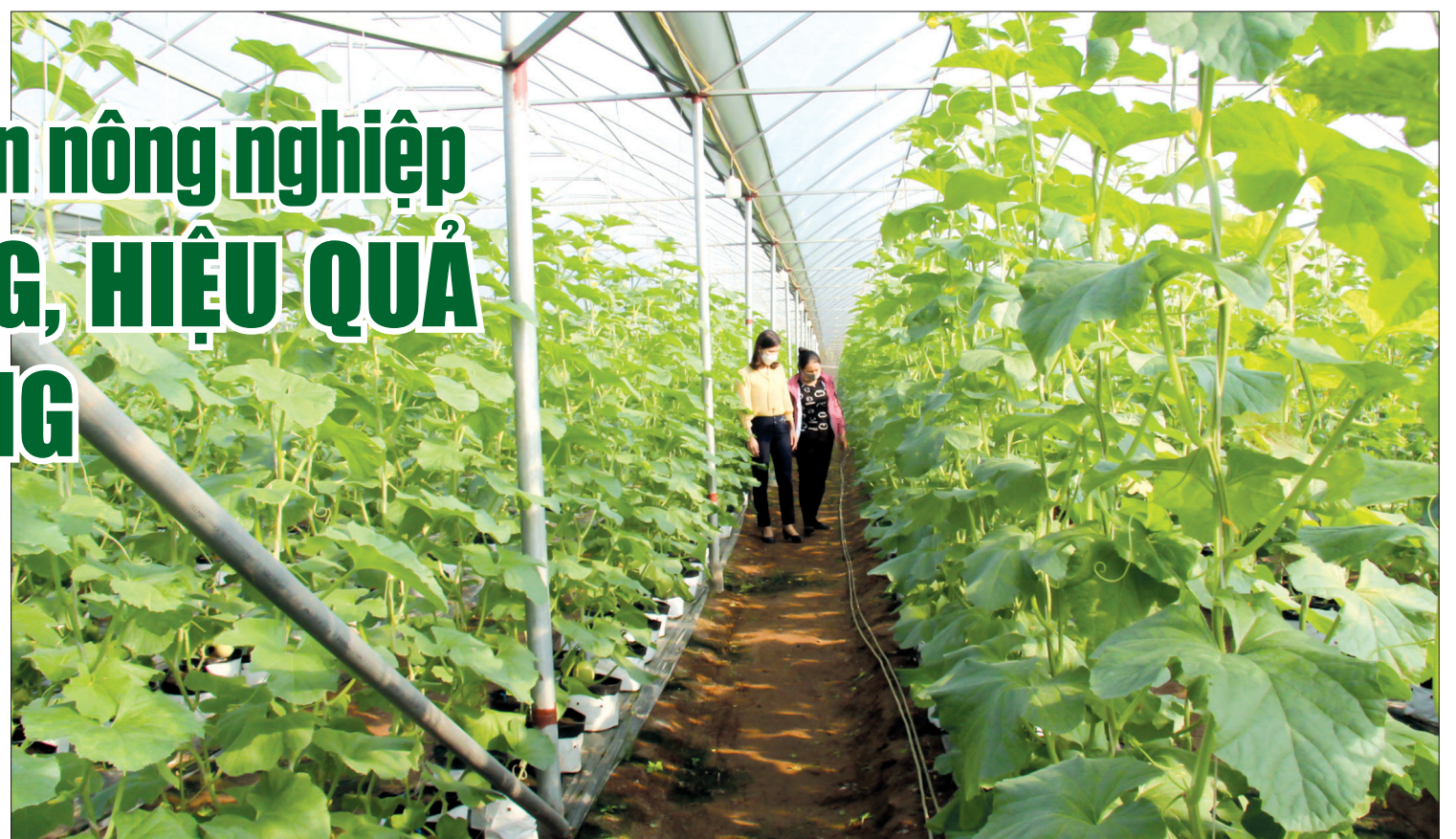
Mô hình trồng dưa lưới công nghệ cao có diện tích 1,7 mẫu tại xã Tiến Đức (Hưng Hà) cho thu nhập 600 triệu đồng/năm.