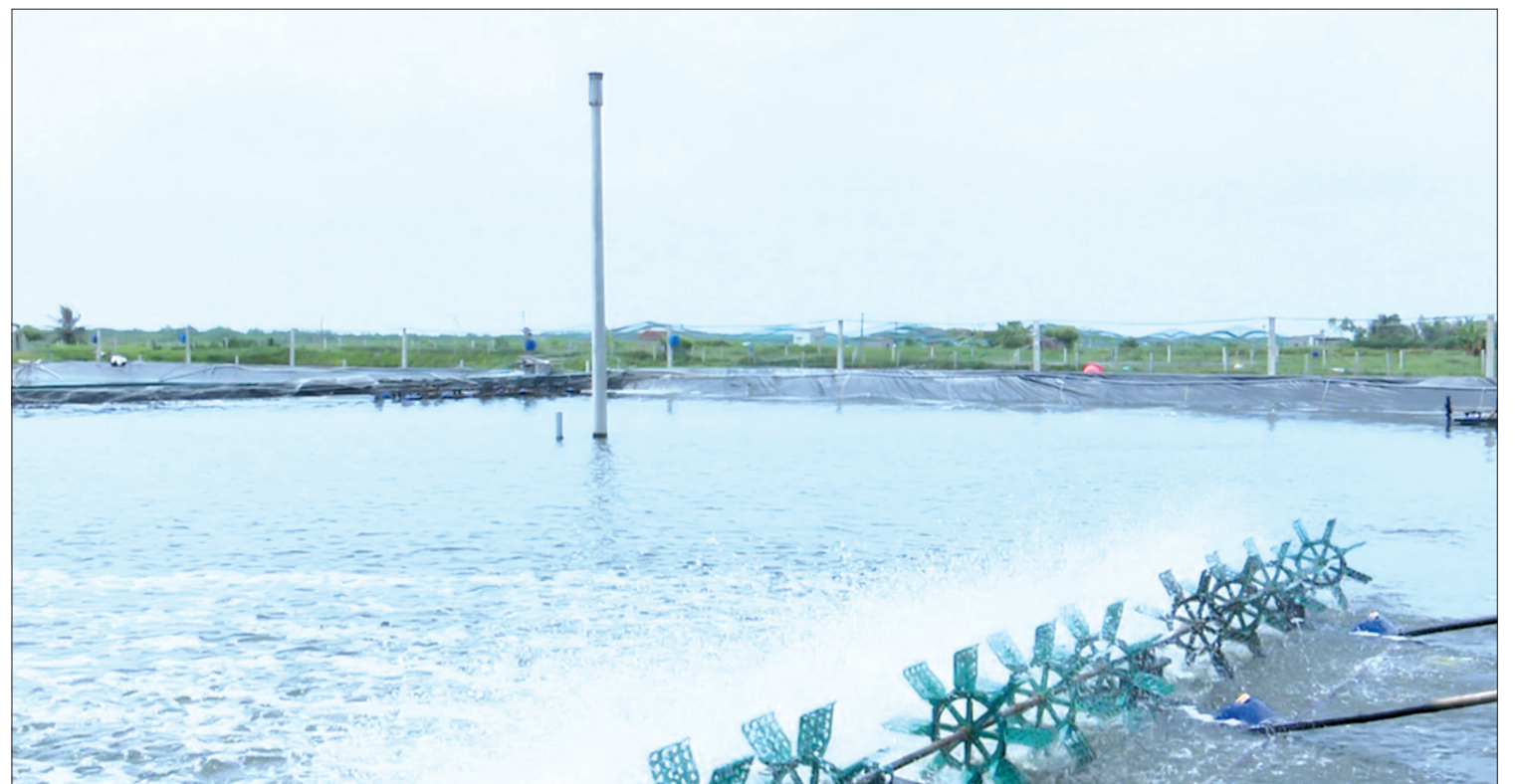
Mô hình nuôi tôm công nghệ cao tại xã Thái Thượng (Thái Thụy).