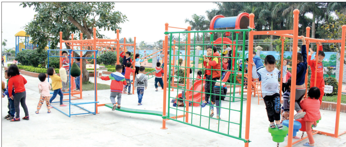
* Một số hình ảnh nông thôn Thái Bình đổi mới

xây dựng NTM nâng cao, NTM kiểu mẫu giai đoạn 2021 - 2025, định hướng đến năm 2030 với mục tiêu phấn đấu đến năm 2025 có trên 20% số xã đạt chuẩn NTM nâng cao, trong đó có 10% số xã trở lên đạt NTM kiểu mẫu. Đây là quyết tâm lớn của cả hệ thống chính trị và nhân dân trong tỉnh trong giai đoạn mới.