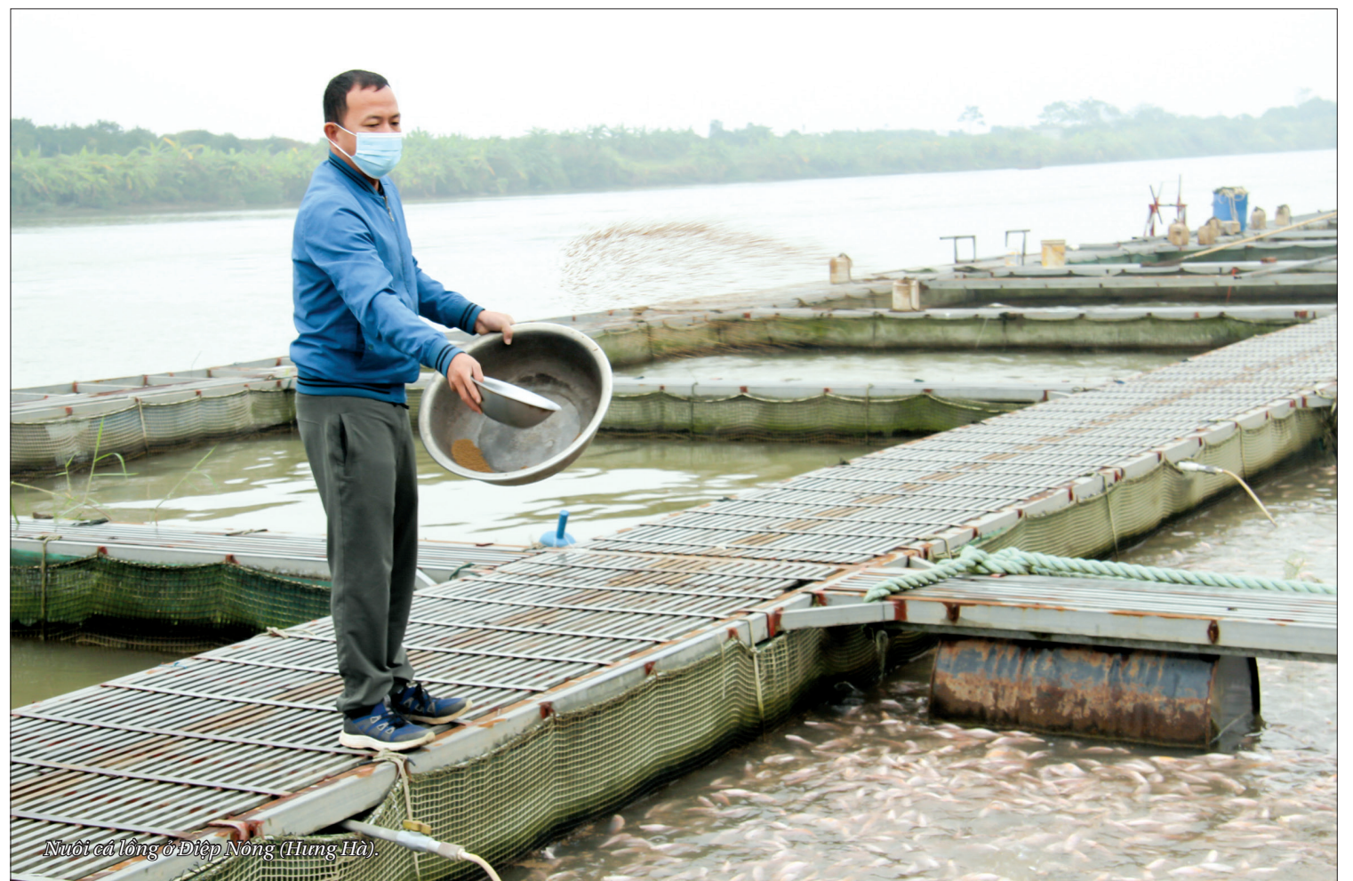
Nuôi cá lồng ở Điệp Nông (Hưng Hà).

Nghề nuôi cá lồng trên sông đã góp phần không nhỏ trong việc chuyển đổi cơ cấu sản xuất ở địa phương, giúp hàng trăm hộ dân của huyện tăng thu nhập, tạo sự đa dạng ngành nghề ở nông thôn. Tuy còn đó những khó khăn nhưng nghề nuôi cá lồng vẫn đang trên đà phát triển, tạo ra nguồn thực phẩm sạch, ngon, được ưa chuộng, nhất là trong dịp tết Nguyên đán.