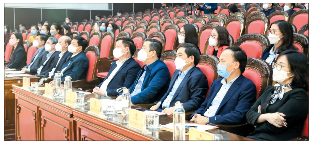
Các đồng chí lãnh đạo tỉnh dự buổi tổng duyệt.