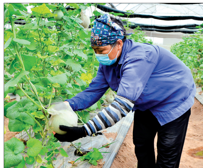
Mô hình trồng dưa lưới công nghệ cao.