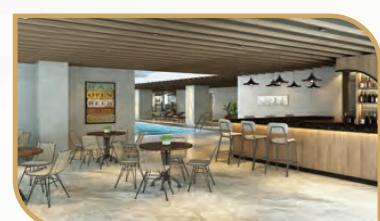
SUNRISE POOL BAR