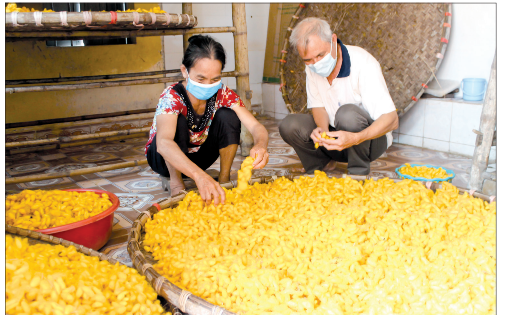
Hiện nay, người dân xã Hồng Phong (Vũ Thư) còn nuôi tằm lấy nhộng thương phẩm, đáp ứng nhu cầu thực phẩm sạch của thị trường.

"Trước đây, tất cả các hộ đều kết hợp trồng dâu với nuôi tằm, vì vậy mỗi hộ chỉ có 2 - 3 sào dâu, sản lượng nuôi tằm thấp, thường chỉ đạt 1 - 3 tạ kén/hộ/năm. Nhưng hiện nay, quy mô sản xuất của các hộ được nâng lên. Hộ không có nhân lực nuôi tằm chuyển sang chuyên trồng dâu, diện tích từ 1 - 2 mẫu/hộ, chuyên cung cấp cho các hộ nuôi tằm quy mô lớn tại địa phương. Các hộ nuôi tằm có điều kiện mở rộng quy mô sản xuất, sản