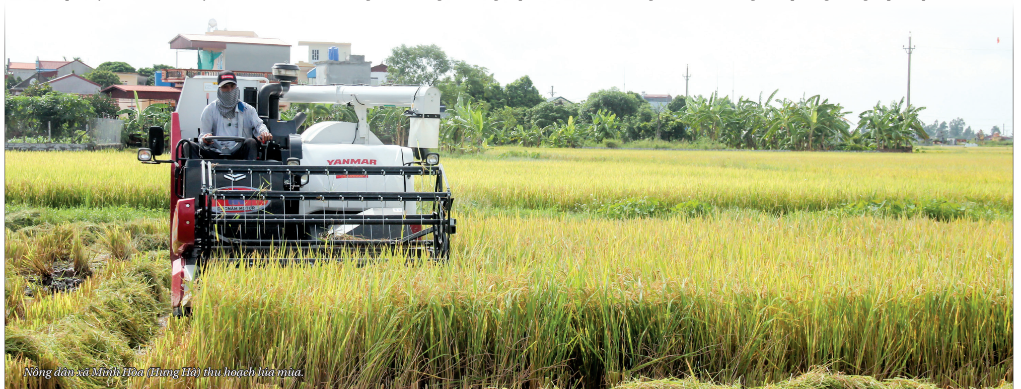
Nông dân xã Minh Hòa (Hung Hà) thu hoạch lúa mùa.

Để mở hướng phát triển nông nghiệp một cách hiệu quả, các nhóm giải pháp chính được ngành nông nghiệp xác định là phát triển nguồn nhân lực đáp ứng yêu cầu cơ cấu lại nông nghiệp hiệu quả, phát triển nông thôn bền vững; xây dựng kết cấu hạ tầng phục vụ nền nông nghiệp tích hợp đa giá trị và phát triển nông thôn hiện đại, bền vững; đổi mới cơ cấu đầu tư công, thu hút các nguồn lực để phát triển nông nghiệp, nông thôn; đổi mới và phát triển các hình thức tổ chức sản xuất, kinh doanh, hoàn thiện quan hệ sản xuất phù hợp; tăng cường hợp tác quốc tế.