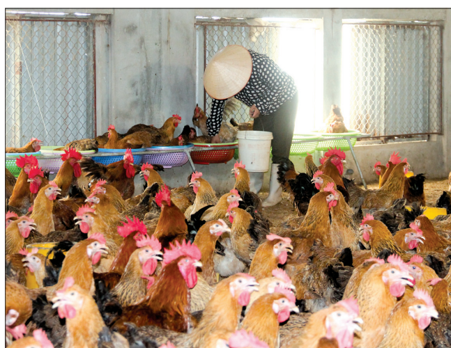
Tổng đàn gia cầm của Thái Bình duy trì khoảng 14 triệu con/năm.