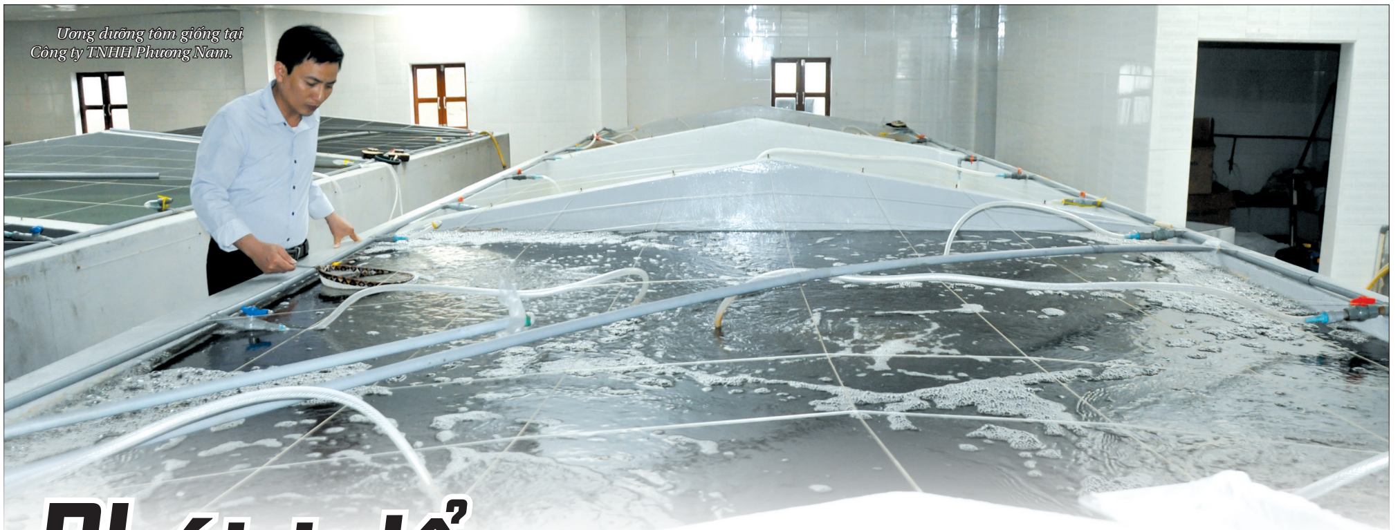
Ương dưỡng tôm giống tại Công ty TNHH Phương Nam.