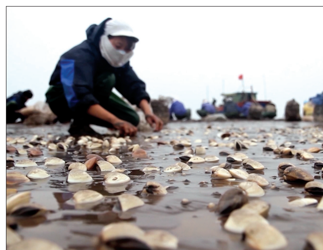
Diện tích nuôi ngao duy trì 3.169ha.