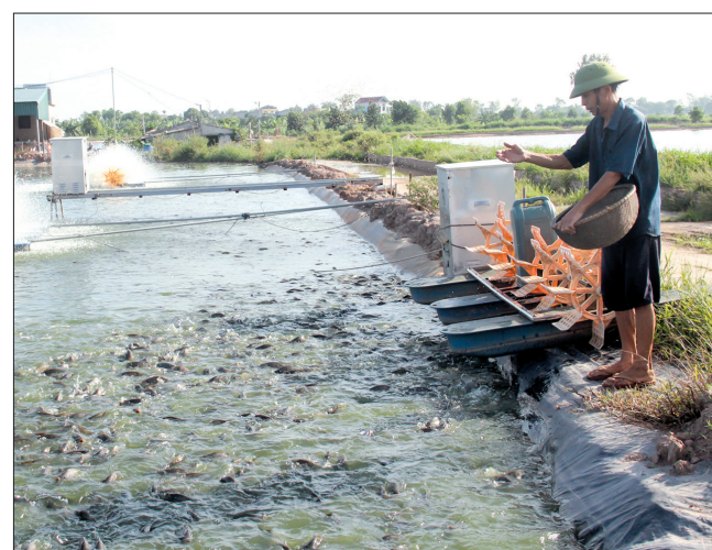
Nuôi thủy sản trên ao bán nổi được khuyến khích mở rộng.