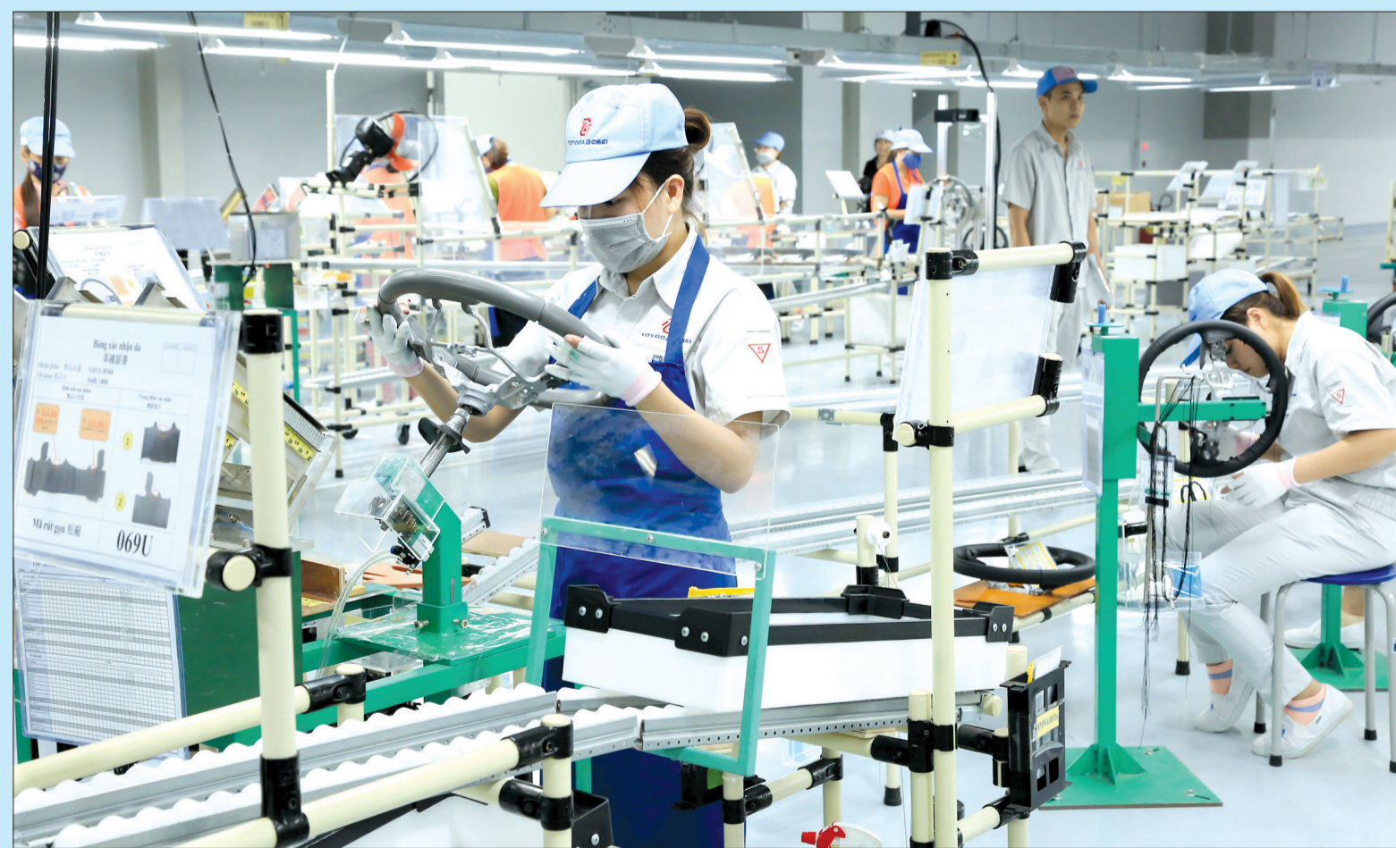
Nhà máy sản xuất linh kiện của Toyota Gosei tại khu công nghiệp Tiên Hải.