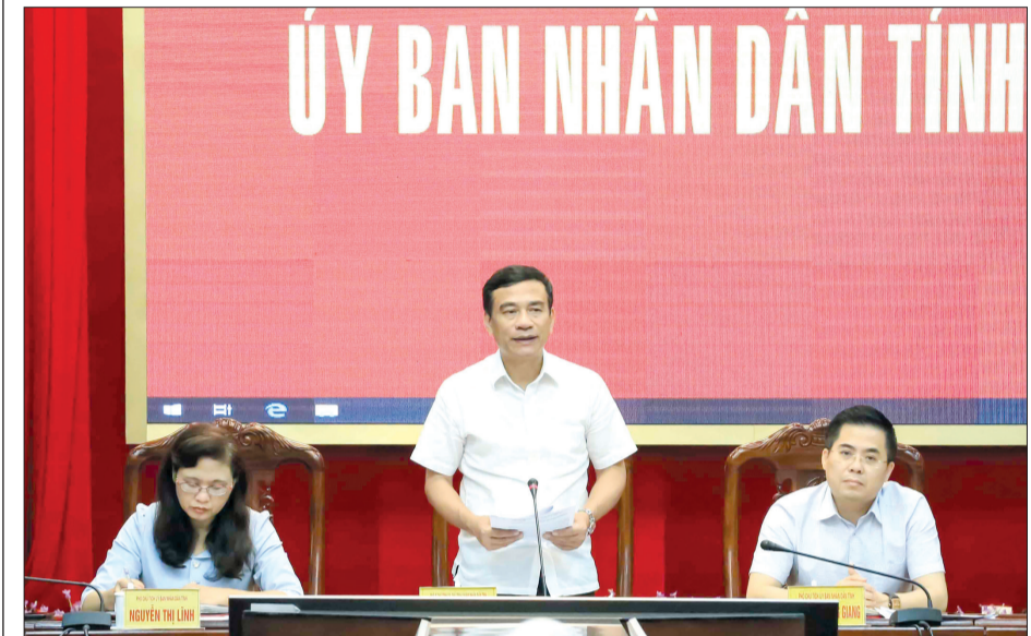
Đồng chí Đặng Trọng Thăng, Phó Bí thư Tỉnh ủy, Chủ tịch UBND tỉnh phát biểu tại cuộc họp nghe Sở Xây dựng báo cáo.