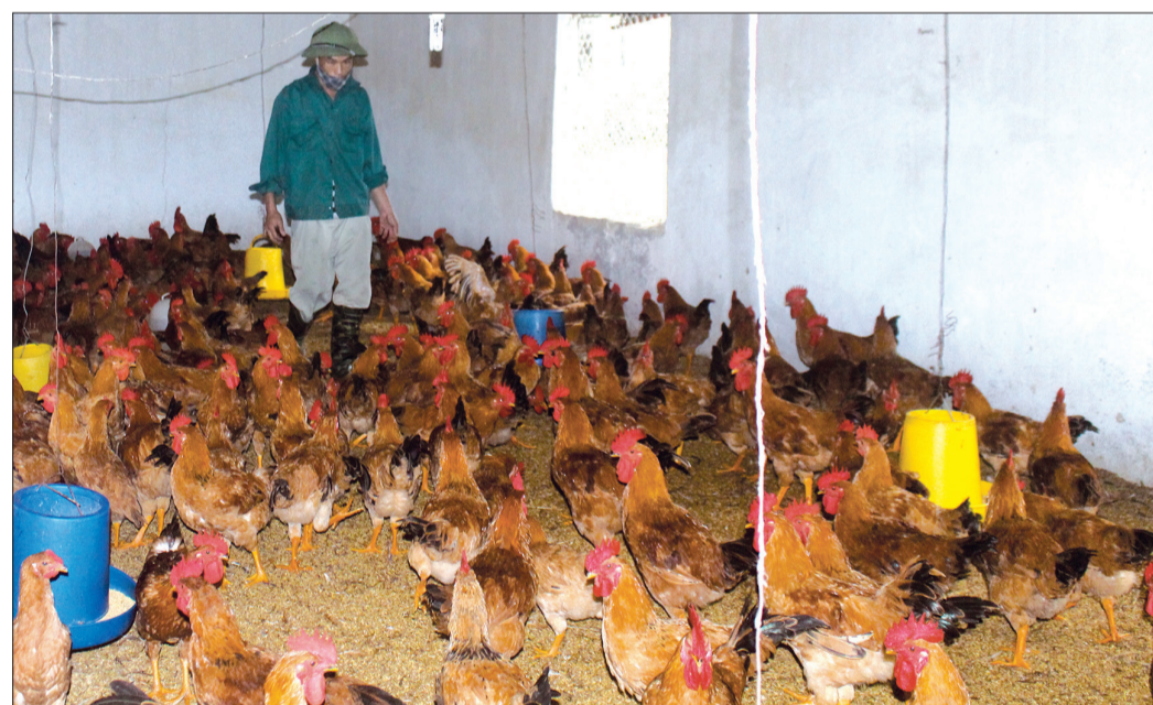
Người chăn nuôi quản lý nuôi nhốt gia cầm để hạn chế dịch bệnh.