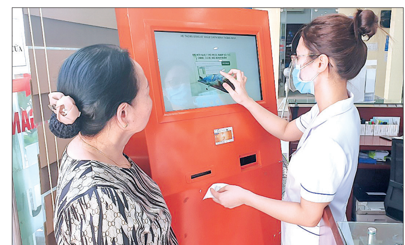
Bệnh viện Y học cổ truyền Thái Bình hiện đã đầu tư đồng bộ hệ thống hạ tầng kỹ thuật để triển khai thẻ khám chữa bệnh thông minh, không dùng tiền mặt.