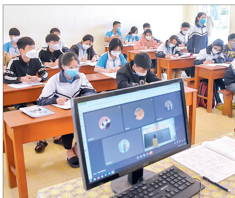
Khí dịch Covid-19 bùng phát, việc dạy học trực tiếp kết hợp trực tuyến phát huy hiệu quả.

Đặc biệt, trong lĩnh vực chính quyền số, kinh tế số, xã hội số đạt được kết quả nổi bật.