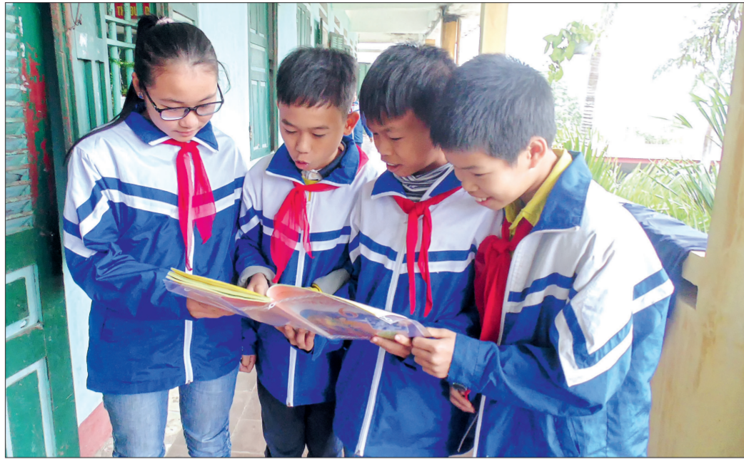
Học sinh Trường THCS Đông Hòa (thành phố Thái Bình) trao đổi bài.

Nhờ làm tốt công tác xây dựng đội ngũ giáo viên giỏi, tuyển chọn học sinh tiêu biểu đồng thời có chế độ khuyến khích những cá nhân có thành tích cao nên kết quả giáo dục mũi nhọn của thành phố Thái Bình luôn đứng trong tốp đầu của tỉnh.