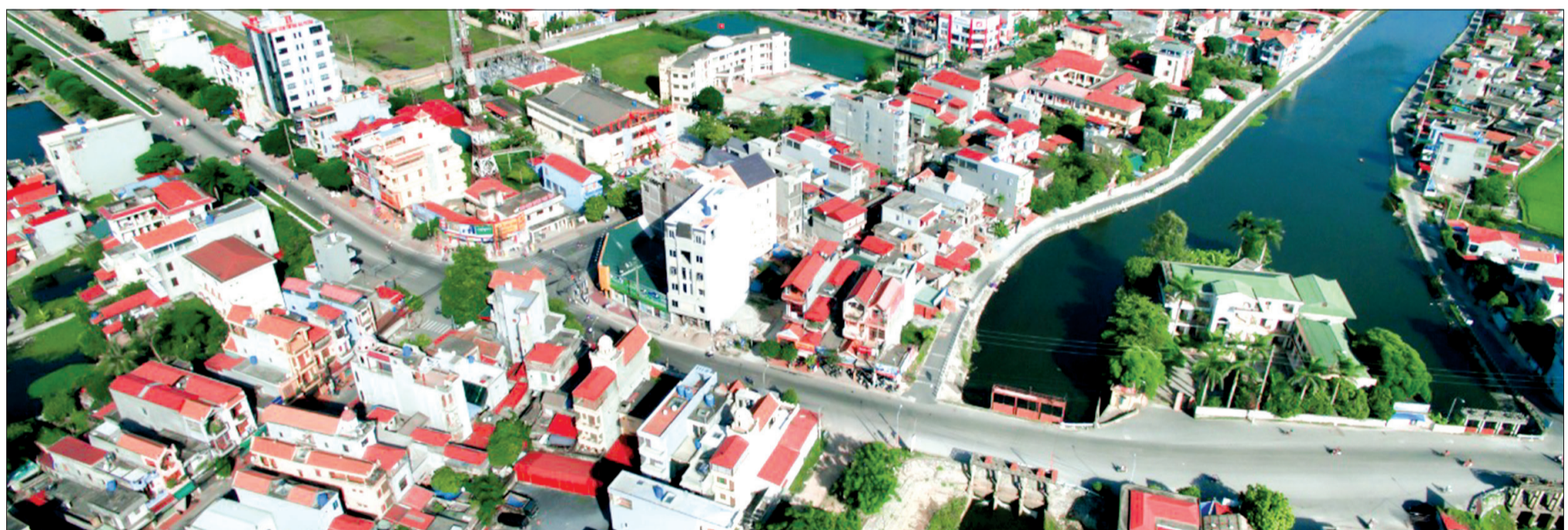
Thị trấn Diêm Điền (Thái Thụy).