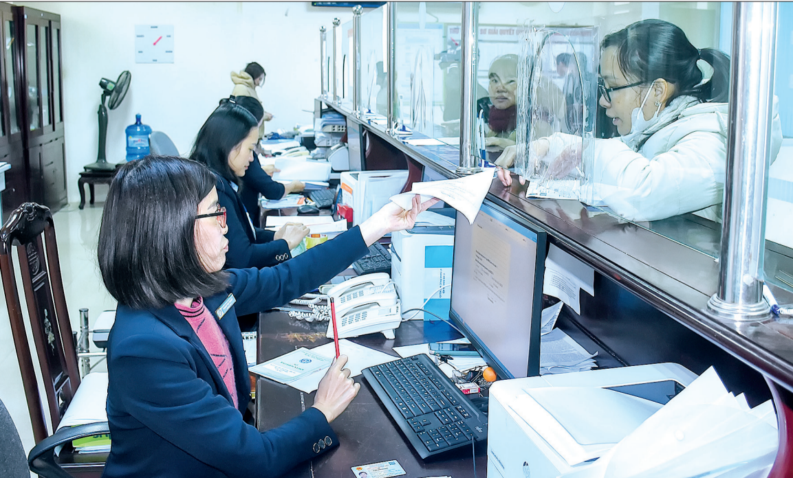
Cán bộ Bộ phận một cửa của BHXH tỉnh giải quyết thủ tục hành chính cho người dân.