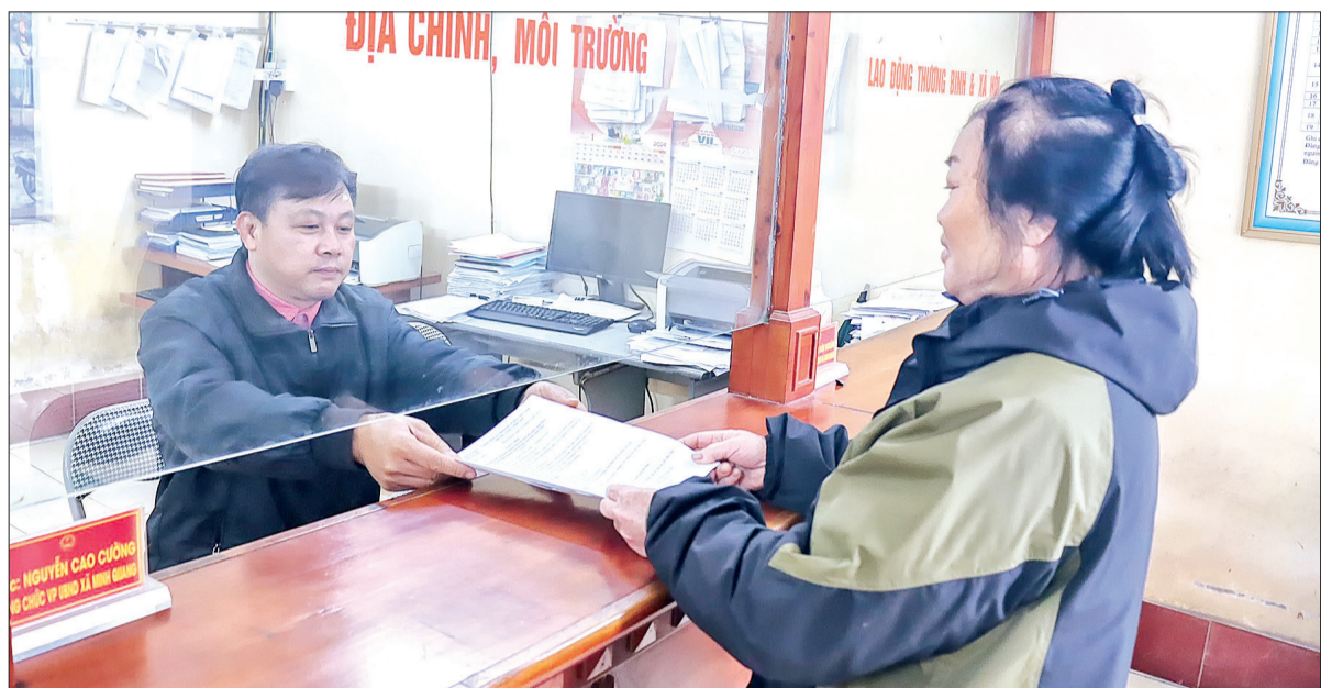
Người dân tới giải quyết thủ tục hành chính tại Bộ phận tiếp nhận và trả kết quả xã Minh Quang (Kiến Xương).