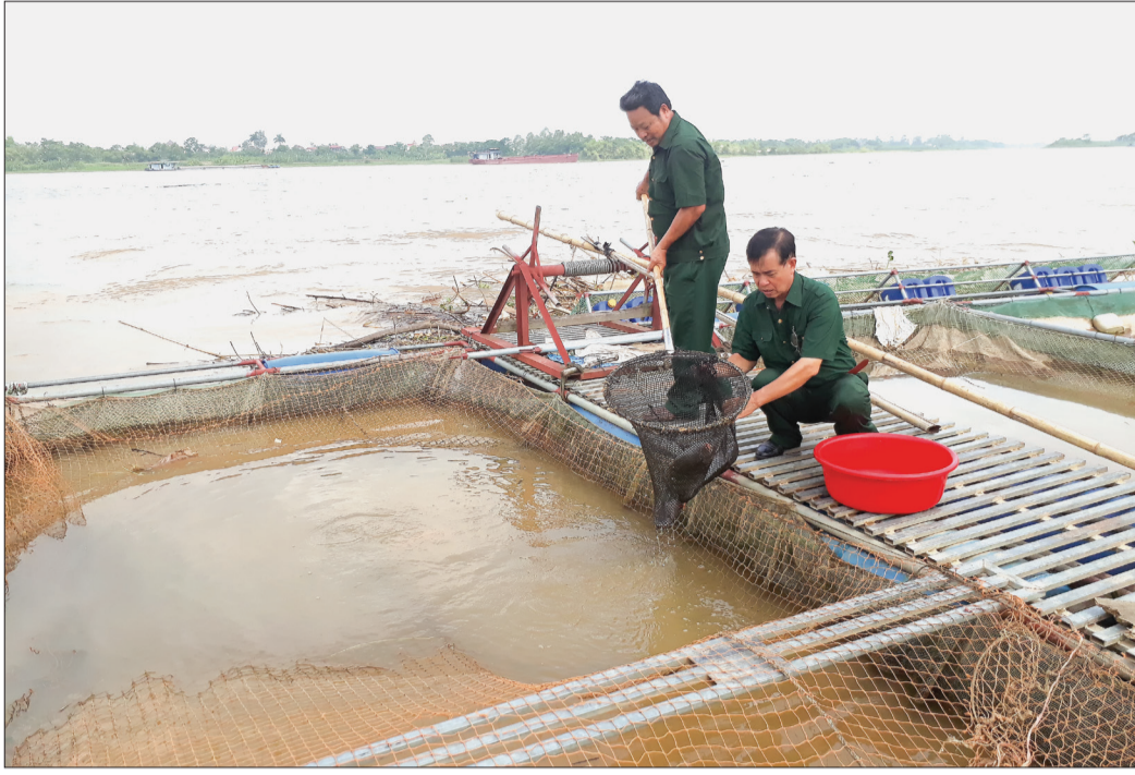
Nông dân xã Độc Lập (Hưng Hà) phát triển mô hình nuôi cá lồng trên sông.

Về đích huyện nông thôn mới (NTM) năm 2015 là động lực để Đảng bộ và nhân dân Hưng Hà tiếp tục phát huy truyền thống quê hương, không ngừng nỗ lực phấn đấu và đạt kết quả đáng ghi nhận trên các lĩnh vực, nhất là trong xây dựng NTM nâng cao, NTM kiểu mẫu. Năm 2011, khi triển khai xây dựng NTM, xã Hòa Bình gặp không ít khó khăn. Quán triệt tinh thần phát huy nội lực xây dựng kết cấu hạ tầng phục vụ sản xuất và đời sống, chỉnh trang các khu dân cư theo tiêu chí NTM, Đảng bộ và nhân dân trong xã đã nỗ lực phấn đấu, đến tháng