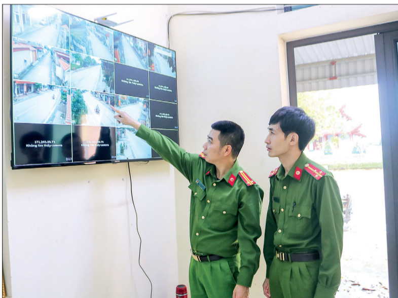
Hệ thống camera giúp lực lượng Công an xã Bắc Sơn kịp thời xử lý tình hình an ninh trật tự trên địa bàn.

Tăng cường tuyên truyền, huy động sức mạnh của cả hệ thống chính trị và toàn dân, duy trì hiệu quả các mô hình tự quản giữ gìn an ninh trật tự (ANTT)... là những cách làm hiệu quả giúp xã Bắc Sơn trở thành điểm sáng trong công tác phòng, chống tội phạm và tệ nạn xã hội của huyện Hưng Hà.