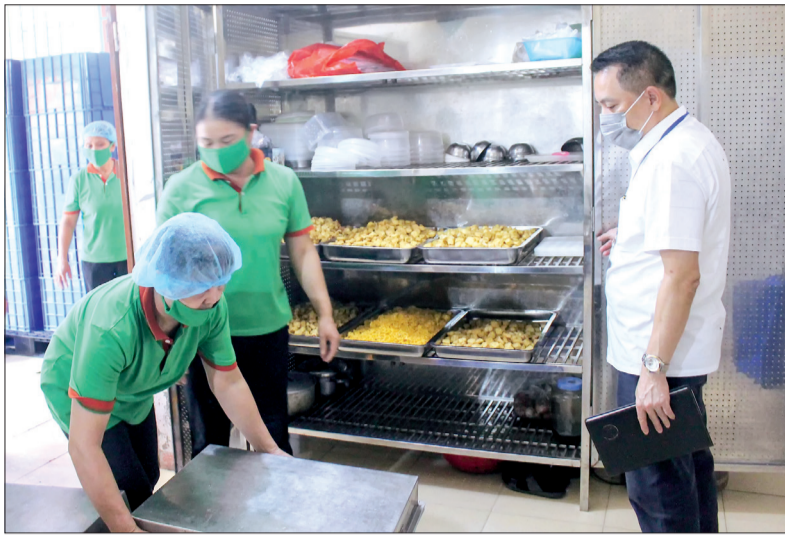
Chi cục An toàn vệ sinh thực phẩm tỉnh kiểm tra tại bếp ăn trường học.

Tháng hành động vì an toàn thực phẩm (ATTP) năm nay có chủ đề bảo đảm an ninh, ATTP trong tình hình mới. Hướng ứng tháng hành động vì ATTP, các cấp, ngành, địa phương, đơn vị trong tỉnh đã phát động chiến dịch truyền thông, đồng thời tăng cường kiểm tra nhằm tạo đợt cao điểm về ATTP.