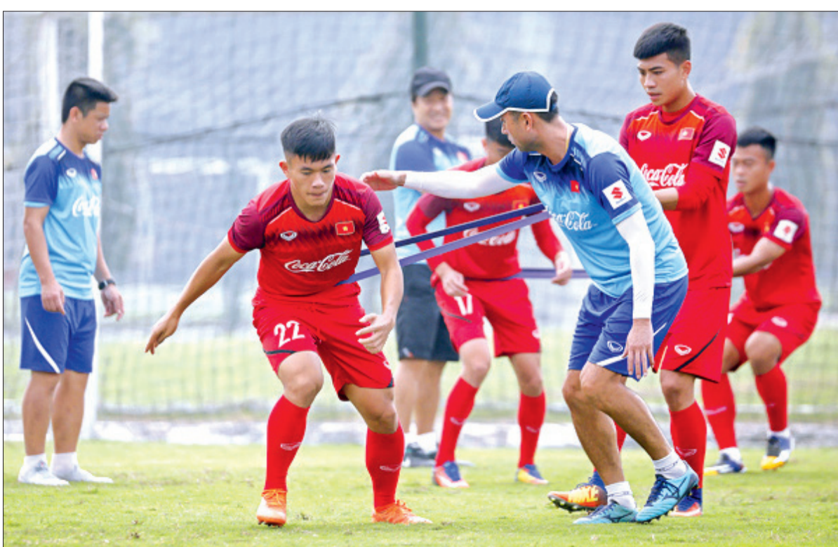
Các cầu thủ U23 Việt Nam tập với chuyên gia thể lực.

vẫn đang tiếp tục luyện tập chờ ngày khai cuộc vòng loại vào ngày 22/3 tới.