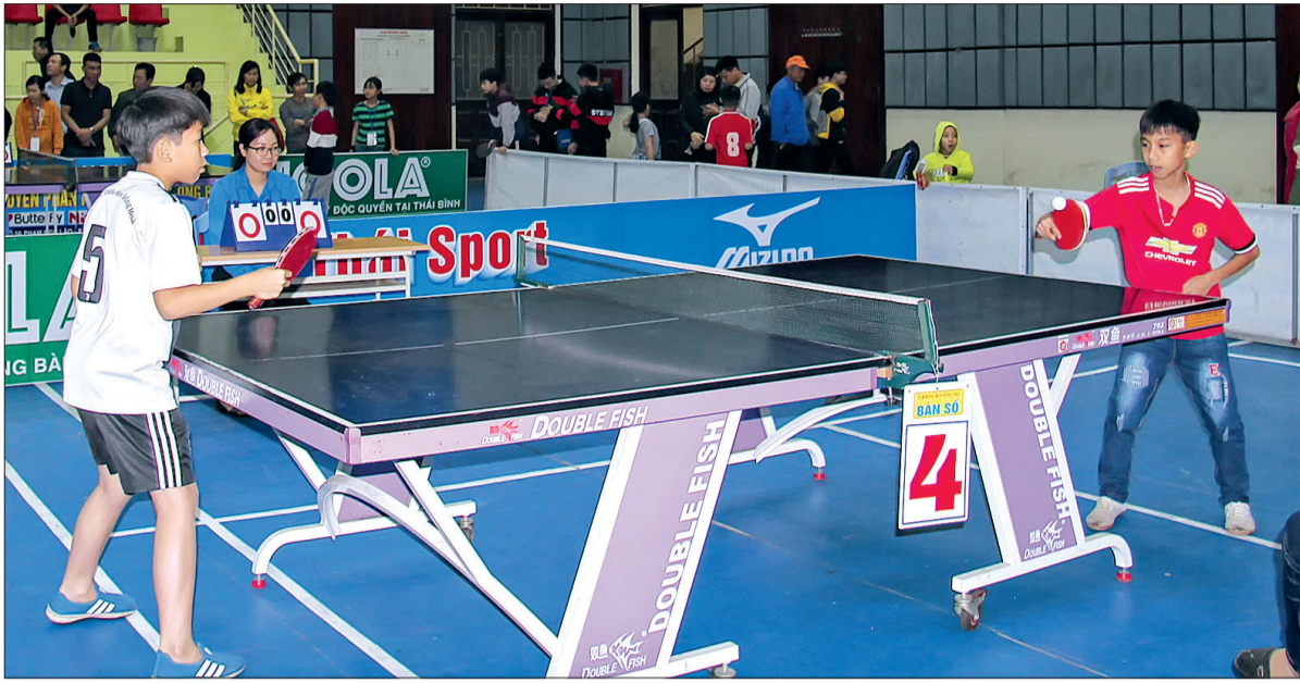
Các vận động viên thi đấu sôi nổi.

Ngày 16/3, giải bóng bàn thiếu niên nhi đồng tỉnh Thái Bình lần thứ IV năm 2019 đã được tổ chức tại Nhà Văn hóa thiếu nhi tỉnh, làm thỏa lòng những người yêu môn thể thao này.