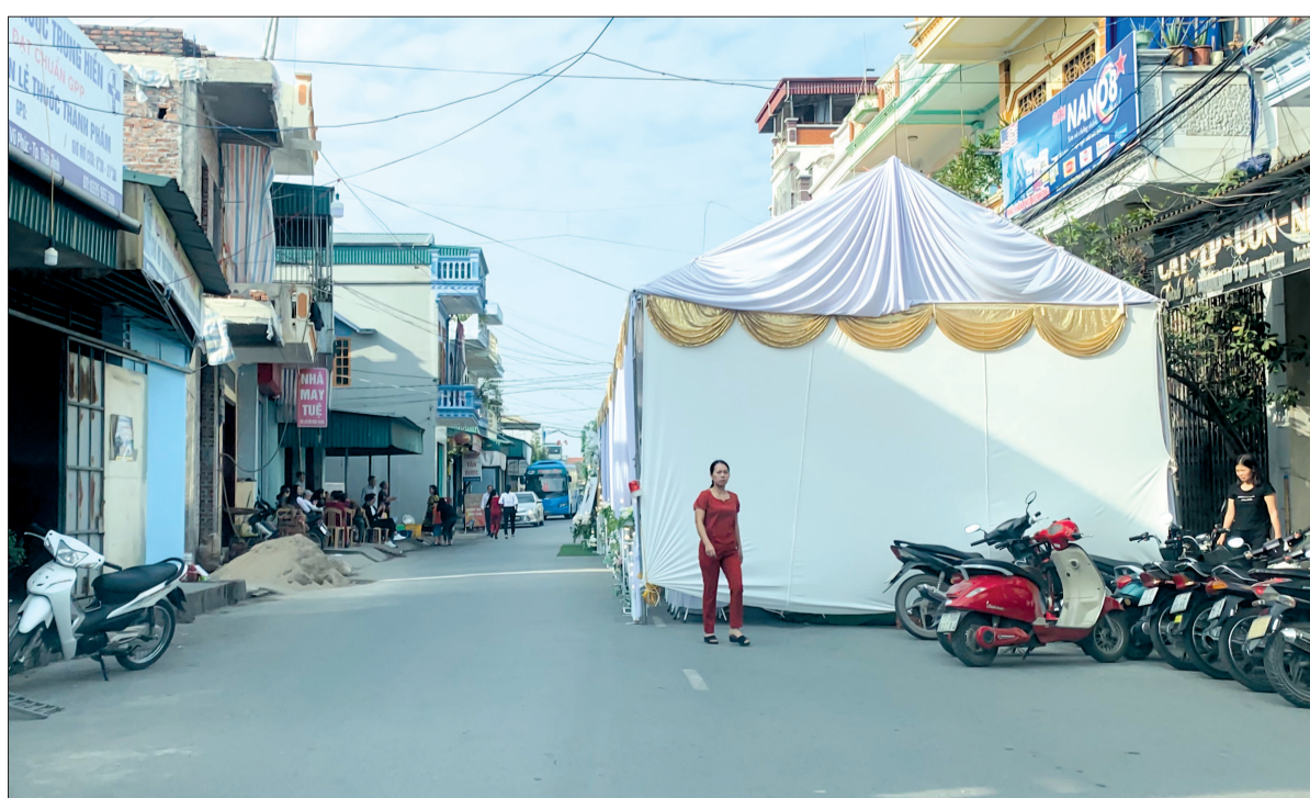
Rạp cưới dựng dưới lòng đường (ảnh chụp tại xã Vũ Phúc, thành phố Thái Bình ngày 23/11/2019).

hành Chỉ thị số 05 về việc tăng cường các biện pháp bảo đảm ATGT trên địa bàn tỉnh. Trong đó, yêu cầu UBND các huyện, thành phố tiếp tục thực hiện Chỉ thị số 04, ngày 8/3/2017 của UBND tỉnh về giải tỏa, chống lấn chiếm, sử dụng trái phép vỉa hè, lòng, lề đường, hành lang an toàn giao thông đường bộ trên địa bàn tỉnh đồng thời yêu cầu xử lý tình trạng lấn chiếm lòng đường, hè phố. Sau khi có chỉ đạo của UBND tỉnh, các địa phương đã đẩy mạnh tuyên truyền, vận động, quyết liệt xử lý những trường hợp vi phạm, do đó không để xảy ra tình trạng người dân dựng rạp dưới lòng đường. Tuy nhiên, hiện nay tình trạng này lại tái diễn ở một số nơi, gây cản trở giao thông, tiềm ẩn những tai nạn, rủi ro. Qua khảo sát của phóng viên cho thấy: Sáng ngày 20/11/2019, trên đường Lê Đại Hành, phường Kỳ Bá (thành phố Thái Bình) - khu vực gần điểm giao nhau với đường Lê Quý Đôn, người dân vô tư dựng rạp cưới lấn chiếm lòng đường. Ngày 21/11/2019, tại đường Lê Thánh Tông,