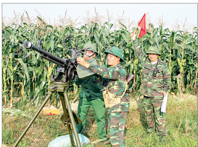
Nội dung diễn tập của Tiểu đoàn Dự bị động viên huyện Vũ Thư phối hợp tác chiến đánh địch tiến công hỏa lực đường không vào địa bàn.