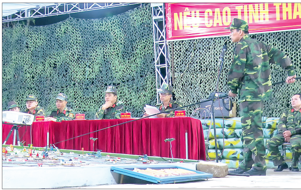
Lãnh đạo Ban CHQS huyện Vũ Thư giới thiệu phương án tác chiến trên sa bàn tại khu tập trung bí mật.