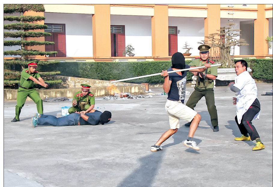
Công an huyện Vũ Thư phối hợp diễn tập thủ phương án xử trí tình huống đánh chiếm lại mục tiêu, giải cứu con tin.