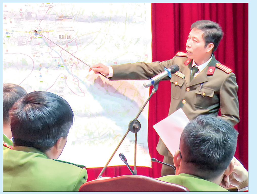
Công an huyện Vũ Thư triển khai phương án xử trí tình huống đánh chiếm lại mục tiêu, giải cứu con tin.