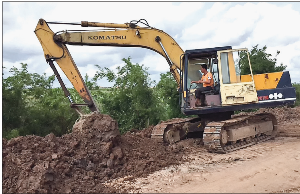
Thi công nâng cấp mở rộng, củng cố tuyến đề hữu Trà Lý đoạn K5+500 đến K8+800.

Với khoảng 100km đề các loại, huyện Vũ Thư nằm trong top đầu của tỉnh về chiều dài đề trên địa bàn. Trong điều kiện hệ thống đề ngày càng xuống cấp, thiên tai diễn biến khó lường, bước vào mùa mưa lũ năm nay, huyện và các địa phương chủ động kiểm tra, rà soát, nâng cấp, tu bổ hệ thống đề điều trên địa bàn.