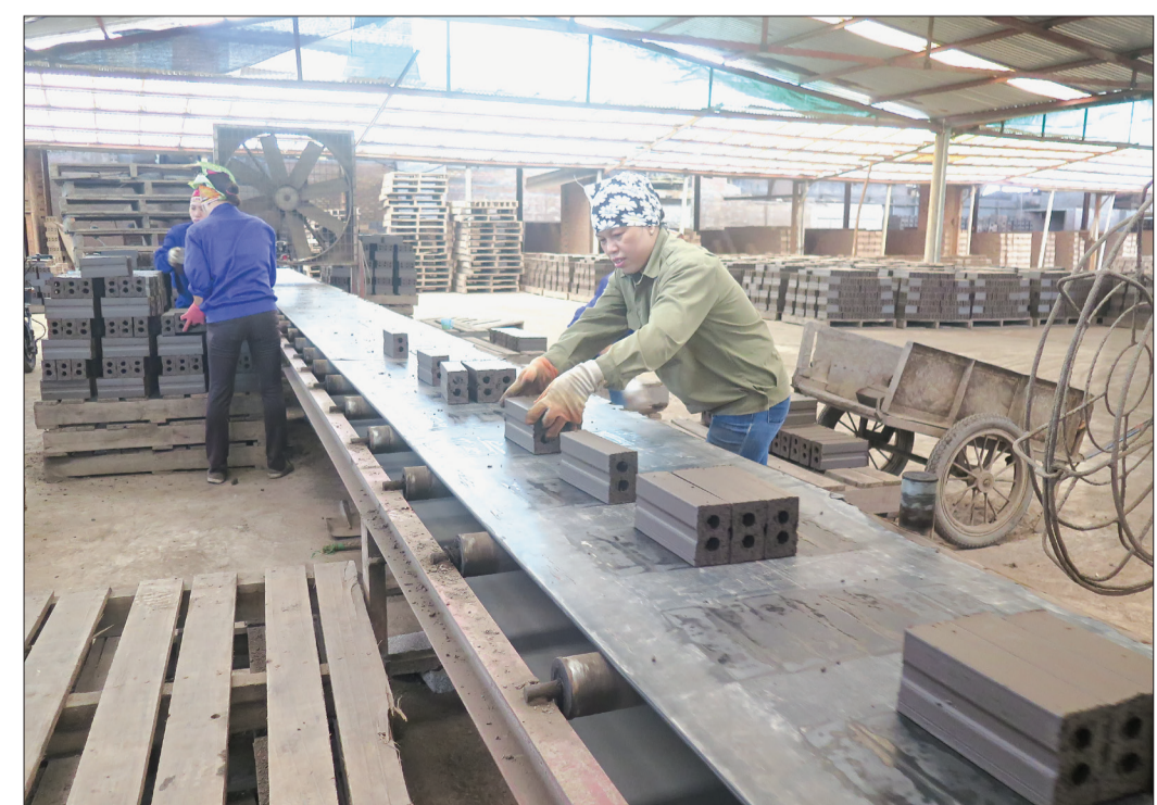
Dây chuyền sản xuất gạch tuynel của Công ty.