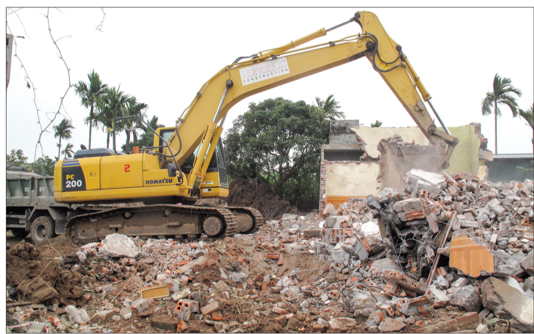
Đơn vị thi công đẩy nhanh tiến độ, phần đầu thông tuyến trước tết Nguyên đán.