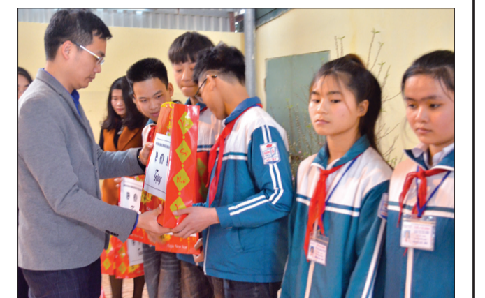
Đoàn Thanh niên Tập đoàn Dầu khí quốc gia Việt Nam tặng quà tết cho học sinh Trường THCS Vũ Tây.

Ngân hàng Thương mại cổ phần Ngoại thương Việt Nam (Vietcombank) Chi nhánh Thái Bình phối hợp với Hội Chữ thập đỏ huyện Đông Hưng vừa tổ chức trao quà cho hộ nghèo, gia đình chính sách và các em học sinh có hoàn cảnh khó khăn của xã Đông La.