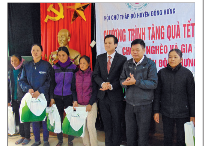
Lãnh đạo Vietcombank Chi nhánh Thái Bình trao quà cho hộ nghèo và các đối tượng chính sách trên địa bàn xã Đông La (Đông Hưng).