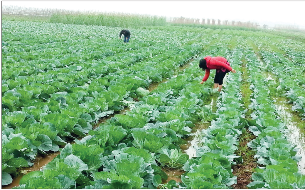
Mô hình trồng rau hữu cơ tại xã Thanh Tân (Kiến Xương) mang lại hiệu quả kinh tế cao.

Thời gian qua, HĐND huyện Kiến Xương đã chú trọng làm tốt khâu chuẩn bị nội dung, chương trình kỳ họp. Thường trực HĐND huyện xây dựng và phân công điều hành kỳ họp một cách chặt chẽ, khoa học về cả nội dung, thời gian. Hầu hết nội dung các báo cáo trình bày tại kỳ họp đều thực hiện theo hình thức tóm tắt, được gửi trước cho đại biểu HĐND huyện nghiên cứu, tăng thời gian cho phiên thảo luận, chất vấn, trả lời chất vấn và giải trình các ý kiến, kiến nghị của cử tri.