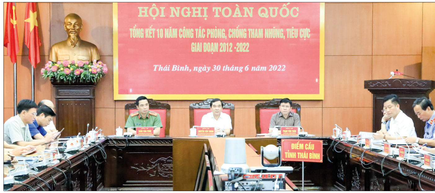
Đồng chí Nguyễn Tiến Thành, Phó Bí thư thường trực Tỉnh ủy, Chủ tịch HĐND tỉnh, Phó Trưởng ban Chỉ đạo phòng, chống tham nhũng, tiêu cực tỉnh và đại biểu dự hội nghị tại điểm cầu Thái Bình.

và phát triển kinh tế - xã hội của đất nước. Công tác phát hiện, xử lý tham nhũng, tiêu cực được tập trung lãnh đạo, chỉ đạo quyết liệt, kết hợp giữa xử lý hành chính, xử lý kỷ luật của Đảng, của Nhà nước, của đoàn thể với xử lý hình sự; kỷ luật của Đảng được thực hiện trước, mở đường, tạo điều kiện cho kỷ luật của Nhà nước, kỷ luật của đoàn thể và xử lý hình sự, rất nghiêm khắc nhưng cũng rất nhân văn, không có vung cấm, không có ngoại lệ, bất kể thời đó là ai. Đây là bước đột phá trong công tác PCTN, tiêu cực. Công tác xây dựng, hoàn thiện thể chế của Đảng, Nhà nước về xây dựng Đảng, quản lý kinh tế - xã hội và PCTN, tiêu cực được đẩy mạnh, từng bước hoàn thiện cơ chế phòng ngừa chặt chẽ để "không thể tham nhũng, tiêu cực". Công tác cán bộ được chú trọng, trách nhiệm giải trình trong hoạt động công vụ và các giải pháp phòng ngừa tham nhũng, tiêu cực đạt kết quả tích cực. Công tác thông tin, tuyên truyền, giáo dục về PCTN, tiêu cực được đổi mới, tăng cường, góp phần nâng cao nhận thức và tạo đồng thuận cao trong xã hội; vai trò của MTTQ, các tổ chức chính trị - xã hội, nhân dân và báo chí trong PCTN, tiêu cực được phát huy tốt hơn. Phát biểu chỉ đạo tại hội nghị, đồng chí Nguyễn Phú Trọng, Tổng