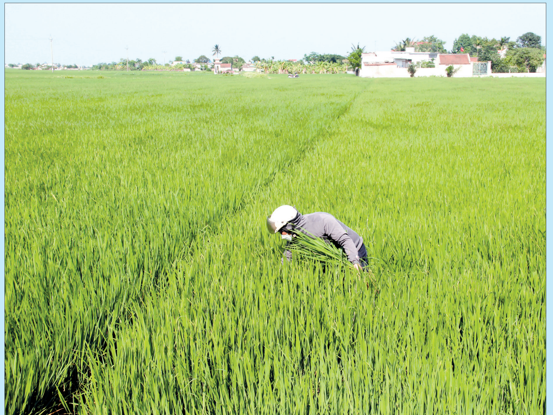
Cán bộ Chi cục Trồng trọt và Bảo vệ thực vật kiểm tra diễn biến sâu bệnh hại.