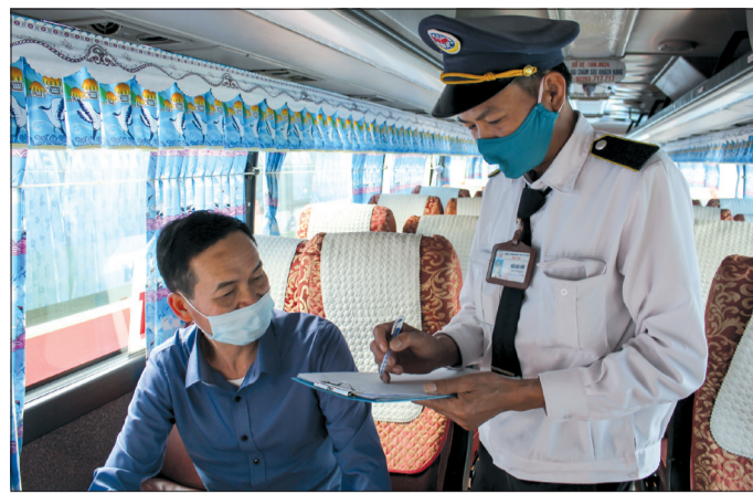
Hãng xe Hải Âu lấy thông tin hành khách đi tuyến Thái Bình - Hà Nội phục vụ công tác phòng, chống dịch Covid-19.

theo đúng chỉ đạo của Sở Giao thông Vận tải. Đối với hành khách chúng tôi yêu cầu đeo khẩu trang, sát khuẩn tay bằng dung dịch sát khuẩn khi lên xe. Cùng với đó, nhân viên lái xe tiến hành lập danh sách tất cả các hành khách theo từng chuyến đi bao gồm họ tên, số điện thoại, địa chỉ và vị trí đón, trả khách để phục vụ công tác phòng, chống dịch khi cần thiết. Sau khi kết thúc mỗi chuyến đi, tất cả các đồ dùng trên xe đều được vệ sinh, khử khuẩn. Do ảnh hưởng của dịch Covid-19, hiện nay, các phương tiện chạy tuyến liên tỉnh tại Bến xe khách Thái Bình đều chung tình trạng