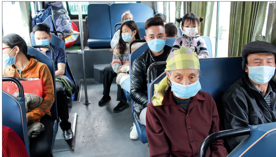
Hành khách đi trên tuyến xe buýt thành phố Thái Bình - Thụy Tân (Thái Thụy) đều đeo khẩu trang để phòng, chống dịch Covid-19.

Trước diễn biến phức tạp của dịch Covid-19, Sở Giao thông Vận tải đã và đang tăng cường chỉ đạo các đơn vị kinh doanh vận tải hành khách đường bộ và vận tải hàng hóa, các bến xe khách, các bến phà, bến khách ngang sông thực hiện nghiêm các biện pháp phòng, chống dịch trong hoạt động vận tải.