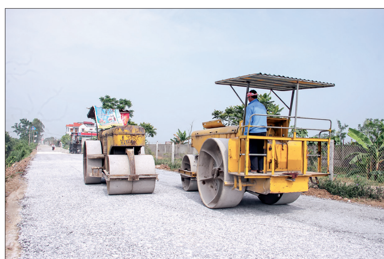
Thi công dự án cải tạo, nâng cấp đường ĐH.45 đoạn từ đường ĐH.45B đến Công ty may Trường Sơn Thịnh.

Dự án cải tạo, nâng cấp đường ĐH.45 đoạn từ đường ĐH.45B đến Công ty may Trường Sơn Thịnh được triển khai thi công từ tháng 2/2019 đến nay đã hoàn thành trên 70% khối lượng công trình. Các hạng mục chính của dự án như 1,8km rãnh thoát nước dọc qua khu dân cư, 8 công ngang đường đã được nhà thầu thi công xong. Theo quyết định phê duyệt chủ trương đầu tư, dự án cải tạo, nâng cấp đường ĐH.45 đoạn từ đường ĐH.45B đến Công ty may Trường Sơn Thịnh có chiều dài 3,4km, được thiết kế theo tiêu chuẩn đường cấp IV đồng bằng, bề rộng nền đường 9m, trong đó bề rộng mặt đường 7m và bề rộng lề đường mỗi bên 1m.