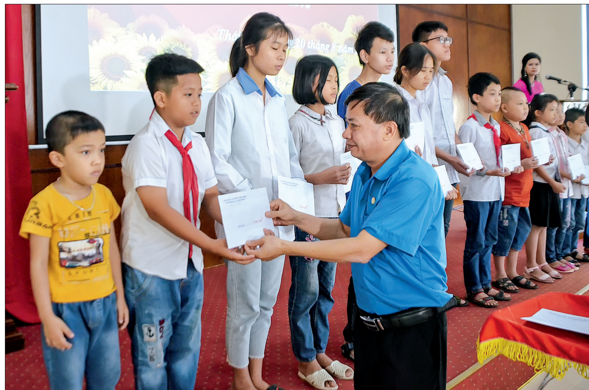
Lãnh đạo Liên đoàn Lao động tỉnh trao quà cho con cán bộ, CNVCLĐ có hoàn cảnh khó khăn vượt khó vươn lên trong học tập.

các cháu có thành tích cao trong học tập, việc quan tâm, chăm lo cho các cháu có hoàn cảnh khó khăn được các cấp công đoàn trong tỉnh chú trọng. Hàng năm, các cấp công đoàn đều tổ chức nhiều hoạt động thiết thực vì con đoàn viên, CNVCLĐ; làm tốt công tác khuyến học, khuyến tài tại cơ quan, đơn vị; duy trì việc tổ chức gặp mặt, động viên các cháu chăm ngoan, học giỏi, học sinh vượt khó vươn lên trong học tập.