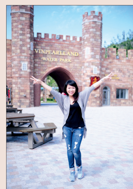
Cổng chào của Vinpearl Land là điểm check-in của nhiều bạn trẻ.

Được đặt tại một trong 29 vịnh biển đẹp nhất thế giới, Vinpearl Land Nha Trang là công viên chủ đề nổi tiếng kết hợp bãi biển với vô số hoạt động phù hợp cho bạn trẻ, hay gia đình.