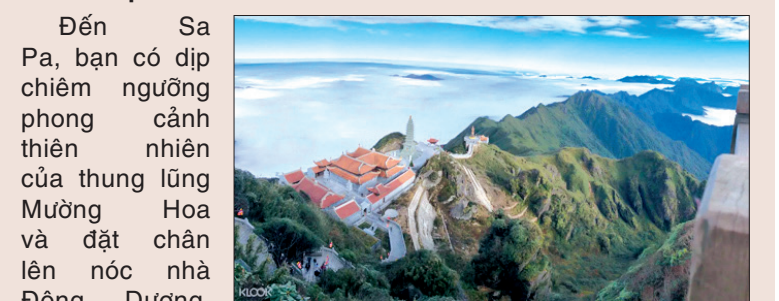
Fansipan - Sa Pa ở độ cao 3.143m so với mực nước biển.

Đến Sa Pa, bạn có dịp chiêm ngưỡng phong cảnh thiên nhiên của thung lũng Mường Hoa và đặt chân lên nóc nhà Đông Dương, Fansipan ở độ cao 3.143m so với mực nước biển.