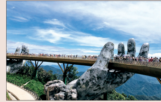
Cầu Vàng - một trong những điểm đến ấn tượng trên đỉnh Bà Nà.

Đến Đà Nẵng, du khách bị cuốn hút bởi nét đẹp của những bãi biển, nhiều loại hải sản và những trải nghiệm tại Bà Nà Hills.