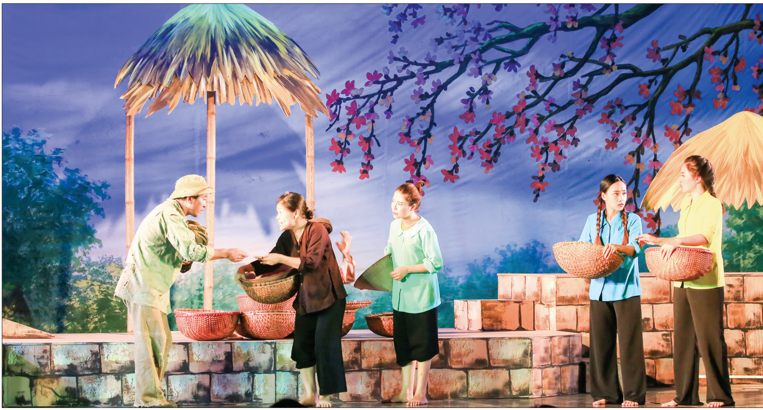
Một cảnh trong vở chèo "U vẫn đợi con về".

Cùng với vở chèo "U vẫn đợi con về", tham gia liên hoan nghệ thuật chèo chuyên nghiệp quốc tế tổ chức vào tháng 9/2019 tại tỉnh Bắc Giang, Nhà hát Chèo Thái Bình còn tổng duyệt vở diễn "Trọn nghĩa non sông".