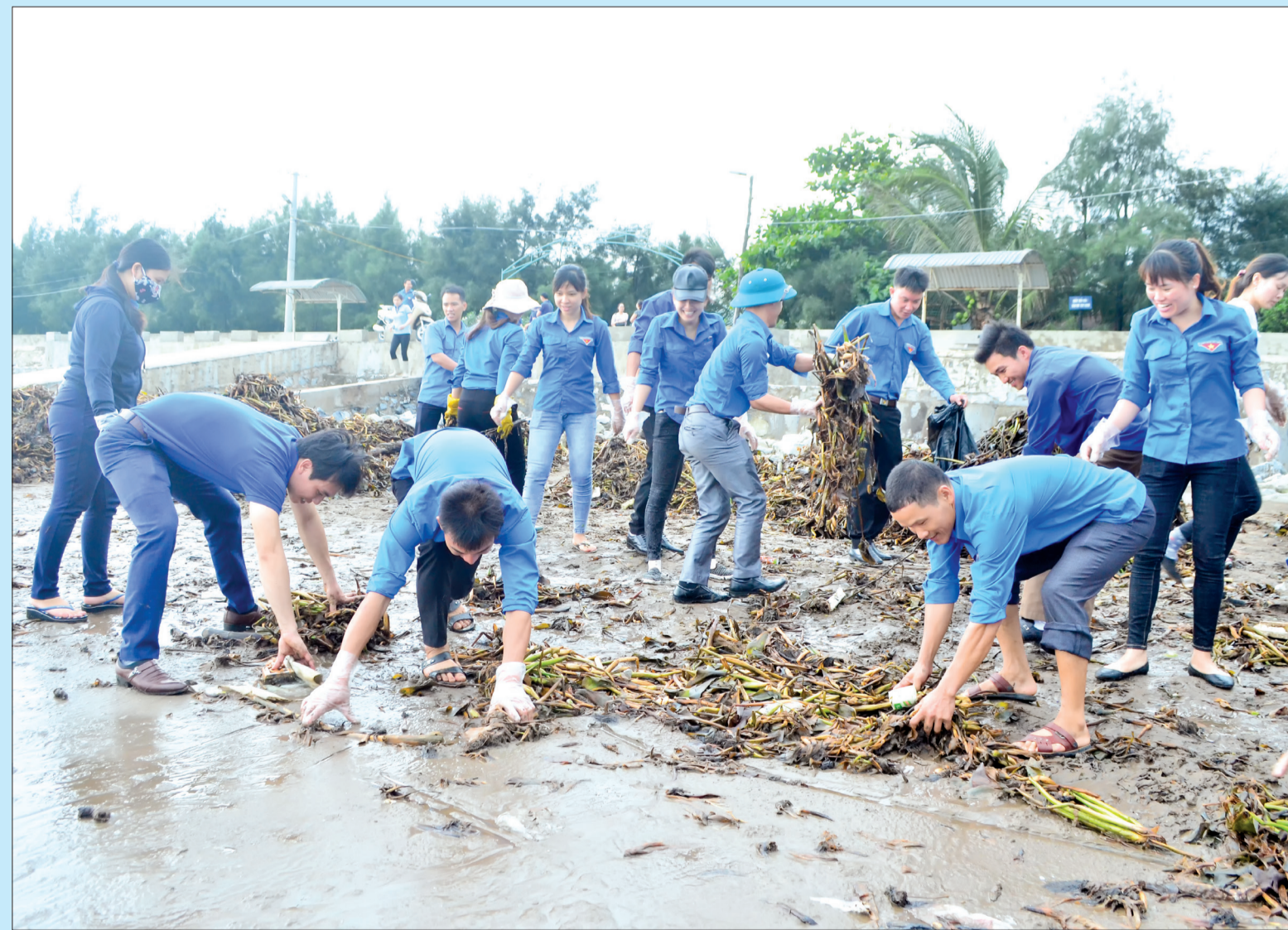
Tuổi trẻ khởi các cơ quan tỉnh tham gia vệ sinh môi trường.