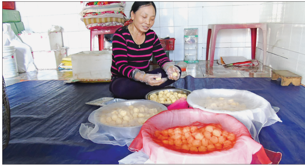
Bộ tiêu chí mới quy định 100% hộ dân và cơ sở sản xuất, kinh doanh thực phẩm tuân thủ các quy định về bảo đảm an toàn thực phẩm.

Cương trình mục tiêu quốc gia về xây dựng nông thôn mới (NTM) ở Thái Bình đã đi được chặng đường 7 năm. Từ chương trình này, diện mạo nhiều vùng quê đổi thay rõ rệt, đời sống vật chất cũng như tinh thần của người dân từng bước được nâng lên. Tuy nhiên, sau Quyết định số 1980 của Thủ tướng Chính phủ về việc ban hành Bộ tiêu chí quốc gia về xã NTM giai đoạn 2016 - 2020 đã đặt ra những thách thức mới với cả những xã đã đạt chuẩn và những xã chưa hoàn thành xây dựng NTM.