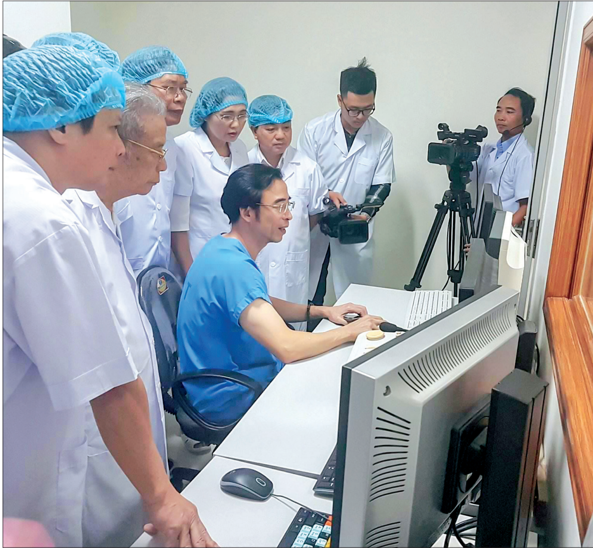
Bệnh viện Đa khoa tỉnh triển khai nhiều kỹ thuật mới trong khám và điều trị bệnh.

Nhìn lại một năm tự tin, vượt khó, ngành Y tế Thái Bình tự hào với những thành tựu đạt được, đặc biệt trong việc nâng cao chất lượng công tác dự phòng và điều trị. Không chỉ đáp ứng nhu cầu bảo vệ, chăm sóc sức khỏe ngày càng cao của nhân dân, Y tế Thái Bình còn khẳng định tiếp tục có bước tiến vững mạnh.