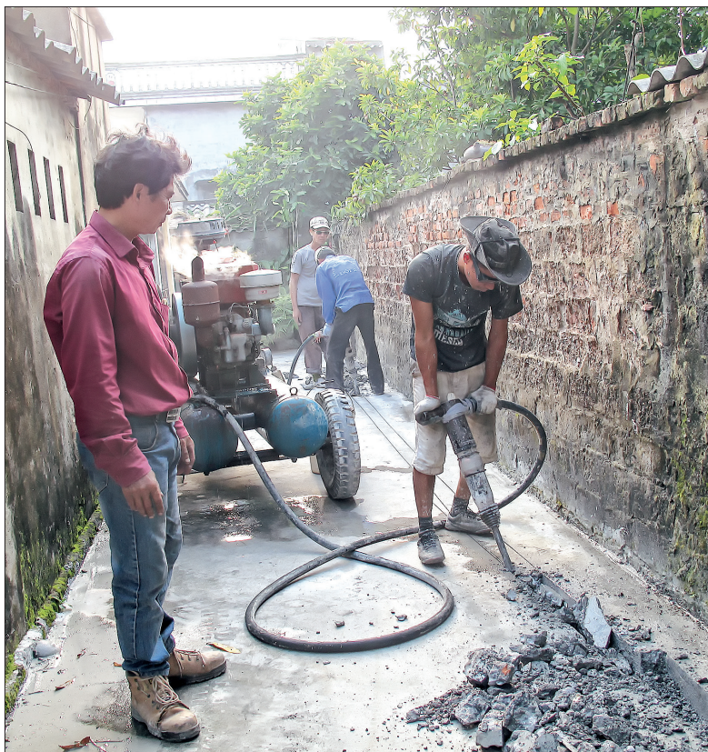
Lắp đặt đường ống cấp nước tại xã Thái Hà (Thái Thụy).

Nhà máy nước sạch Thái Dương được Công ty Cổ phần Casaro miền Bắc xây dựng tại xã Thái Dương từ tháng 3/2016 với công suất 8.000m 3 /ngày đêm phục vụ nhân dân 7 xã của huyện Thái Thụy: Thái Giang, Thái Sơn, Thái Hà, Thái Phúc, Thái Dương, Thụy Thanh, Thụy Phong. Hết năm 2016, Công ty đã hoàn thành xây dựng công trình đầu mối, lắp đặt đường ống trục chính cấp nước sạch đến trung tâm 7 xã. Tuy nhiên, đến đầu tháng 11/2017 chỉ có xã Thái Dương hoàn thành 100% hệ thống mạng lưới đường ống tới các thôn; 6 xã còn lại đang triển khai thực hiện với mức độ hoàn thành từ 75 - 95%. Việc Công ty triển khai lắp đặt đường ống cấp nước tới các thôn chậm đã phần nào khiến tỷ lệ hộ dân sử dụng nước sạch tại các xã đạt thấp. Đến đầu năm 2017, nhà máy nước sạch Thái Dương mới đạt gần 20% tỷ lệ hộ dân sử dụng nước. Trước tình hình đó, ngày 9/11, tại buổi kiểm tra tiến độ thực hiện dự án, đồng chí Phạm Văn Sinh, Bí thư Tỉnh ủy đã yêu cầu Công ty thực hiện đúng cam kết đến hết ngày 30/11/2017 hoàn thiện 100% đường ống truyền tải nước sạch trên địa bàn các thôn của 7 xã. Theo lãnh đạo Công ty, nguyên nhân khiến tiến độ lắp đặt đường ống cấp nước tới các thôn chậm chủ yếu là do yếu tố khách quan. Trong đó, liên quan đến vấn đề Công ty thu tiền lắp đặt đồng hồ của các