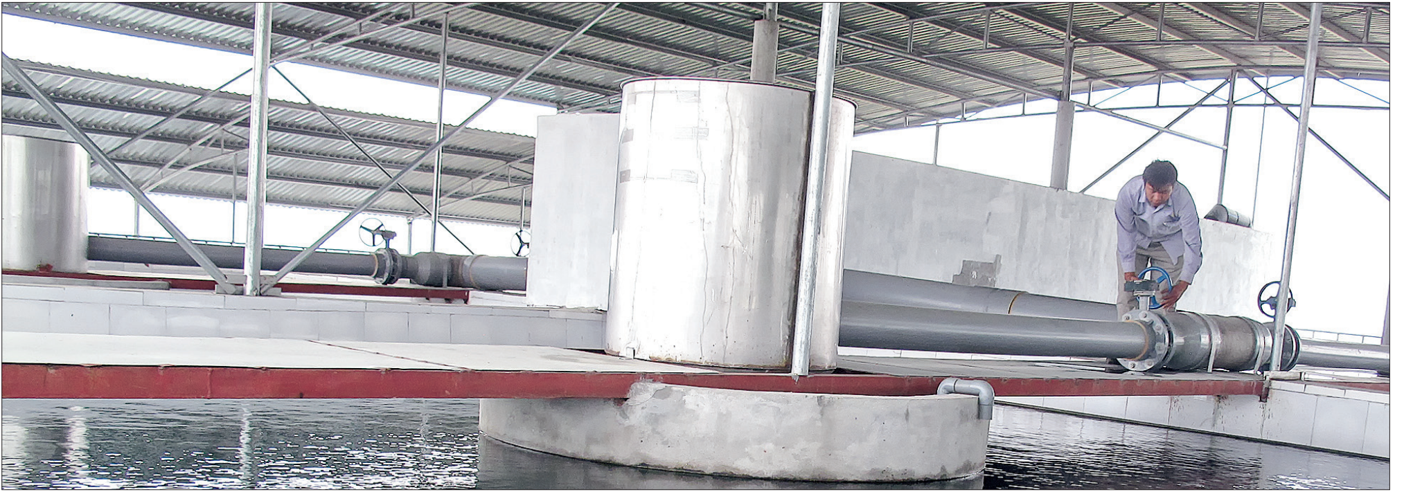
Hệ thống xử lý nước của nhà máy.