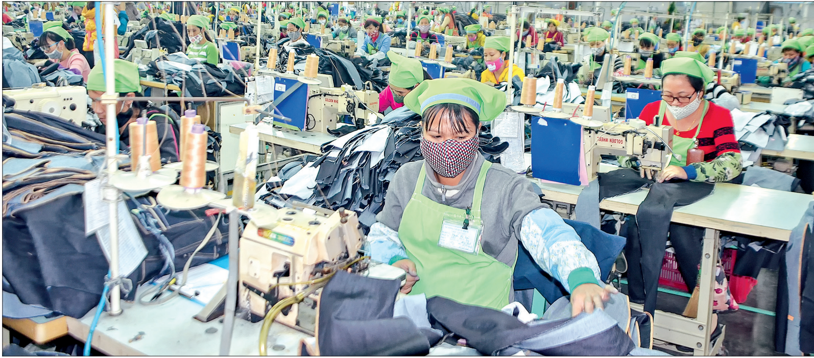
Sự quan tâm của tổ chức công đoàn giúp người lao động yên tâm làm việc.