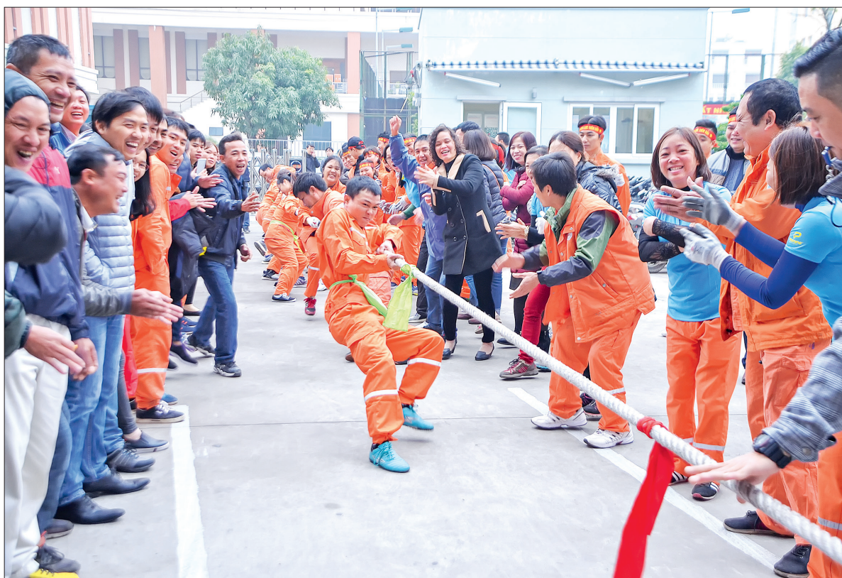
Các hoạt động thể dục thể thao tạo mối quan hệ gắn bó, đoàn kết giữa người lao động.

Với phương châm "Mỗi hoạt động của công đoàn đều hướng về cơ sở, lấy cơ sở làm địa bàn hoạt động, lấy đoàn viên và người lao động là đối tượng tuyên truyền, vận động", hoạt động của tổ chức công đoàn năm qua đã có sự đổi mới, sáng tạo trong triển khai thực hiện, phù hợp với từng đơn vị, doanh nghiệp. Tại các khu công nghiệp, tổ chức công đoàn tạo mọi điều kiện để người lao động nâng cao trình độ, tay nghề cho công nhân viên chức lao động (CNVCLĐ) thông