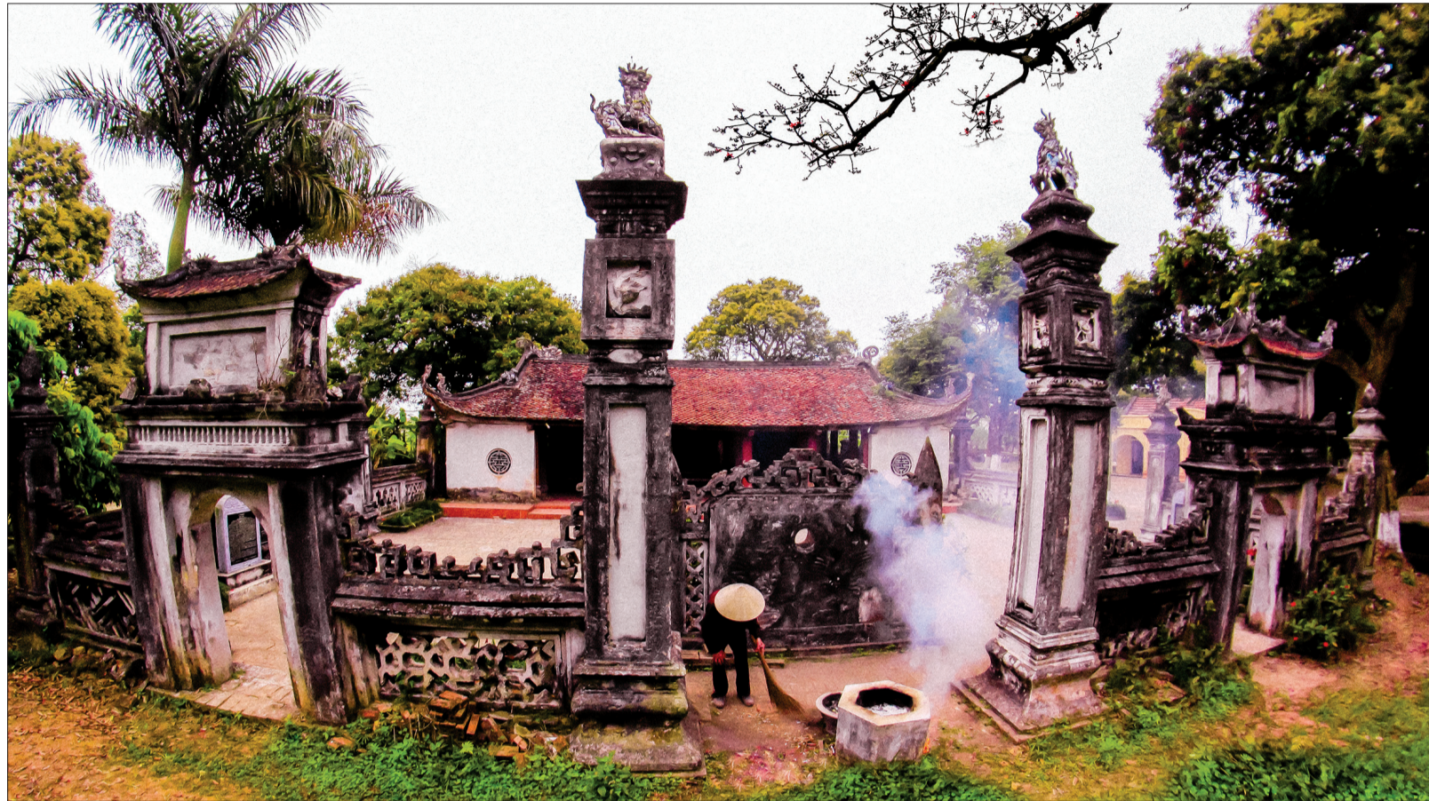
Miếu Hai Thôn, trang An Đế, hương Mãn Đế, nay là xã Xuân Hòa, huyện Vũ Thư - nơi thờ Lý Nam Đế.

Truyền ngôn rằng: Lũy vua tiên Lý (Lý Nam Đế) đắp là lũy Hồ, tu thất của vua đặt ngay tại đất miếu Hai Thôn (xã Xuân Hòa, huyện Vũ Thư ngày nay).