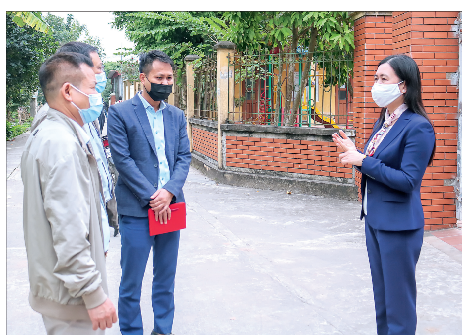
Đồng chí Trần Thị Bích Hằng, Tỉnh ủy viên, Phó Chủ tịch UBND tỉnh, Phó Trưởng ban thường trực Ban Chỉ đạo phòng, chống dịch Covid-19 tỉnh kiểm tra khu cách ly, điều trị cho học sinh mắc Covid-19 xã Chương Dương (Đông Hưng).

điều trị. Huyện Đông Hưng thường xuyên tổ chức xét nghiệm sàng lọc Covid-19 tại các trường học và