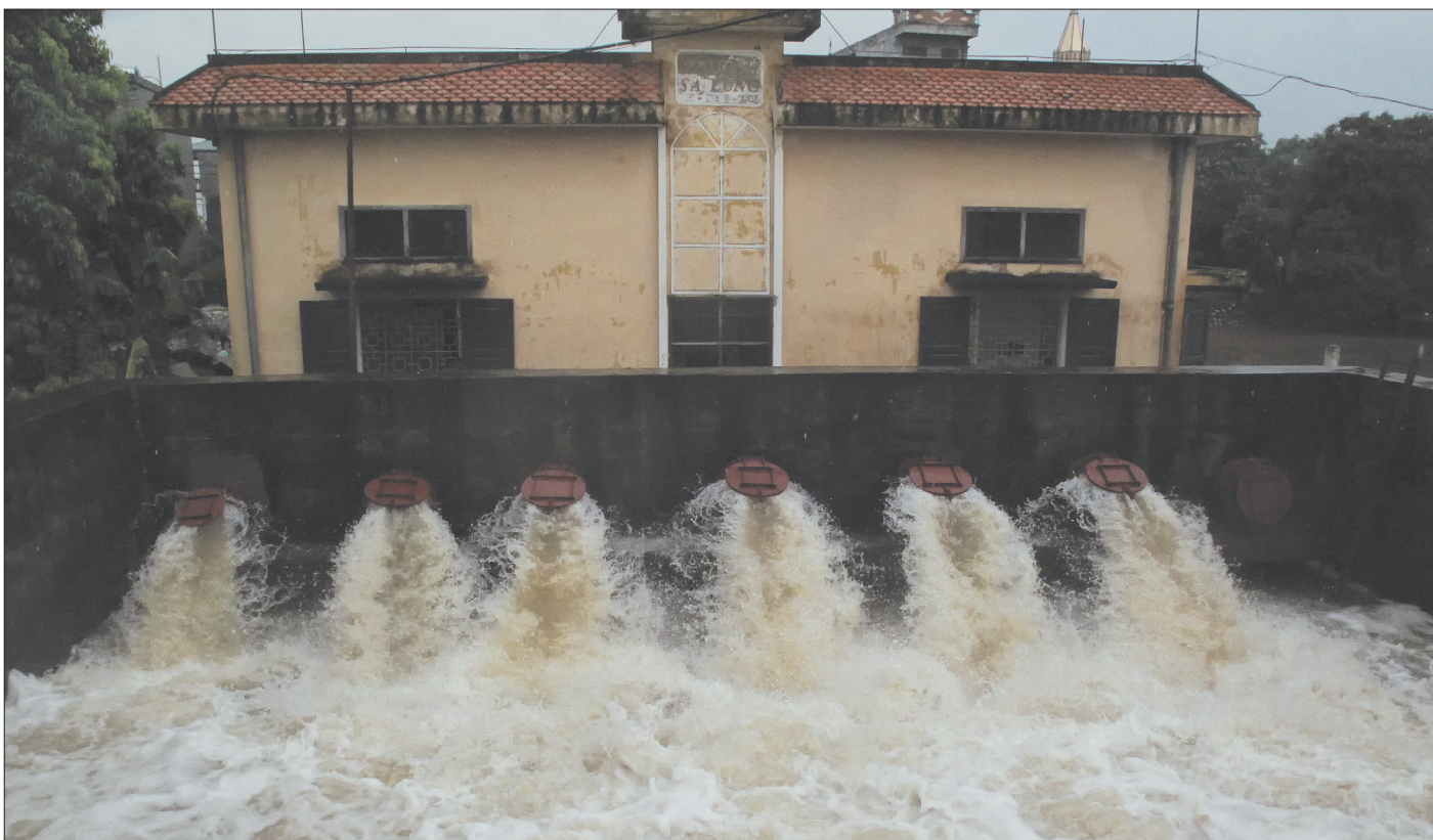
Trạm bơm Sa Lung (phường Hoàng Diệu, thành phố Thái Bình) đáp ứng tối việc tiêu thoát nước.

Theo dự báo, năm 2019 tiếp tục là năm thiên tai có nhiều diễn biến phức tạp, bất thường. Để chủ động ứng phó với biến đổi khí hậu, hạn chế thấp nhất thiệt hại về người và tài sản trong mùa mưa bão năm nay, thành phố Thái Bình đã và đang tập trung chuẩn bị các phương án cụ thể với phương châm "4 tại chỗ".