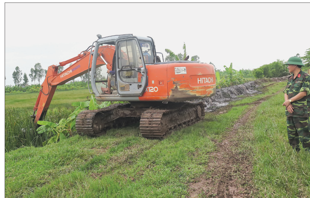
Hàng năm, xã Hồng Tiến (Kiến Xương) chủ động gia cố những đoạn đề xung yếu, bảo đảm an toàn trong mùa mưa bão.