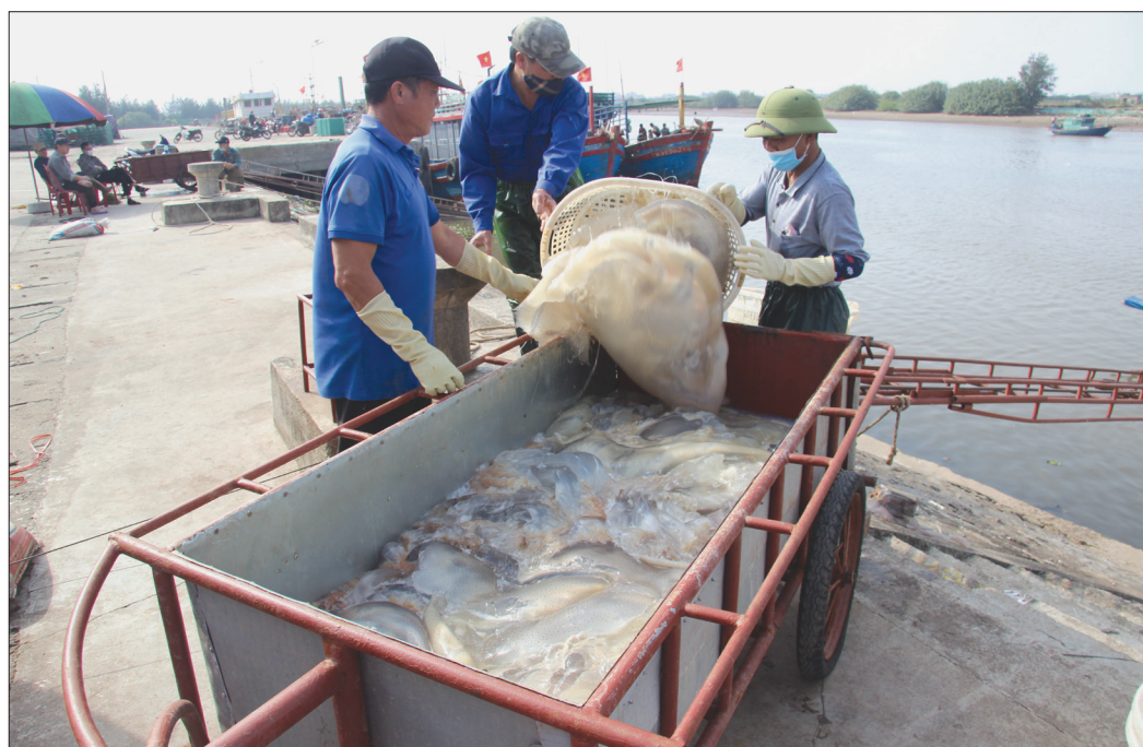
Thu mua hải sản của ngư dân tại cảng cá Cửa Lân (Tiên Hải).

Từ đầu năm đến nay, ngư dân huyện Tiên Hải gặp rất nhiều khó khăn do ảnh hưởng của dịch Covid-19, sức mua hải sản giảm, giá cả hàng hóa xuống thấp, cùng với đó hiện nay chi phí vật tư phục vụ sản xuất như xăng, dầu và giá nhân công tăng cao dẫn đến hiệu quả đánh bắt hải sản của ngư dân giảm mạnh.