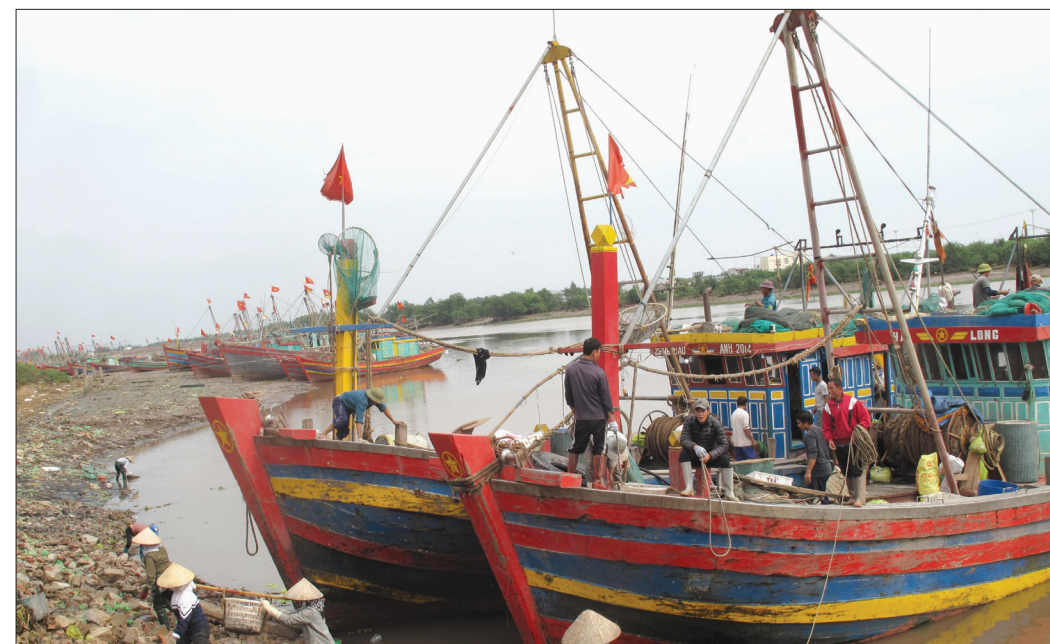
Ngư dân xã Thụy Xuân (Thái Thụy) nỗ lực thực hiện các giải pháp nhằm giảm chi phí sản xuất, duy trì hoạt động khai thác.