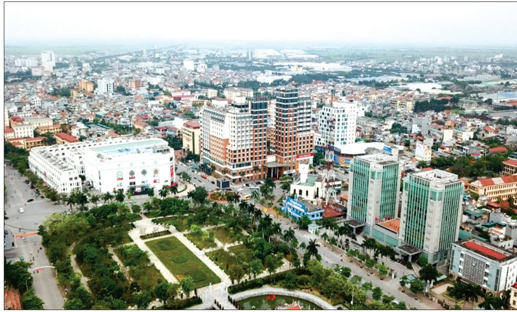
Quê hương Thái Bình đổi mới và phát triển.

Tháng 3 này, Đảng bộ và nhân dân Thái Bình hướng về kỷ niệm 132 năm ngày thành lập tỉnh (21/3/1890 - 21/3/2022). Trong dòng chảy lịch sử hào hùng ấy, Đảng bộ tỉnh Thái Bình tự hào đã lãnh đạo quần và dân trong tỉnh vượt qua muôn vàn khó khăn, gian khổ, chiến đấu, hy sinh, lập nên những kỳ tích về vang, đóng góp xứng đáng vào quá trình đấu tranh giải phóng dân tộc, xây dựng và phát triển quê hương, đất nước. Chưa bao giờ Thái Bình có điều kiện thuận lợi để phát triển như hôm nay, thế và lực của tỉnh được khẳng định rõ nét.