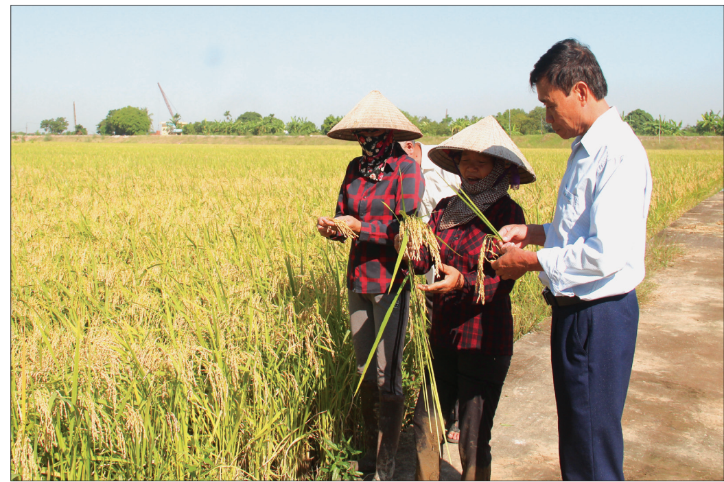
Tuy vụ đầu gieo cấy nhưng nhiều nông dân xã Thụy Ninh đã "kết" giống nếp A Sào.

Đo ảnh hưởng của cơn bão số 4 và đợt mưa kéo dài nhiều ngày trong thời gian qua khiến nguồn cung rau giảm, giá rau các loại trên địa bàn tỉnh tăng mạnh.