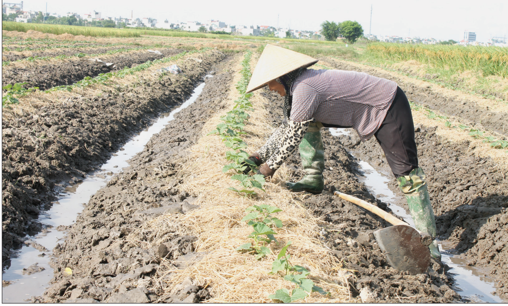
Nông dân huyện Vũ Thư khắc phục khó khăn, tranh thủ khung thời vụ tốt nhất tiến hành gieo trồng cây vụ đông.

Đợt mưa lớn kéo dài vừa qua đã ảnh hưởng đến tiến độ thu hoạch lúa mùa trà sớm, đồng thời gây ướt nhão, đọng nước mặt ruộng. Mặc dù vậy, nông dân huyện Vũ Thư quyết tâm khắc phục khó khăn, tranh thủ khung thời vụ tốt nhất để gieo trồng cây vụ đông.