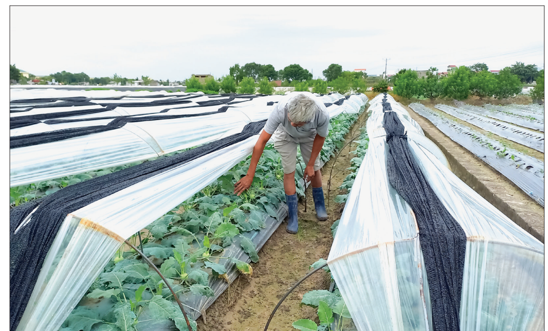
Nông dân xã Quỳnh Hải (Quỳnh Phụ) chăm sóc rau màu.