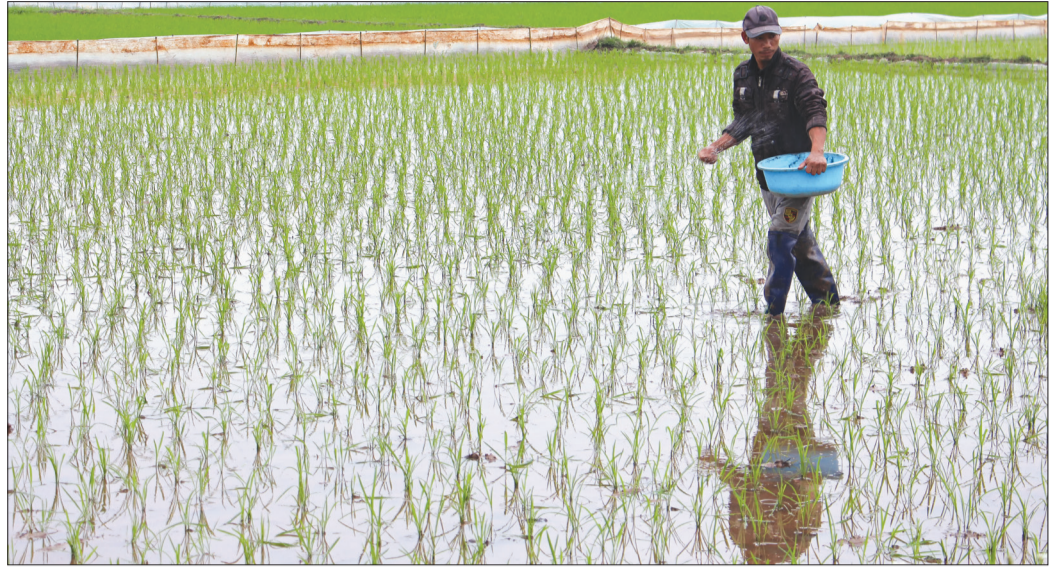
Nông dân xã Thụy Phong (Thái Thụy) bón thúc cho lúa xuân mới cấy.

Để bảo đảm lúa xuân phát triển tốt, năng suất cao, ngành Nông nghiệp huyện Thái Thụy đang dồn sức, hướng dẫn nông dân tích cực chăm sóc và bảo vệ lúa.