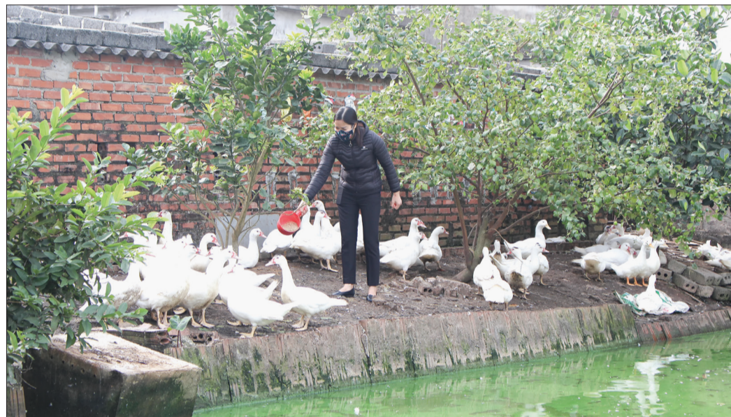
Nông dân xã Minh Quang (Kiến Xương) phát triển chăn nuôi từ vốn vay ưu đãi của Chính phủ.

Kết thúc năm 2020, mặc dù tỷ lệ nợ xấu trong cho vay ưu đãi chung toàn quốc chiếm 0,21% tổng dư nợ thì tại Thái Bình tỷ lệ nợ xấu của Ngân hàng Chính sách xã hội (CSXH) Chi nhánh tỉnh chỉ chiếm 0,13% tổng dư nợ. Để có được kết quả đó, thời gian qua, Ngân hàng CSXH Chi nhánh tỉnh chủ trương thực hiện các giải pháp nâng cao chất lượng tín dụng, từ đó giúp đồng vốn ưu đãi của Chính phủ được sử dụng hiệu quả hơn.