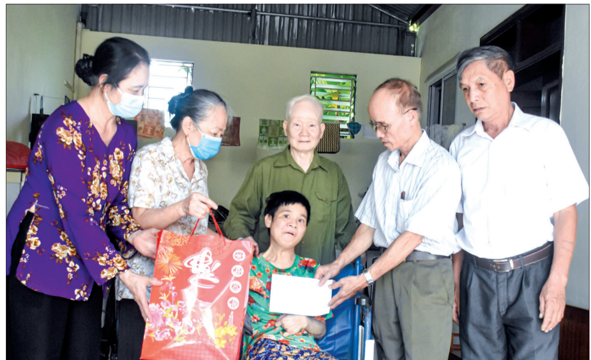
Hội Nạn nhân chất độc da cam/Đioxin các cấp thăm hỏi và trao quà cho gia đình người hoạt động kháng chiến và con đẻ của họ bị nhiễm chất độc hóa học trên địa bàn thành phố Thái Bình.