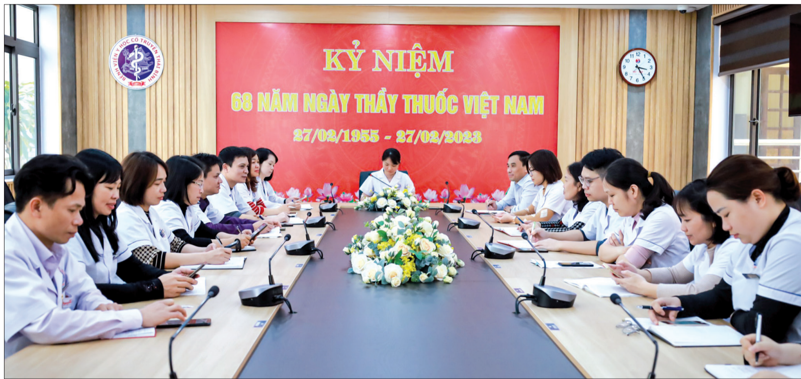
Sinh hoạt chi bộ tại Bệnh viện Y học cổ truyền.

Những năm qua, các cấp ủy, tổ chức đảng trong Đảng bộ Khối các cơ quan tỉnh đã tích cực, chủ động đề ra các giải pháp tăng cường công tác quản lý và nâng cao chất lượng đảng viên, góp phần nâng cao năng lực lãnh đạo, sức chiến đấu của tổ chức cơ sở đảng, đáp ứng yêu cầu nhiệm vụ trong tình hình mới.