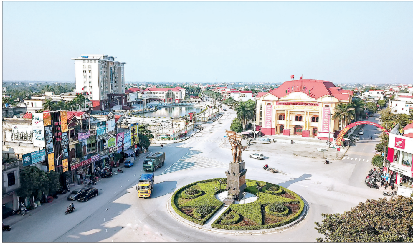
Thị trấn Tiên Hải - quê hương tiếng trống năm 1930.

Vừa mới thành lập, Đảng bộ Thái Bình đã phát động, lãnh đạo phong trào cách mạng sôi nổi, mạnh mẽ trong toàn tỉnh, điển hình là hai cuộc biểu tình “long trời lở đất” của nông dân Duyên Hà - Tiên Hưng (ngày 1/5/1930) và nông dân Tiên Hải (ngày 14/10/1930), đóng góp quan trọng cho phong trào cách mạng những năm 1930 - 1931 của Đảng.