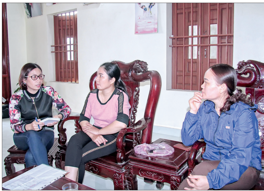
Phóng viên Báo Thái Bình làm việc với thân nhân những người bị lừa đi du học nước ngoài ở huyện Đông Hưng.