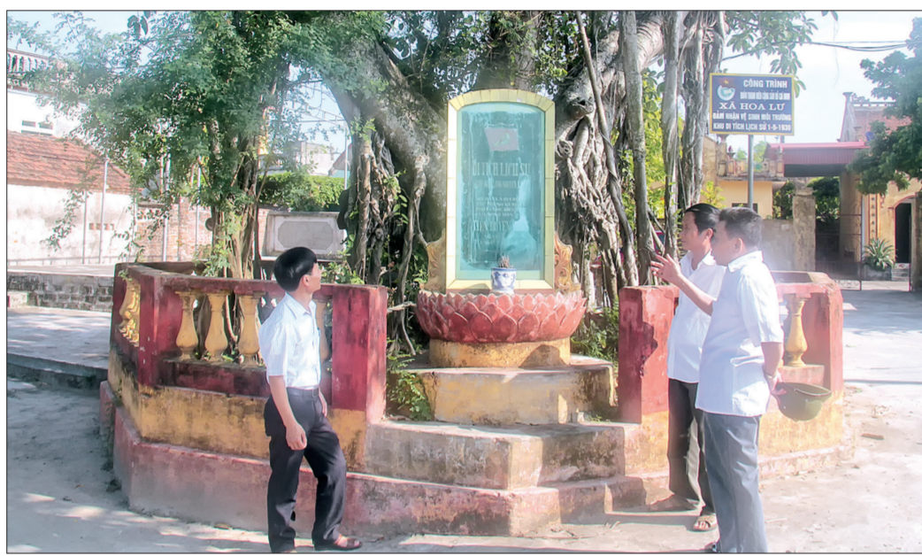
Cây đa ở xã Hoa Lư (Đông Hưng) - nơi diễn ra cuộc biểu tình của nông dân Tiên Hưng - Duyên Hà ngày 1/5/1930.

Hưởng ứng cao trào cách mạng rộng lớn trong cả nước do Trung ương Đảng phát động nhân ngày Quốc tế Lao động 1/5, Tỉnh ủy Thái Bình đã phát động một cuộc đấu tranh lớn chưa từng có nhằm biểu dương sức mạnh của quần chúng, giải quyết một số yêu cầu cấp bách của đời sống nhân dân, phản đối hành động đàn áp dã man của thực dân Pháp. Lực lượng chính và mũi nhọn cuộc biểu tình giao cho