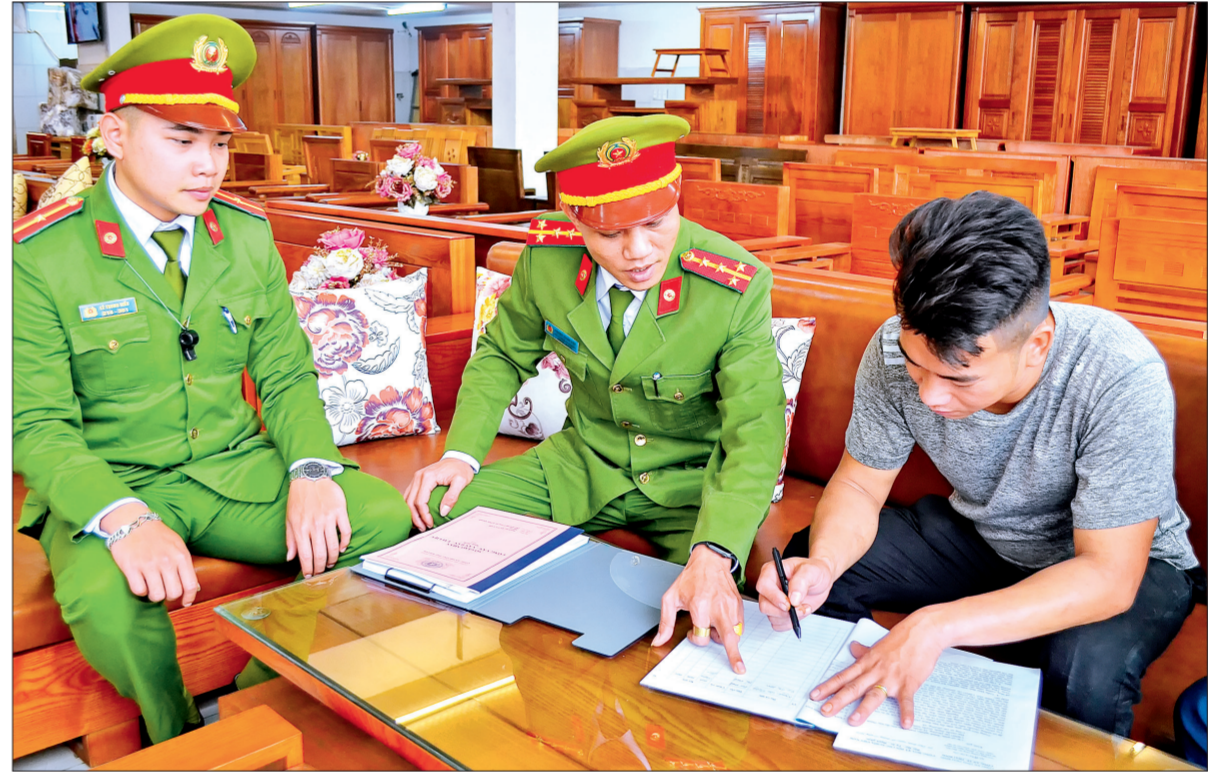
Công an phường Phú Khánh (thành phố Thái Bình) tổ chức cho các hộ kinh doanh ký cam kết bảo đảm trật tự đô thị, an toàn giao thông, vệ sinh môi trường.