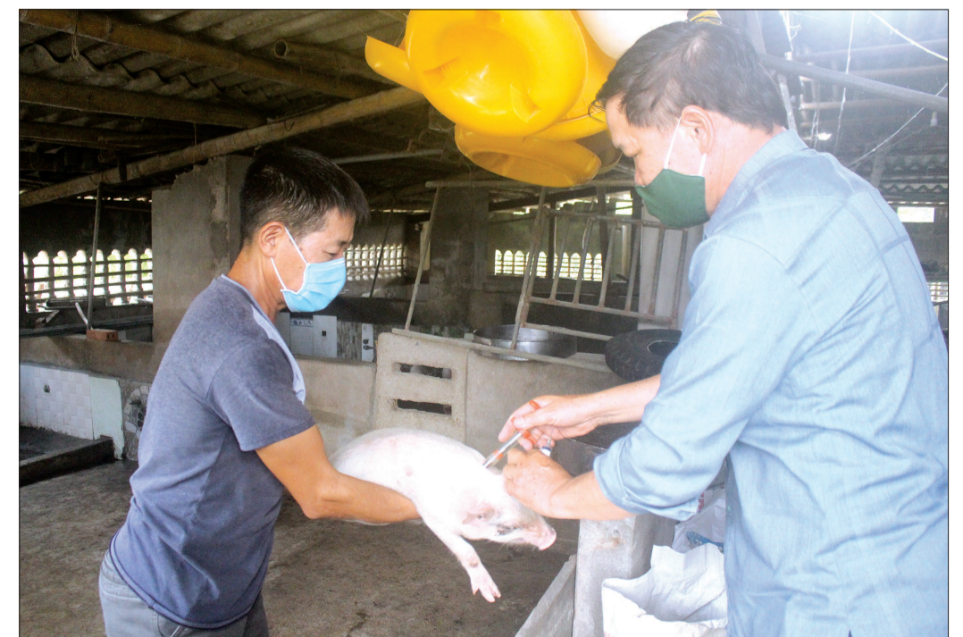
Người chăn nuôi thực hiện nghiêm việc tiêm vắc-xin phòng bệnh cho đàn lợn.