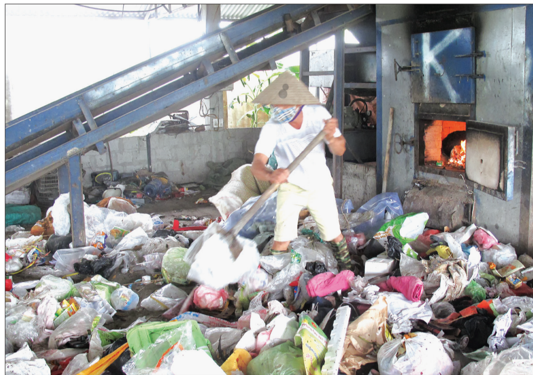
Lò đốt rác xã Minh Khai (Hưng Hà) hoạt động hiệu quả.

Đến nay, 100% xã, thị trấn trong huyện đã đầu tư xây dựng khu xử lý rác thải sinh hoạt, trong đó 22 xã, thị trấn đầu tư theo công nghệ lò đốt kết hợp chôn lấp, 13 xã xử lý bằng hình thức chôn lấp thông thường; đồng thời, kiện toàn gần 300 tổ thu gom rác thải với gần 670 người, sản xuất thu gom 2 - 3 lần/tuần, bảo đảm thu gom 95% lượng rác thải phát sinh trên địa bàn huyện. Hàng năm, Phòng Tài nguyên và Môi trường phối hợp cùng các phòng, ban, ngành, đoàn thể huyện, các xã thực hiện lồng ghép nội dung bảo vệ môi trường (BVMT) trong các hội nghị, lớp tập huấn, buổi sinh hoạt khu dân cư; tổ chức nhiều hoạt động thiết thực hướng ứng ngày Môi trường thế giới, Tuần lễ quốc gia về nước sạch và vệ sinh môi trường nông thôn, Chiến dịch làm cho thế giới sạch hơn (ra quân vệ sinh môi trường tại khu dân cư, khơi thông dòng chảy,